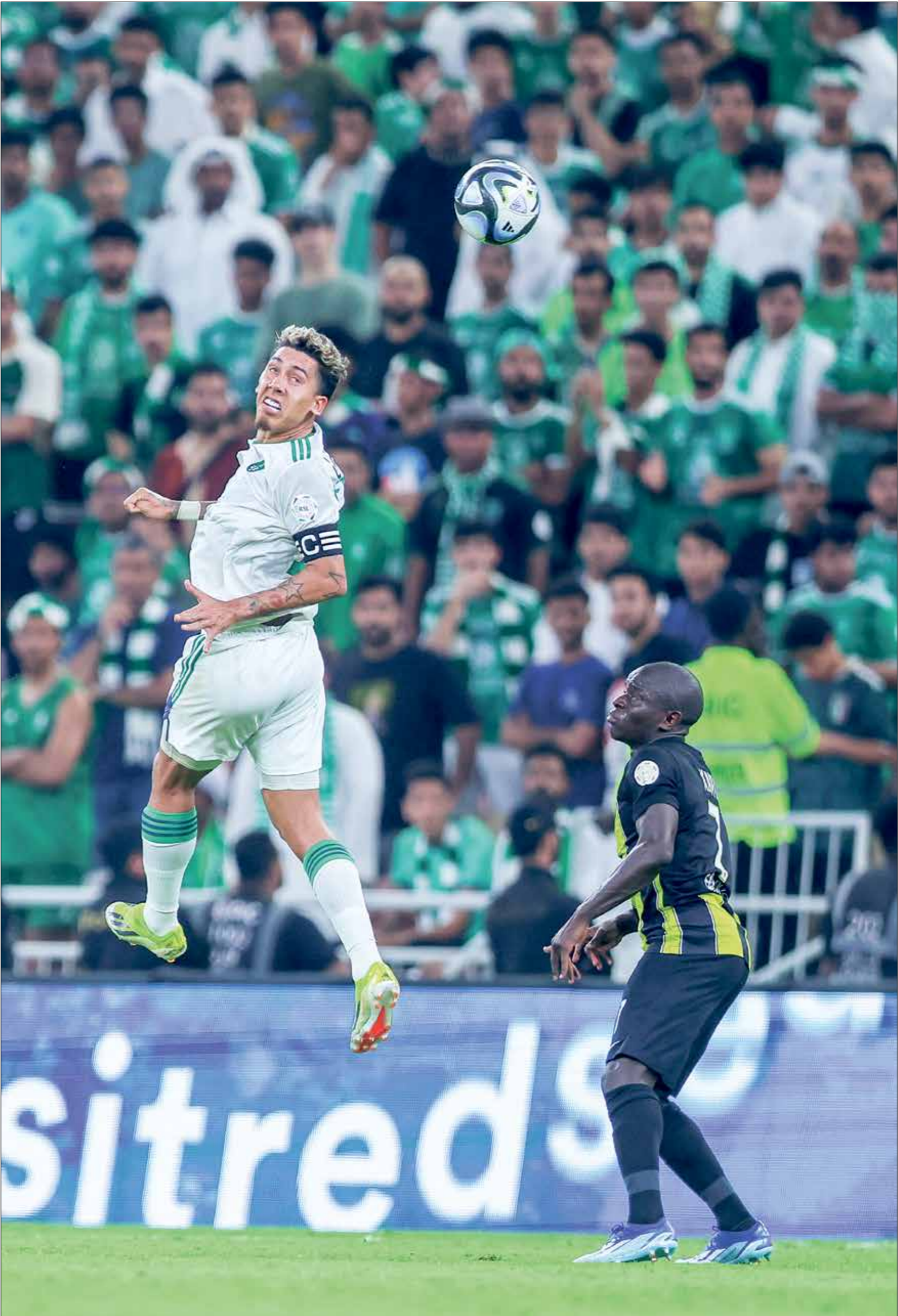
قمة مُنتظرة بين افضل اللجوم في كرة القدم السعودية

يملك نادي الاتحاد خطاً هجومياً قوياً يتمثل بحضور نجمين سجلا أكبر عدد من الأهداف في هذا الموسم، وهما المهاجم الفرنسي، كريم بنزيمة، الذي سجل ثمانية أهداف ويحتل وصافة ترتيب الهدفين حتى الآن، خلف مهاجم الهلال، الكسندر ميتروفييتش (عشرة أهداف)، في وقت