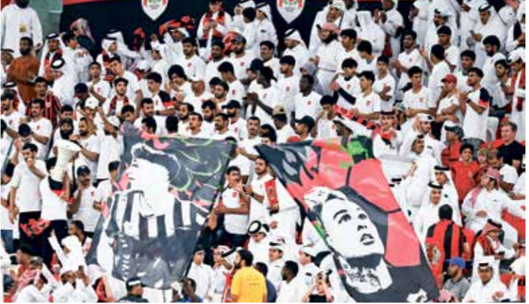
جماهير الريان تحم فرقهها في اعلن مواجهاله