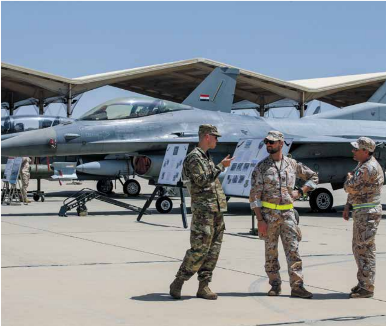
جنديان ايطاليان وآخر اميركي قرب بغداد. ابريله 2024

بوشر الحديث عن وضع تصورات للانسحاب الاميركي من العراف في المستقبل القريب، فيما يتوقع مراقبون عدم حصول ذلك بالكامل، للأسباب السياسية وامنية، تحديدا لجهة خطر عودة تنظيم داعش الى الواجهة