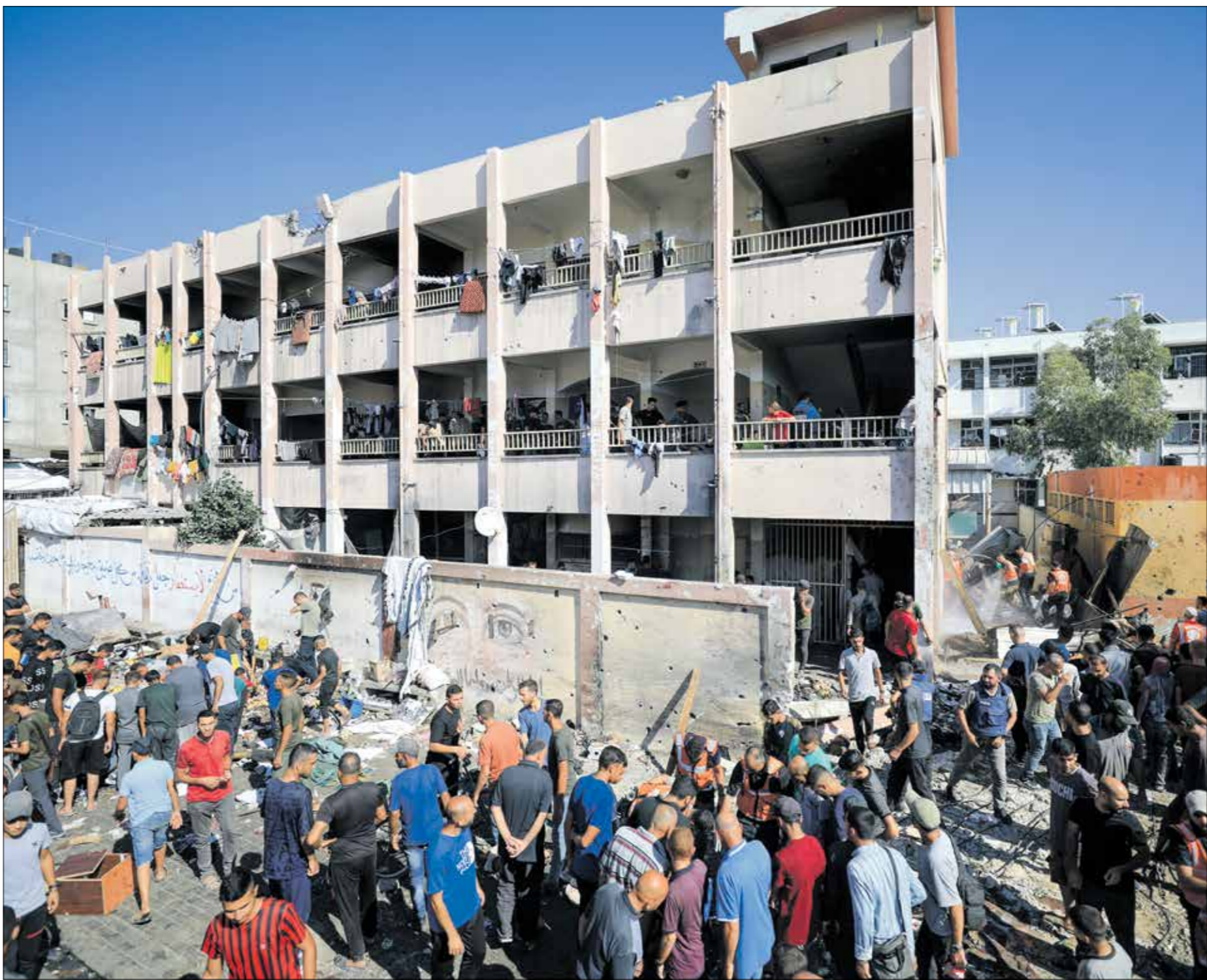
بعد قصف المدرسة في جباليا أمس

مواطنان، مساء أمس، عقب قصفهما من قبل مستبرة لاحتلال في مدينة رفح، جنوبي القطاع، في غضون ذلك، تتحضر الفصائل الفلسطينية للقاء محتمل في القاهرة لبحث رؤية موحدة لـ«اليوم التالي للحرب، في وقت لا يلوح في الأفق أي احتمال لقرب التوصل إلى وقف لإطلاق النار في غزة في