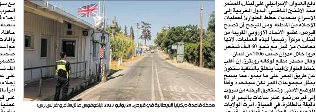
مدخل قاعدة ديكليا البريطانية في قبرص. 20 يوليو 2023

دفع العدوان الإسرائيلي على لبنان، المستمر منذ الأوان الماضي، الدول الغربية إلى الإسراع بتحديث خطط الطوارئ لتعليقات الإجماع من المنطقة، ومن المرجح أن تصبح قبرص، عضو الاتحاد الأوروبي الغربية من لبنان، مركزاً رئيسياً لهذه العمليات، لأنها تعاملت من قبل مع نحو 60 ألف شخص فروا خلال عدوان صيف 2006 من لبنان. وقال مصدر مطلع لوكالة رويترز، إن أغلب خطط الطوارئ فيما يتعلق بالتفقيذ ستكون على طريق العرج على ما يبدو، مما يسبح بنقل مجموعة من لبنان، وأكدت المصادر أن وزارة التوضع الأمني وستعقد الرحلة من بيروت إلى قبرص في وقت غير ساعات بالبحر أو 40 دقيقة بالطائرة، في السياق، أمرت الولايات المتحدة بنشر العشرات من قواتها في قبرص للمساعدة في الاستعداد لأي سيناريوهات بين اللبنانيين، تجسّع فيها المهايرون من لبنان. وقال مسؤولان أميركيان له «ويوترز»، إن نشر عدد صغير من الجنود الأميركيين في الشرق الأوسط، قد يساعد الجيش الأمريكي في الاستعداد لسيناريوهات مثل إجلاء المواطنين من لبنان، وذكر المسؤولون أن هذه الخطوة احترازية وتأتي في الوقت الذي حذر فيه الرئيس جو بايدين من اندلاع حرب شاملة، بينما تحدثت إسرائيل علانية عن توغل برمي محتمل في جنوب لبنان. وفي حين حثت واشنطن المواطنين الأميركيين على مغادرة لبنان، فإن وزارة الخارجية الأميركية لم تأمر بإجلاء المواطنين من هناك، ولم تطلب أي مساعدة حتى الآن من القوى الأجنبية لإجلاء المواطنين، بحسب وكيلتين أميركيين.