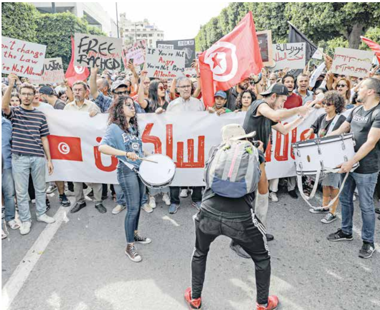
تونسيون معارضون لتعديل القانون الانتخابي في العاصمة، 22 سبتمبر 2024

في غضون ذلك، تصاعدت جبهات المعارضة لهذا التعديل ولمسار الانتخابي ككل. ودعت الشبكة التونسية للحقوق والحريات إلى تجمّع احتجاجي، اليوم الجمعة، أمام مجلس النواب الذي وصفته بـ«اللاشرعي الذي يسعى للانتقال على إرادة الشعب من خلال مناقشة مشروع قانون لتعديل القانون الانتخابي قبل أسبوعين من الانتخابات، يهدف من خلاله لتهميش دور القضاء الإداري والقضائي المالي، ويلغي به الأمان القانوني ويكرّس من خلاله إنكار العدالة