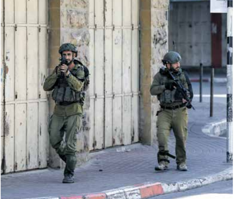
جنديان من قوات الاحتلال خلال اقتحام جورا أمس