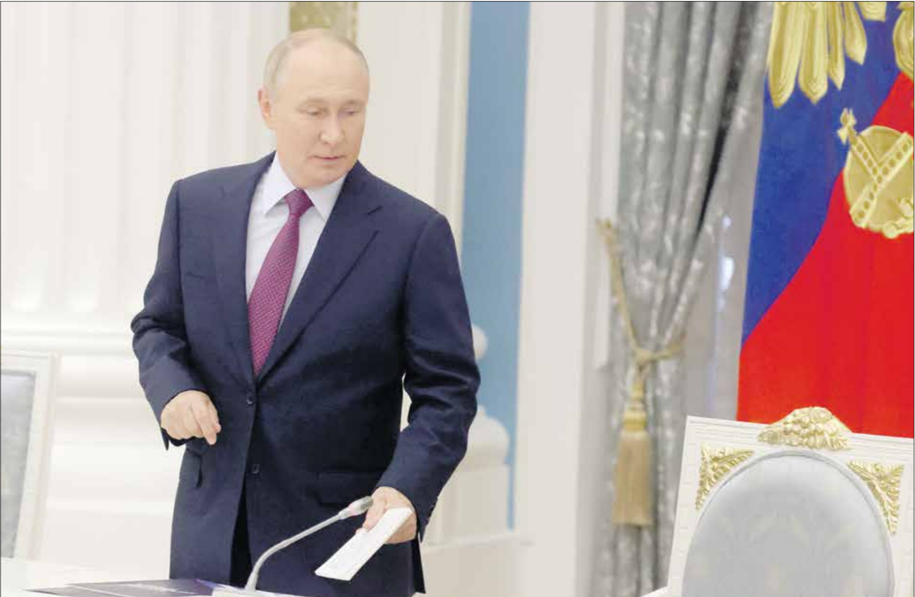
بوتين خلال رئاسة مجلس الدولة في الكرملين اول من امس

صواريخ بالستية لمهاجمة اراضي روسيا او حلفائها، والشروط الثاني هو استخدام العدو سلاحاً نووياً أو غيره من أسلحة الدمار الشامل بحق روسيا أو حلفائها. أما الشرط الثالث فهو مهاجمة العدو منشآت حكومية أو عسكرية روسية حيوية بهدف تعطيل ردة فعل القوات النووية الروسية، يذكر أن العقيدة النووية الروسية بنسختها الحالية المؤرخة بعام 2020 تحدد أربعة شروط لاستخدام السلاح النووي. الشرط الأول ورود معلومات موثوق بها بانطلاق