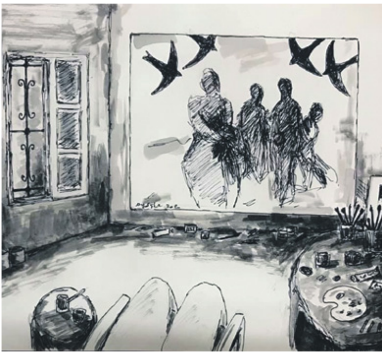
رسم للفنان الفلسطيني ماجد شلا

وعلى سيرة الخبز والماء، في ظل هذا الخراب الذي نعيش، أذكر قول بوذا: دعوا خبزكم على عتبات كهوفكم للجانحين وتركوا بعض الثمار على غصونها لعابري الطريق. يريد أن يقول لنا هذا الرجل يا حبيبتي، «الناس لازم تكون لبعضها البعض» في هذه الظروف المعقدة، لأن هذه الحقبة -اقتصاد- سوف تكون معياراً لحماتنا في المستقبل.. الحرب غربلت ناساً كثيرين، يقول رجل بلغ الثمانين عاماً ويضيف: فيها عرفنا المنيح من العاطل، والهامل راح تظل سيرتو معو، وابن العز يا ولدي عمرو ما ينهان حتى لو تقصد البعض هاي الإهانة، ترفع لتسمو، وسائل أنتظر: متي تنتهي الحرب يا رب .. وهل هذا الذي نحن فيه حقيقة فعلاً أم هو مجرد خيال شاعر من الصور، وما أنا أحاول أن أخيل من علو .. يقولون من فوق جبل يرى المرء كل شيء بوضوح أكثر. إذا كتب لي الله النجاة سوف أكتب أكثر عن هذه الحرب، وما خلفته من معاناة ومأساة لم تحدث لا في العصور الغابرة، ولا في العصر الحديث، هذه إبادة منظمة وكان كل شيء معد لنا سلفاً.