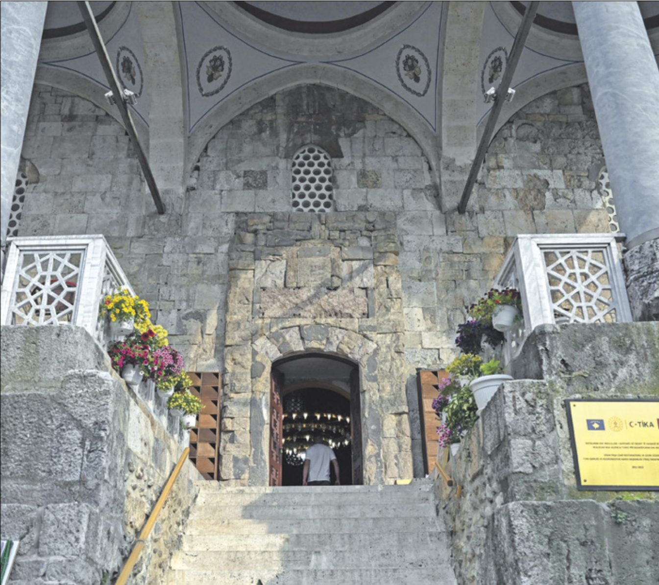
مدخل جامع ستان باشا في مدينة برزرن بعد لرحيمه الأخير

باسم العائلة «شارع ال شورتا» بسبب خُان أو فندق بناه جده، وهو ما سمح للعائلة بأن تعتني به.بعد أن التحق بالكتاب وتعلم أساسيات العلوم الدينية تابع دراسته في إحدى أشهر المدارس في بريزرن (مدرسة محمد باشا) التي تعلم فيها علوم الدين واللغة العربية التي أجادها. وفي السنة التي تخرج بها من هذه المدرسة (1896) ذهب إلى الحج، وهي المرحلة التي كانت تستغرق حوالي سنة في الذهاب والإياب، ولكنه استفاد منها للترنود بأصهار الخبز في الفقه واللغة العربية، التي لا تزال محفوظة وتسنّ مصادر ثقافته الفقهية وإجادته للغة العربية. وقد عيّن بعد عودته مدرسا للغة العربية في المدرسة التي تخرّج منها، وهو الذي جعله يتمكّن من الخلف في اللغة العربية كأحد الناطقين بها. إلى أن عيّن مفتيا لمدينة في 1917.