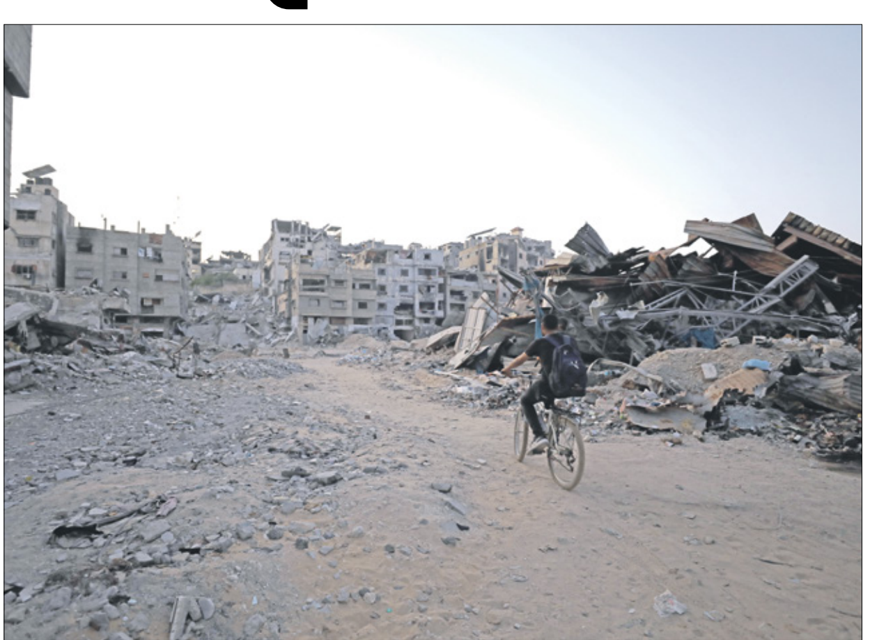
ماثق فلسطيني يمر بجوار حطه من بين الانقاض في حثج الشجاعية بمدينة غزة، 21 تموز/ يوليو 2024