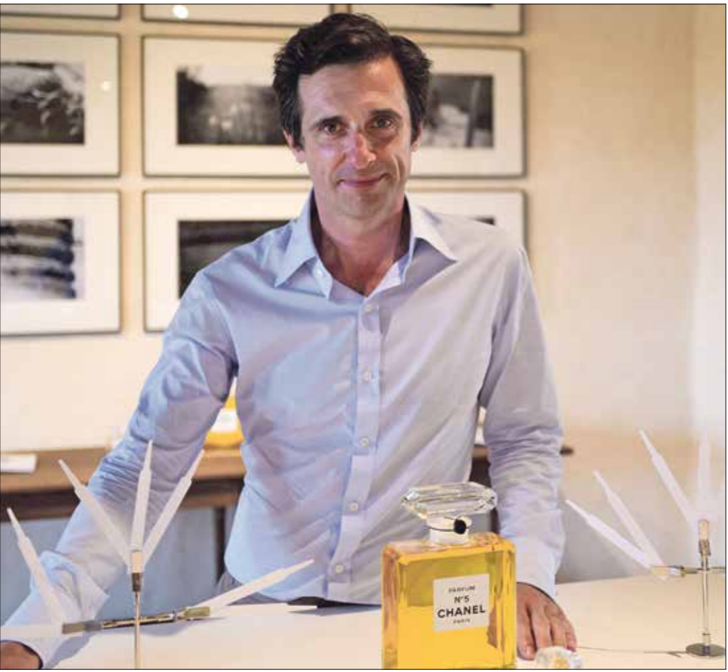
الخطيب يحب حفظ جاف، إذ لتسبب الرطوبة بضرر فيه (جتي)