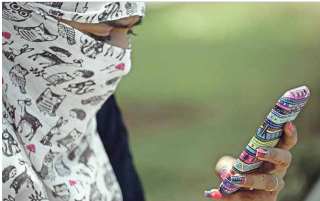
ليست المرة الأولى التي تُعرض فيها نساء هنديات للبيع على مواقع التواصل

وأزالته مئات الحسابات من تطبيق «إنستغرام». ومع ذلك، وفي الوقت الذي نُشرت فيه القصة، وجدت «بي بي سي» أنه لا يزال يبيع النساء يُعلن على المنصة. وكتبت شركة «فيسبوك»، في ردّها في يونيو/حزيران 2020، أنه «بعد التحقيق الذي أجرته (بي بي سي)، أجرينا مراجعة لمنصتنا، وأزلنا 700 حساب على «إنستغرام» في غضون 24 ساعة، وفي الوقت نفسه حظرننا وسوما عدة مخالفة».