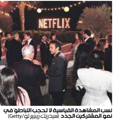
نبت المشاهدة القياسية لا تحب الباطون فيه نمو المشتركين الجدد (بيزنك/بيزنك/بيزنك/بيزنك)

يزال يلقي بقلقه على الاقتصاد وصعوبات الاقتصاد الكلي في أجزاء مختلفة من العالم بما في ذلك أميركا اللاتينية». وعلق المطل المستقل ويبس: «ولم يدره: المشكلة ليست في نتفليكس، وإنما بواجهتهم منافسة محتدمة متزايدة. وبالتالي يصعب من الصعب عليهم التعمير وكذب الجماهير». في الفترة من أكتوبر/تشرين الأول إلى ديسمبر/كانون الأول، حققت المجموعة إيرادات بلغت 7.7 مليارات دولار، وصافي أرباح 607 ملايين دولار. كما إيجاباً على «نتفليكس» عام 2020 وأوائل 2021 وأضافت: «نتعتقد أن هذا يرجع إلى عوامل مختلفة، بما فيها قويد الذي لا