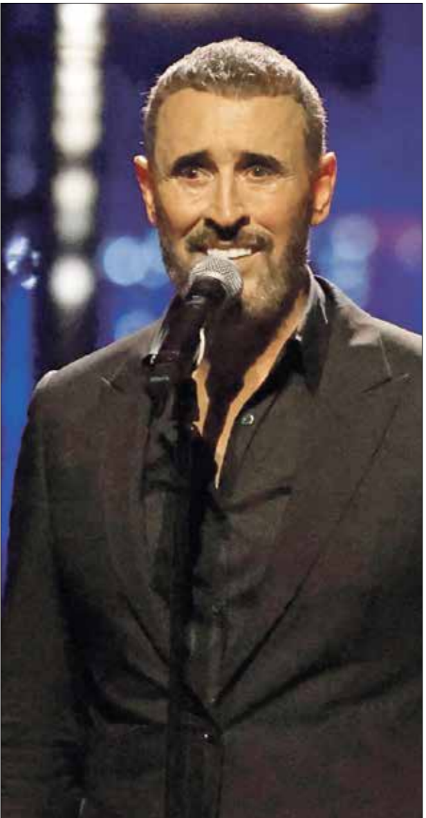
تعاون مخرجون أردنيون مع ماجد المهندس