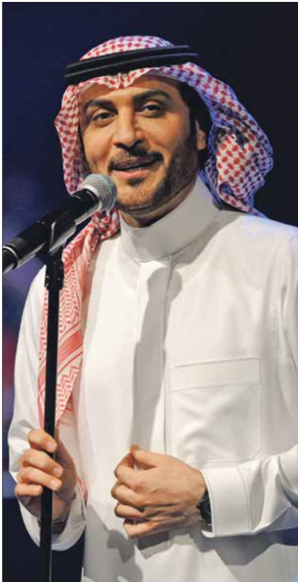
الساهر قد يكون الأكثر شعبيةً ردياً وعربياً