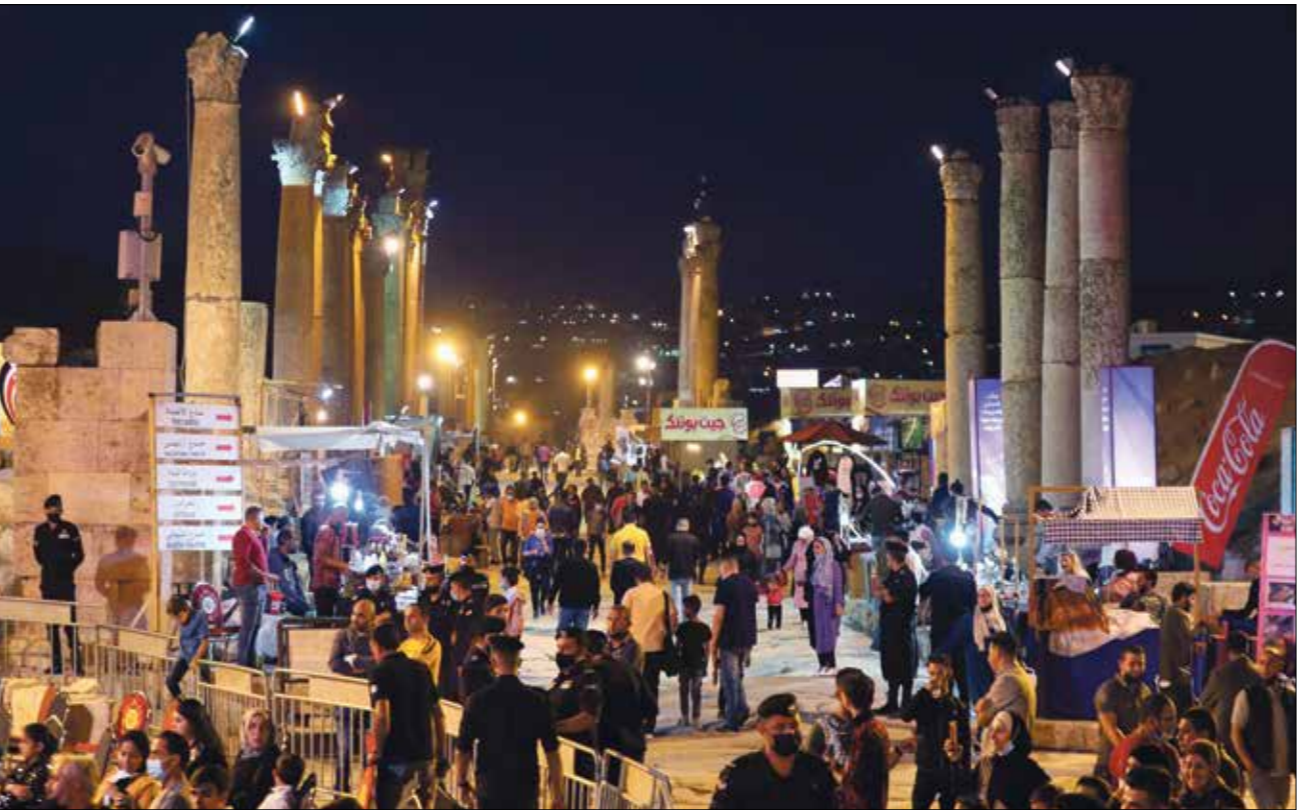
ساهر صهرجات حزين في شهرة الفنان العراقي