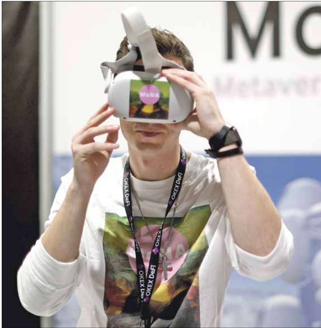
تعمل الشركات على تطوير خوذة خاصة بالواقع المعزز

يعود الفضل بشعبية خوذة الواقع الافتراضي إلى «غوغل» التي كشفت عام 2013 عن نظارات «غوغل غلاس». لم تلق