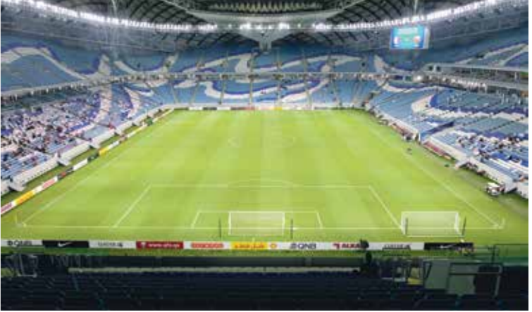
استاد الجنوب في مدينة الوكرة

الشعر، الخيمة التي سكنها أهل البادية في قطر ومنطقة الخليج على مر التاريخ، وبعد انتهاء البطولة، سيتم فك مقاعد الجزء العلوي من المدرجات، وستكون قابلة للتقل. واستوحى استاد النمامة تصميمه من شكل «القحفية»، وهو الاسم الذي تعرف به القبة التقليدية التي يرنديها الرجال في جميع أنحاء الوطن العربي وتبلغ سعته 40 ألف مشجع وسيستضيف مباريات كأس العالم 60ل في مجمعها حتى الدور ربع النهائي وبعد الموندياك، سيتم تخفيض طاقة الاستاد الاستيعابية حيث سيتم التبرع بـ20 ألف مقعد لتطوير مشاريع رياضية في أرجاء مختلفة