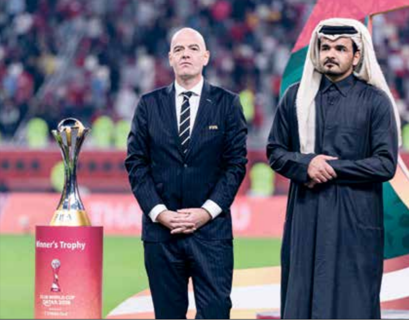
إنفانتينو يرفع موندياك أسبانيا في قطر

لأنهم أبدوا انفتاحاً تجاه هذه الفكرة، هذا هو الموقف القطري الذي أعجبني، إنه موقف بناء، إذ حصل وفعلاً العدد سيكون أمراً رائعاً، وإن لم يحصل فحنن راضون عن القرار النهائي»، قبل أن يتم الإعلان عن إقامة البطولة بمشاركة 32 منتخباً كما كان مقرراً، والخلفي عن اقتراح زيادة عددها إلى 48. وبعددها، رد رئيس الاتحاد الدولي لكرة القدم، على سؤال طرحه أحد الصحفيين حول الإشاعات التي حاولت النيل من نزاهة ملف استضافة قطر لمونديال 2022، قائلاً: «تحدث بعضهم لبعض سنوات عن هذه الإشاعات، لكن في هذه المرحلة لا نتحدث عن هذه الإشاعات، نحن وصلنا إلى وثاسة فيها، بنيت أحكامي حول قرارات اللجنة الأخلاقية. إذا أراد بعض الأشخاص الاستمرار على هذا المسوار، ويت إشاعات تستهدف دولة قطر، فهذا شأنهم، نحن نشترك كل الأمور بشفافية»، وفي فبراير/شباط من عام 2018، أشاد رئيس الاتحاد الدولي، بتحضرات دولة قطر الكبيرة لكاس العالم 2022، وقال إنفانتينو خلال وجوده في نوآكشوفي عاصمة موريتانيا خلال مؤتمر صحفي لوسائل الإعلام: «نحن سعداء بتقدم العمل والتحضرات لكاس العالم 2022 في قطر. نحن راضون جداً بما أنجز. أنا متأكد من أننا سنشهد نسخة رائعة»، مؤكداً بعدها بأشهر قدرة قطر على تنظيم موندياك بشكل مهير.