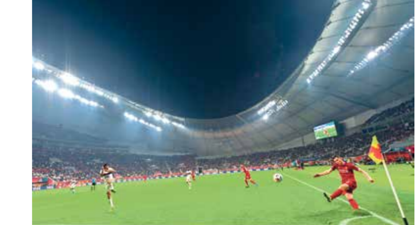
استاد خليفة استضاف نهائي مونديال اأندية