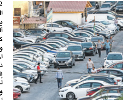
معرض سيارات في عمان، 23 سبتمبر 2023

المناطق الحرة الأردنية جها، أبو ناصر قال في تصريحات صحافية إن النظام الجديد للضريبة على السيارات سيخفف السوق حيث يتخظر المستهلكون إما تراجعها حكوميا عن القرار أو التكيف مع الواقع الجديد.