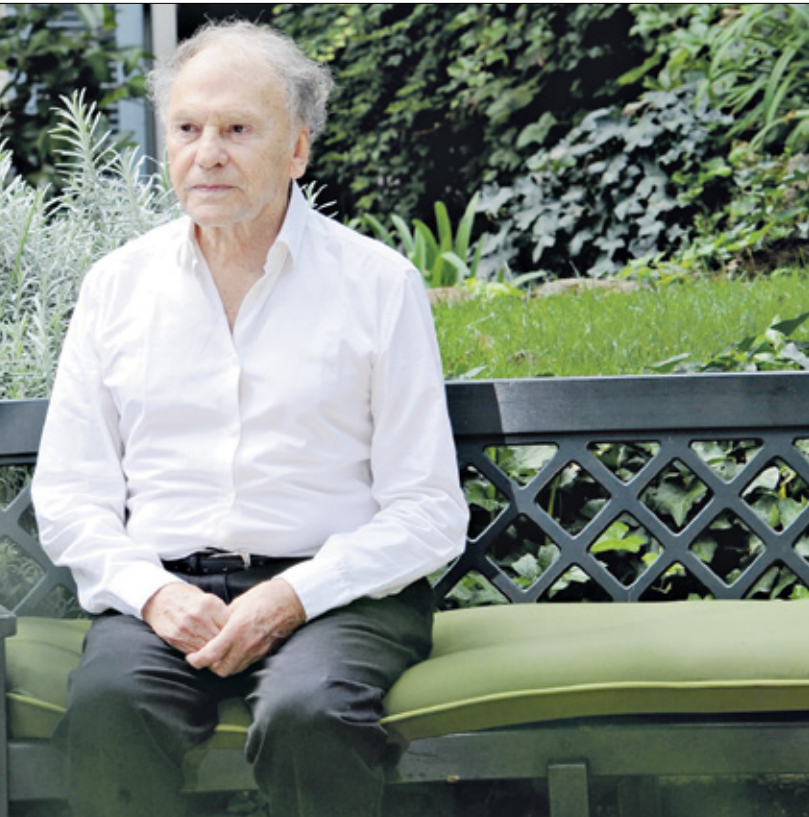
جان ـ لوي ترانتينيان في «حبّ»: أي نظرة؟ أي انظار؟

مولود في باريس (1968)، درس نادر تكميل همايون الآداب في بلده إيران، التي وصل إليها للمرّة الأولى قبل 6 أشهر من الثورة الإسلامية (1979)، وأقام فيها 4 أعوام. عام 1993، نجح في امتحان الدخول إلى «فيميس»، فقرّر البقاء في فرنسا، وتأك دبلوم الإخراج عام 1997. له أفلام روائية وثائقية عدة، منها: «قريباً» (2000) و«الأقدام في السجادة» (2015) و«عراس ذهبية» (2019).