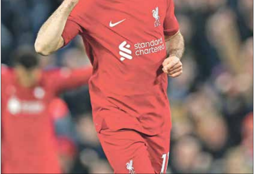
لاتف محمد صلاح في السنوات الأخيرة مع ليفربول

الكويت وأوزبكستان عندما يستضيف الكويت نادي ناساف في المجموعة الرابعة. وبدأ الكويت محاولة للفوز بلقبه المحلي الضميرين باربعة انتصارات، بينما يبدو ناساف في طريقه لإنهاء هيمنة باختاكور موافقة من هيئة الرياضة بشأن إقامة مباراته الافتتاحية في دوري أبطال آسيا 2 أمام ناساف الأوزبكي على استاد جابر الدولي. وكان الاتحاد الآسيوي لكرة القدم قد رفض نقل المباراة للمعب نادي الكويت