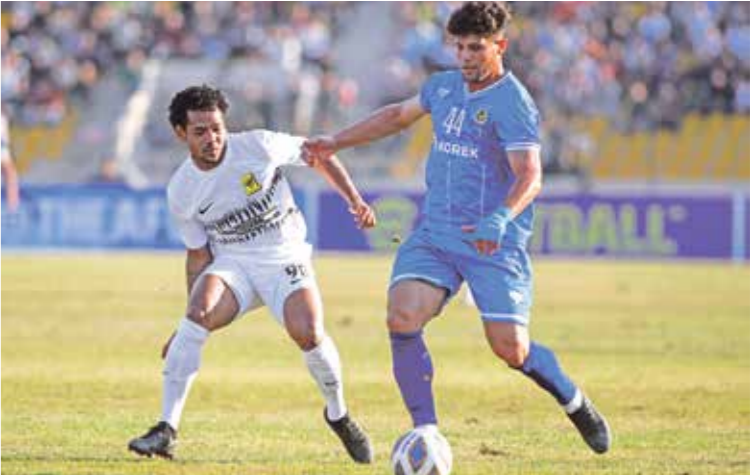
الجوية يضم في صفوفه العديد من النجوم السابق حفيد