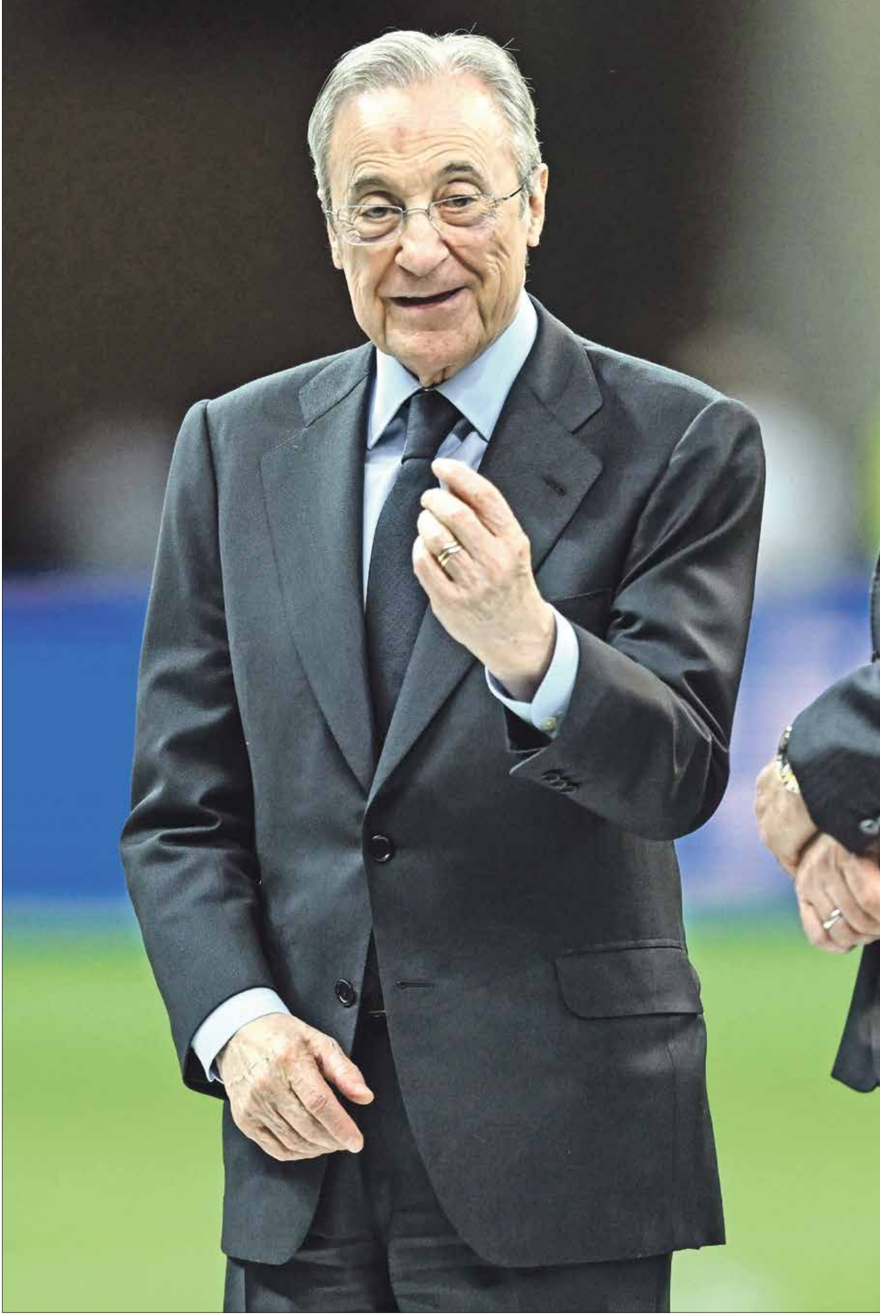
فلورنتينو بيريز رئيس ريال مدريد في وارسو، 14 أغسطس 2024

يواجه نادي ريال مدريد مهمة استغلال المال العام، وفقاً لتصريحات أدلى بها القاضي في المحكمة العليا لمدرّب، خوسيه أنطونيو مارتين بالين (88 عاماً)، كما تهدده عقوبة الاتحاد الأوروبي لكرة القدم «يويفا»، التي تبقى غير مستبعدة، نظراً للتجاوزات المالية. وقال في تصريحات لقناة تي في إي المحلية: «ريال مدريد يستغل المال العام، وكذلك مواقف السيارات، وأنشطة لا تتعلق بكرة القدم أو الرياضة».