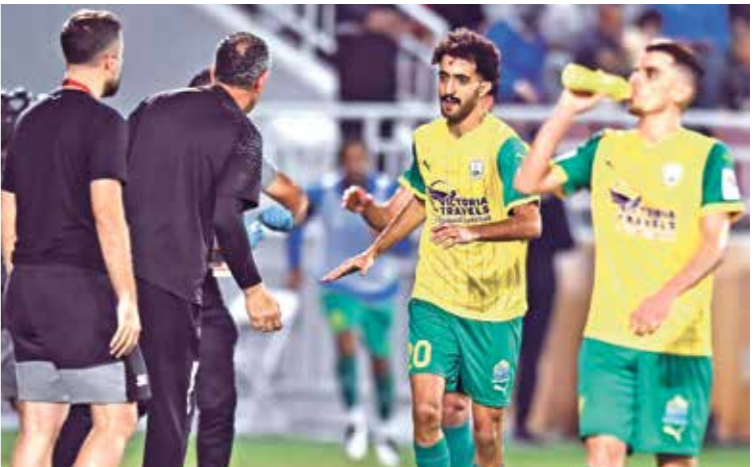
الوكرة يصطحب الحائسة على اللقب السابق حفيد

في تاريخ البطولة. ويتأهل الفريقان الحاصلان على المركزين الأول والثاني من كل مجموعة إلى دور الـ16، الذي يُقام في شهر فبراير/ شباط من عام 2025. وينتج ذلك ربع النهائي في شهر مارس/ آذار 2025، وقبل النهائي في إبريل/ نيسان 2025، على أن تُقام المباراة النهائية من