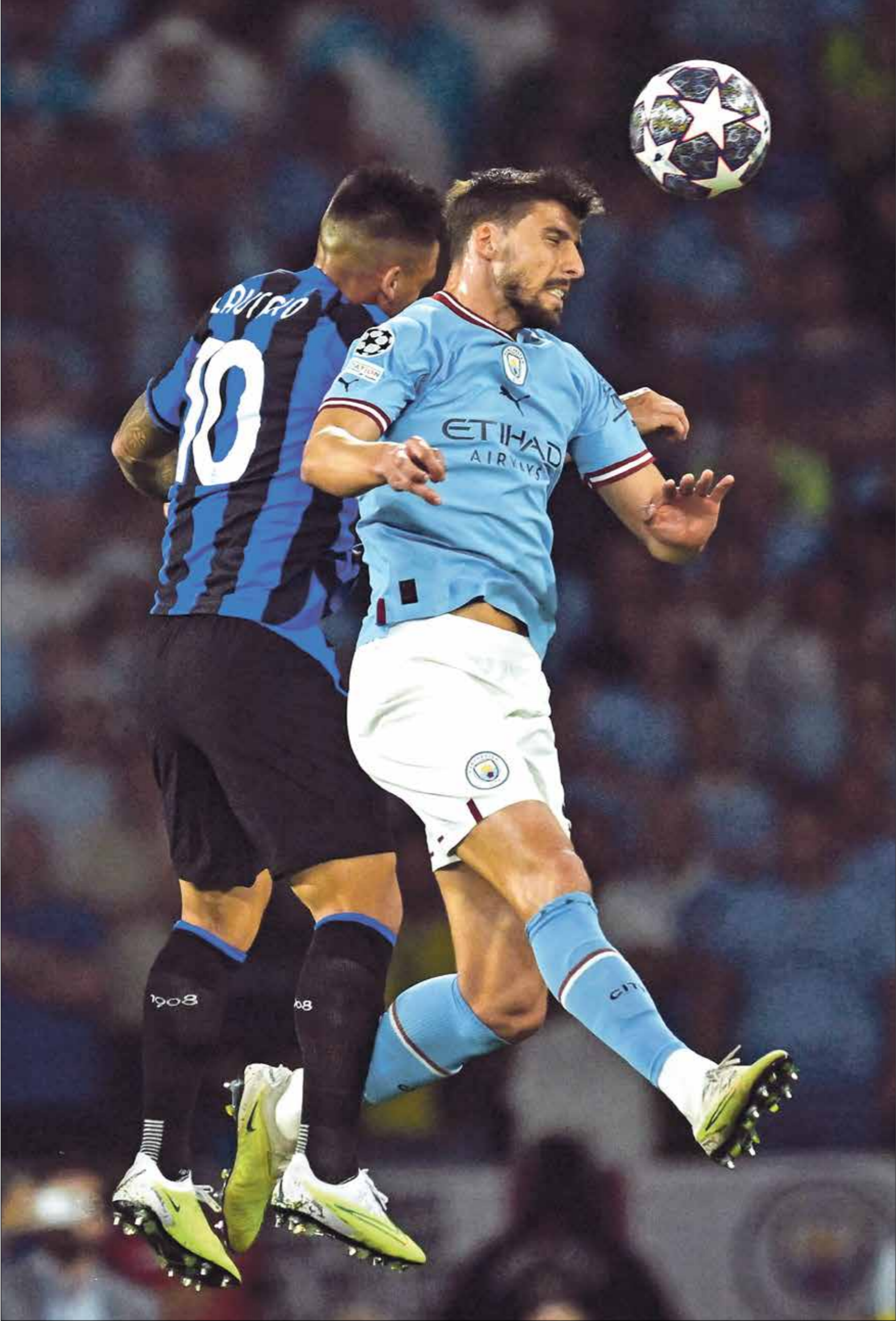
مانشستر سيتي فاز فيه آخر لقاء على الإنتر (ريدز)

ويظهر باريس سان جيرمان مرشحا بقوة للانتصار على جيرونا الإسباني مستفيدا من دبايته القوية في الدوري المحلي حيث حصد العلامة الكاملة وحجومه ضرب بقوة هذا الموسم، إذ لم يظهر إلى حدّ الآن تأثير رحيل كيليان مبابي عن الفريق، ولكن الوضع قد يختلف بلا شك بما أن مواجهات دوري الأبطال تختلف كثيرا عن الدوري المحلي، فرغم أن جيرونا خسر آخر مباريات الدوري الإسباني بنتيجة (1-4) أمام برشلونة، إلا أن الفريق يريد التالف في أول مباراة في دوري الأبطال، وهو قادر على أن يكون عقبة قوية أمام الفريق الفرنسي في حال نجح في تطبيق خطة تحدي هجوم نادي العاصمة الفرنسية، ويترك المدرب لويس إنريكي أن انتخارات الجماهير في باريس كبيرة في الموسم الجديد، خاصة بعد الوصول إلى نصف نهائي نسخة العام الماضي، ولهذا فإنه سيحاول القيام بتعديلات على الدفاع، بما أن فريقه يقبل أهدافاً في مباريات الدوري، وفي حال كسب الخط الخلفي التحدي، فلن يكون من الصعب على فريقه حصد أول انتصار خاصة بعد تالف المهاجم عثمان ديمبيلي.