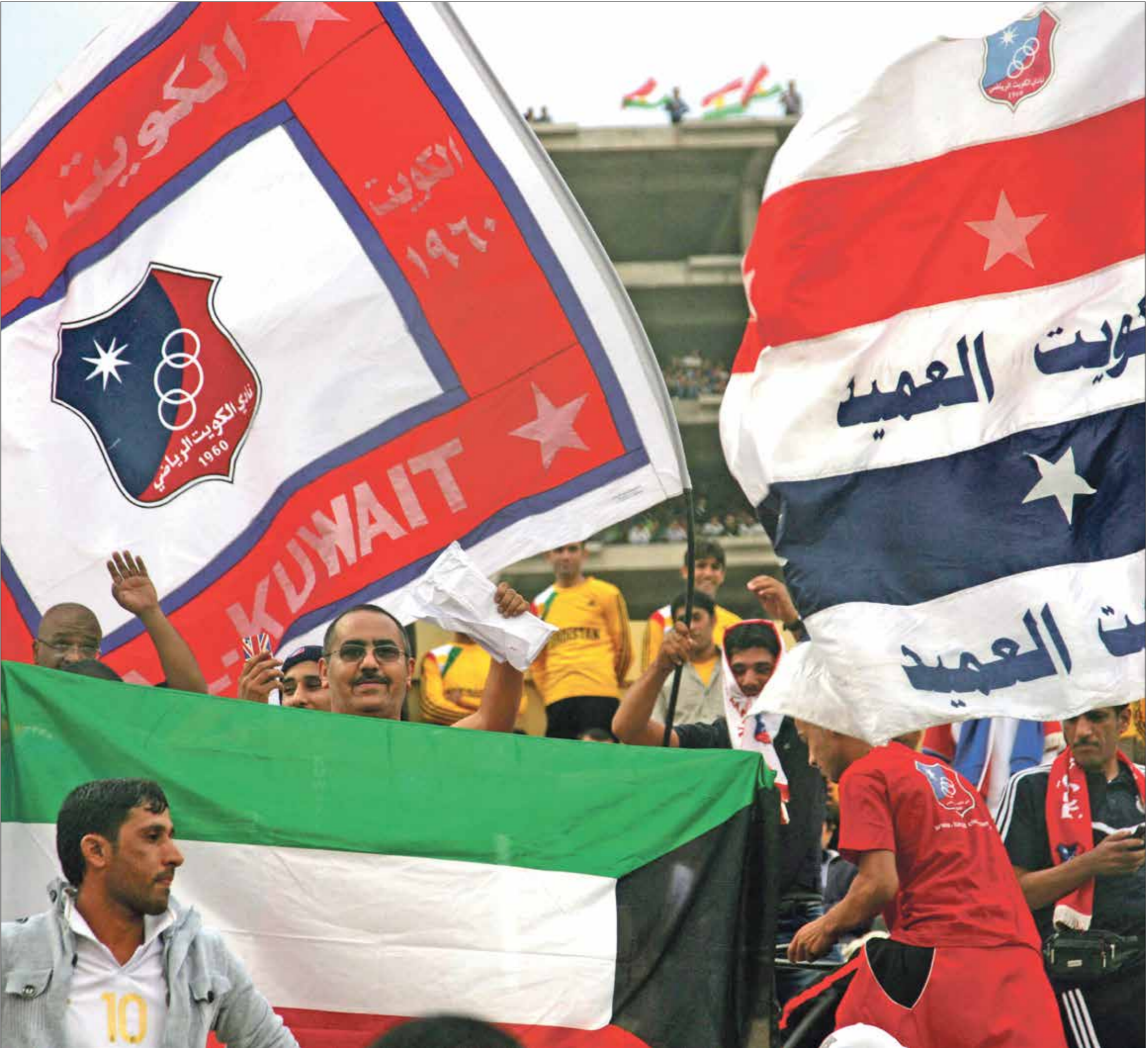
نادي الكويت كان فرياً من الأسحاح من البطولة

الأثنا، يسعى شباب الأهلي دبي الإماراتي إلى تعويض خيبة الأمل التي تعرض لها، من المسؤولين عن استاد جابر، من أجل تجهيزه لاحتضان المباراة في موعدها، حتى لا يجبر الفريق على الانسحاب من البطولة، حيث يبدأ مشواره ضد الحسين إربد الأردن، الذي بلغ البطولة، بعد فوزه بلفق الدوري الأردني للتحرقين لأول مرة في الموسم الماضي. وفي غرب القارة، ولحساب المجموعة السابعة، يعتمد بانكوك يونايتد على في ميزة اللعب على أرضه من أجل تحقيق الفوز على تامبينز روفرز السنغافوري. وتعادل فريق