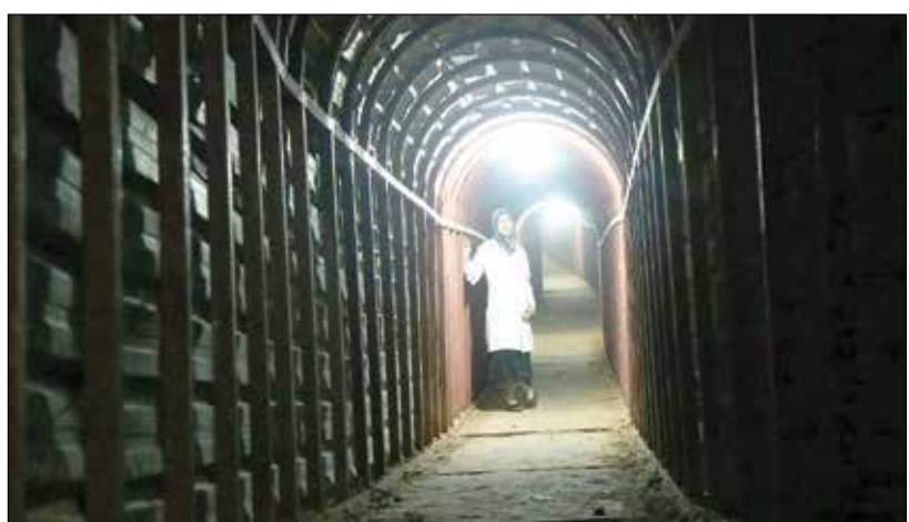
«الكهف» لفراس فياض: لهاتُ وراء تقديم الواقع (العربي الجديد)

3 قصص تُروى في سياق منبثق من «ثورة 25 يناير» (2011) المصرية. بعضها يستعيد تفاصيل سابقة عليها بأعوار عدّة. 3 قصص ترويها 3 شخصيات: مهندس ناشطٌ من أجل فلسطين ومصر، يتعرّض لأبشع أنواع التعذيب على يد ضابط، يروي بدوره حكايته مع الثورة ومع ما سبقها من نشاطات وأعمال نضالية. هناك أيضاً مذيعة تلفزيونية تستفيق على الراهن، بسبب تضايف ضغوط في العمل، وحرّك في الشارع. يصف البعض «الشتا اللي فات»، بأنّه أحد أبرز أفلام الثورة المنجزة في بداياتها، والتمكّنة من التقاط مفاصل مختلفة منها. أخرجه إبراهيم البيطوط عام 2013، ومثّل فيه عمرو واكد وفرح يوسف وعمر مصطفى.