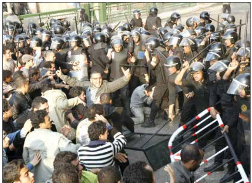
تظاهرات القاهرة (25 يناير 2011)، حراك شعبي اعظم من سينما