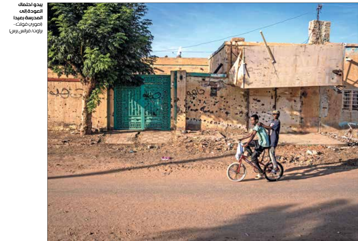
يدعو أحلام العودة إلى المدرسة بعدا (فلسطين برس)