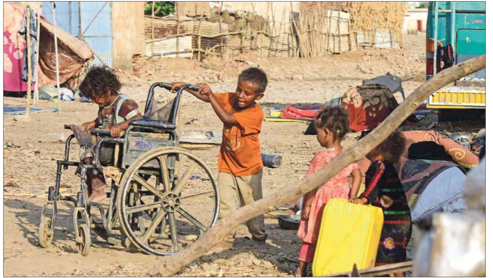
طفولة مجهورة