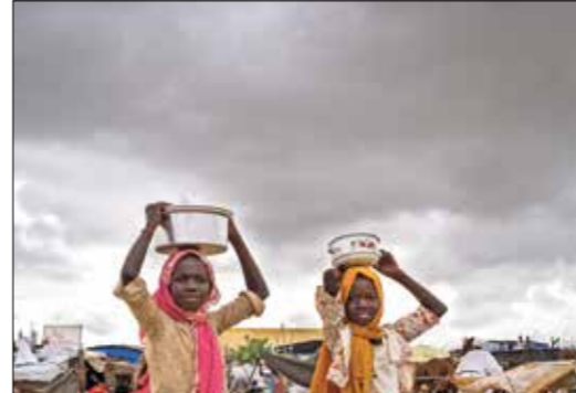
لتحفات الطعام الثلاثة في مخيم الجوز