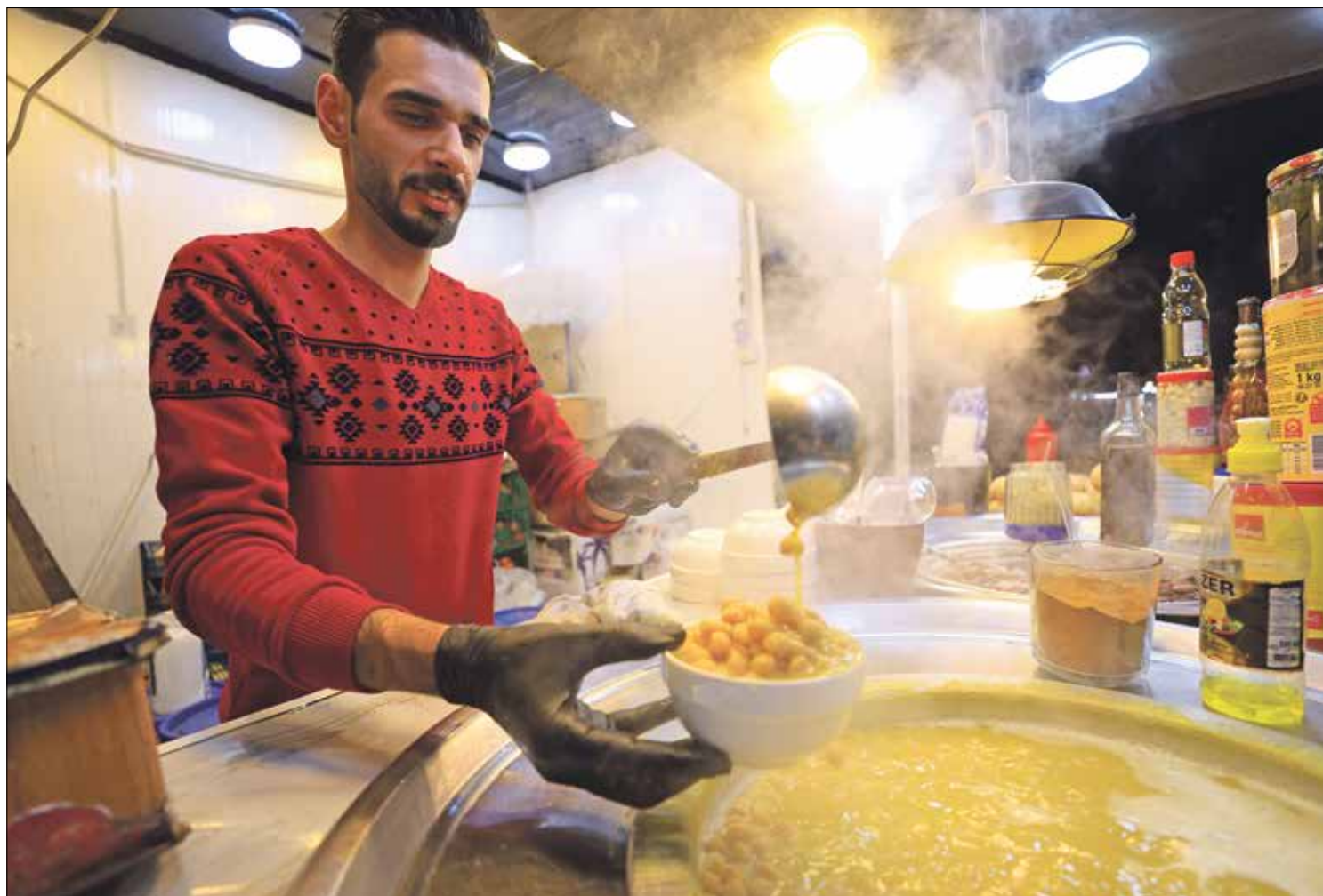
الحمص المسلوق، أكلة يعشقها العراقيون