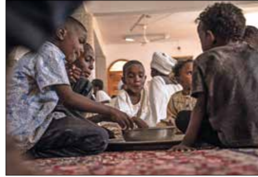
بناك بكيعهم الطعام (فلسطين برس)