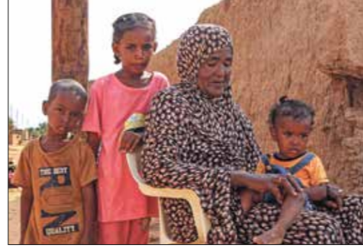
أطفال أو اسطرار