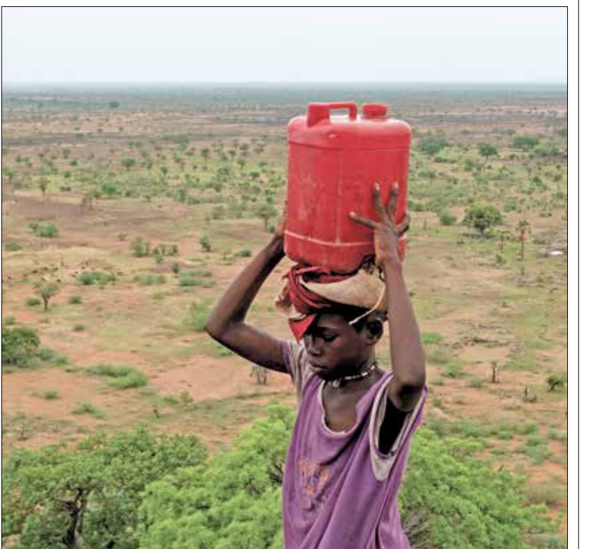
عمن شيف، نظمه