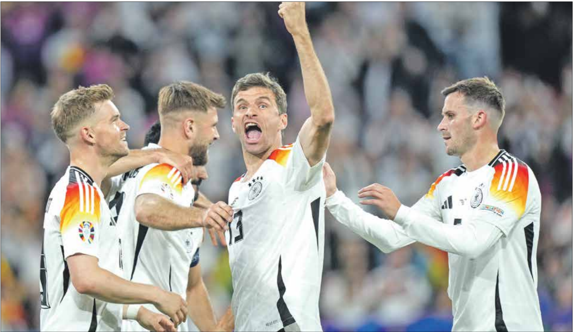
احتفل نجوم ألمانيا بعد فوزه الكبير على اسكتلندا

خطورة منتخب صربيا من الممكن أن يظهر ضد منتخب إنكلترا في اللقاء، بفضل الأهداف بالكرات الرأسية، التي وصلت إليها في التصفيات المؤهلة إلى «يورو 2024»، وهي أعلى نسبة لمنتخب يشارك في البطولة بألمانيا. وفي المجموعة نفسها، يلعب منتخب سلوفينيا ضد نظيره منتخب الدنمارك في تمام الساعة السابعة مساء بتوقيت القدس المحتلة، ولم يتمكن منتخب سلوفينيا من تحقيق الانتصار على منتخب الدنمارك في المواجهات الست السابقة في جميع البطولات، بعدما تذوق الخسارة في خمس مناسبات وتعادل