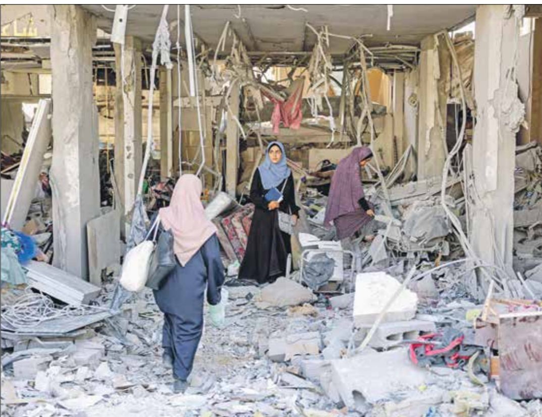
بوميات وسط الدمار والركام