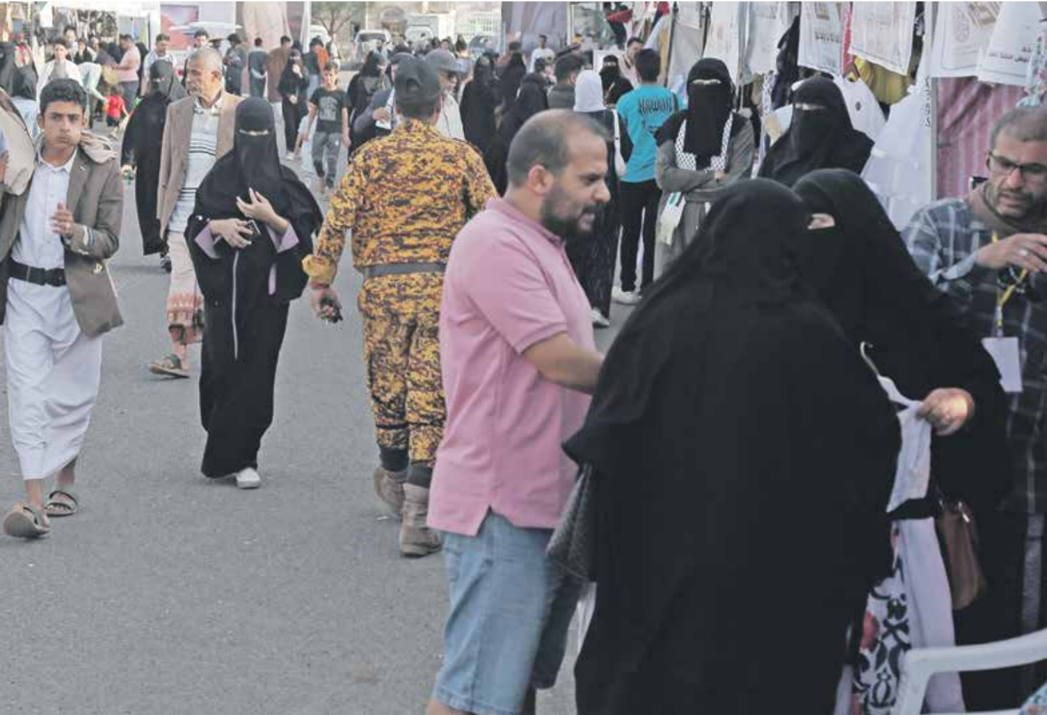
يمشون للاضحة بعيد الأضحى في صنعاء، 8 يونيو 2024

توازياً مع انعدام الأمن وبعد سنوات من الصراع المرير، كان لافتاً، الخميس، تحطّي سعر الدولار عنبة 1800 ريال للمرة الأولى في تاريخ الخمس، وسط موجة غير مسبوقة من الغلاء، وارتفاع أسعار السلع الغذائية، مما يندّر بكارثة اقتصادية وثورة جياح سبق وأن حذرت منها منظمة دولية ومحلية. وقد وصلت دفعة جديدة من منحة سعودية لدعم الموازنة العامة إلى البنك المركزي في عدن، ونقلت «رويترز» عن مصادر أن المملكة أودعت لديها نحو 300 مليون دولار، وذكرت ثلاثة مصادر في الحكومة المغرب بها دولياً أن السعودية أودعت مبلغ في