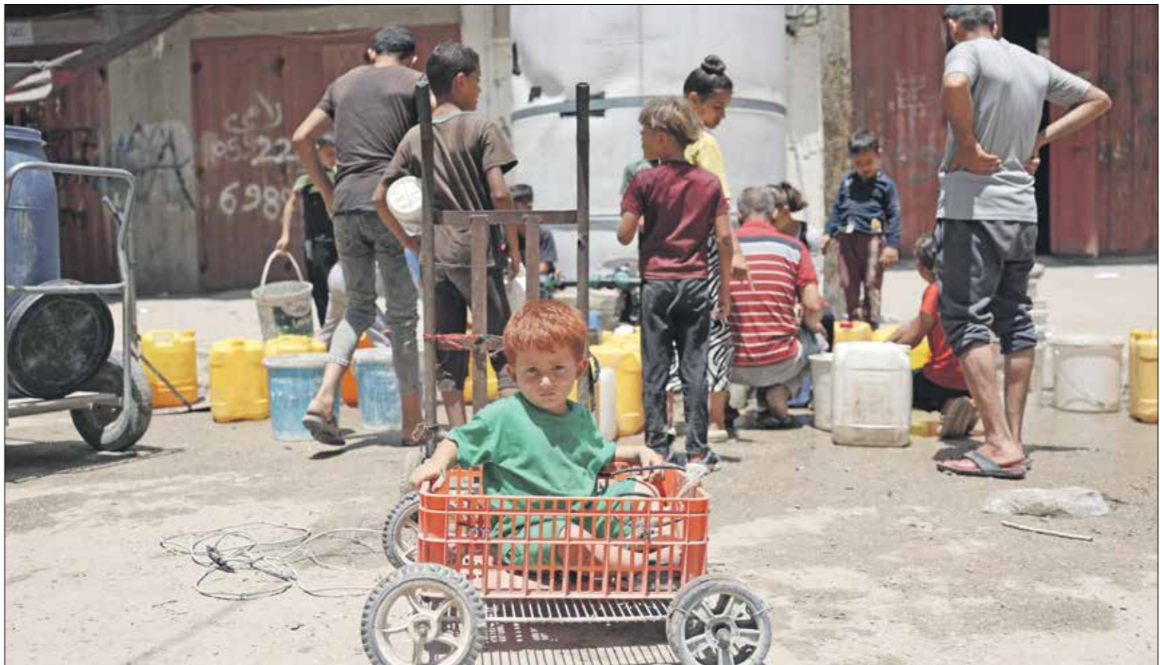
يلهو بحرية من بلاستيك وسط الحرب المستمرة