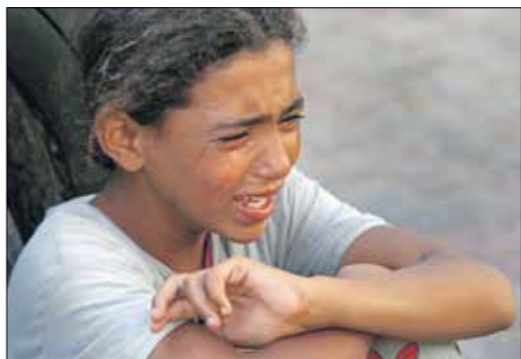
الفرح حفا وليس الشهر (الرف، ابو عمرو، الناضون)