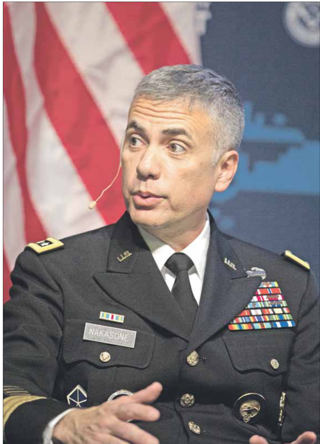
يأتي تعيين ناكاسوني في حيز لتناول، «وبت إيه آي»، الحد من الانتقادات التي لاقهاها

لمنع حكومة أجنبية من السيطرة على تكنولوجياها عن طريق القرصنة. برنامج الدردشة الآلي الخاص بها. ووفقاً لصحيفة واشنطن بوست، فإن ناكاسوني يتضمّن إلى مجلس إدارة «اوبن إيه آي» بعد تغيير جذري فيه، فوسط بيئة تنظيمية أكثر صرامة وجهود متزايدة لترقمة الخدمات الحكومية والعسكرية، تبحث شركات التكنولوجيا بحثاً متزايداً عن أعضاء مجالس إدارة من ذوي الخبرة العسكرية. ويتضمّن مثلاً مجلس إدارة شركة