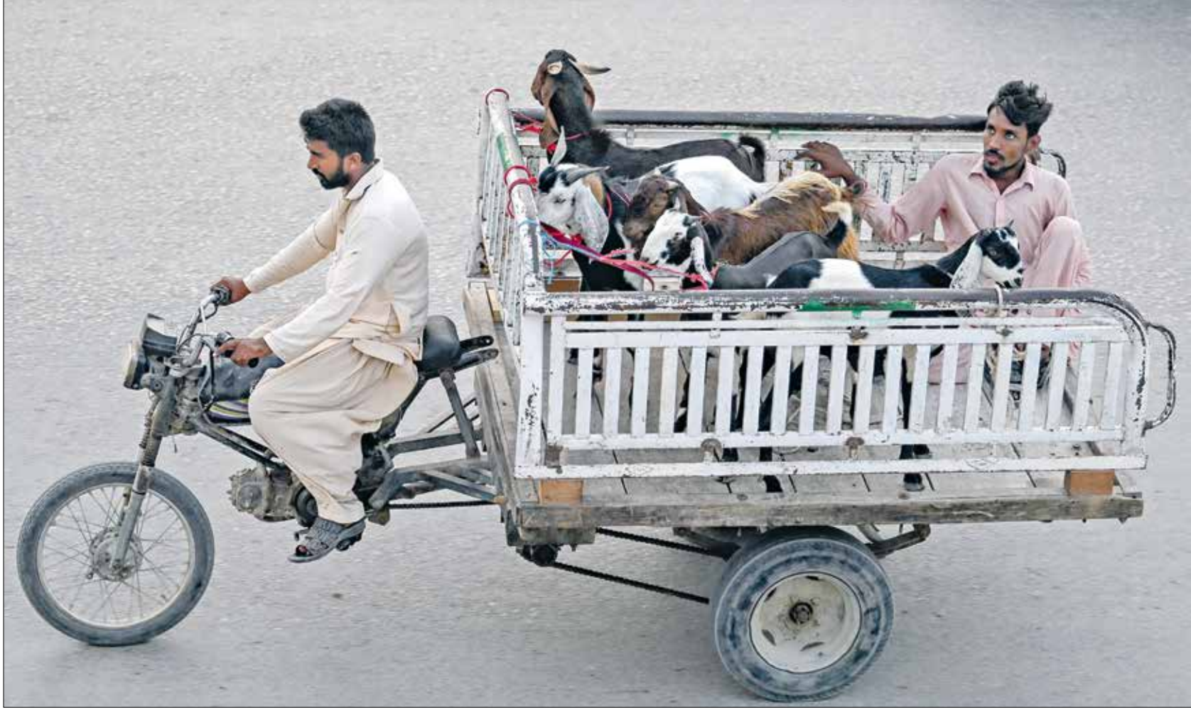
تختلف نسبة الدهون وتركيبها لها بين لحوم الضأن والبقر والماعز

يمكن أن تسبب الزيادة في استهلاك اللحوم الحمراء الغنية بالدهون خلال أيام عيد الأضحى مشاكل صحية كثيرة. هنا، نسلط الضوء على بعض النصائح للبقاء بصحة جيدة خلال هذا العيد