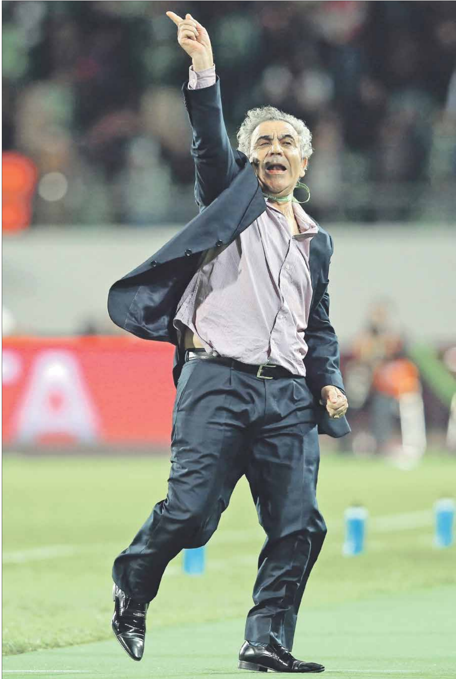
سيفيد البنزرتي منتخب تونس للمرة الرابعة في تاريخه (اليس ليفتاز) (Getty)