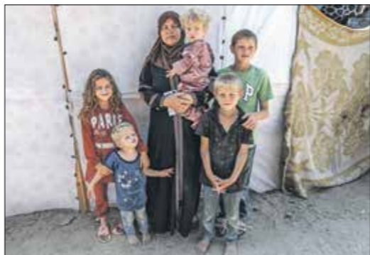
الاحتفال بهجرهم مرارا بعد الرحيم الخطيب، (الناضون)