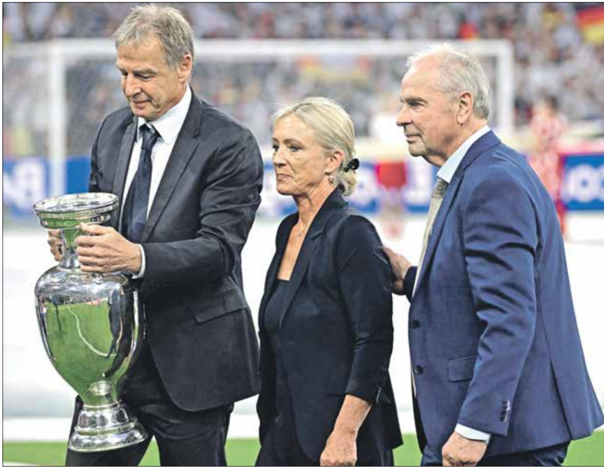
حضرت زوجة الراحل، بكبار ليلة تكريمه باليور