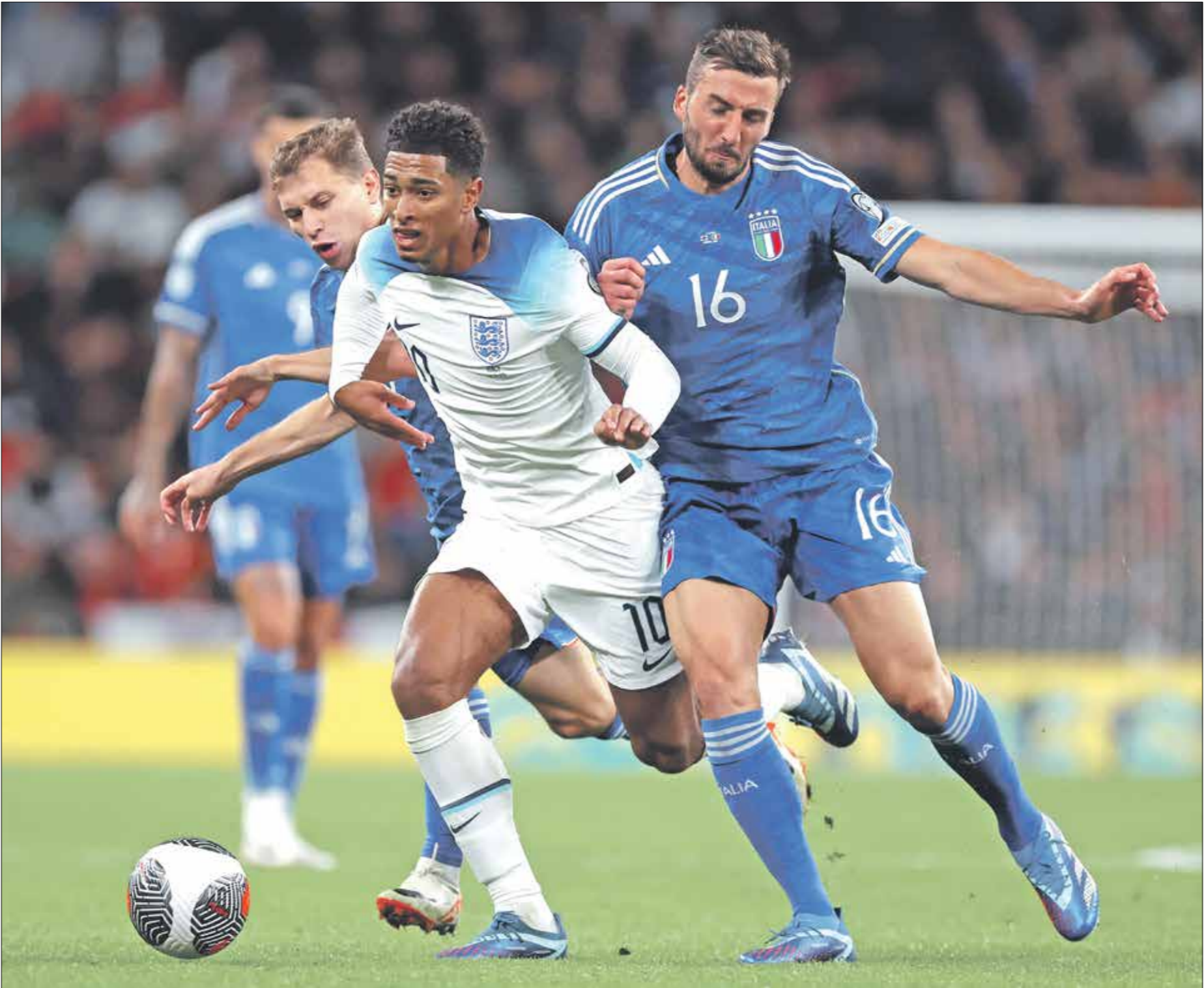
لترقب الجماهير رؤية بلينجهام نجم منتخب إنكلترا

وكان آخر ظهور لصربيا في نهائيات كأس أمم أوروبا في عام 2000 باسم جمهورية يوغسلافيا الاتحادية، حيث وصل إلى ربع النهائي قبل أن يخسر بسبعة أهداف مقابل هدف أمام هولندا، وتظل هذه هي المرة الوحيدة التي تستقبل فيها دولة ستة أهداف في مباراة بالمسابقة القارية، لكن