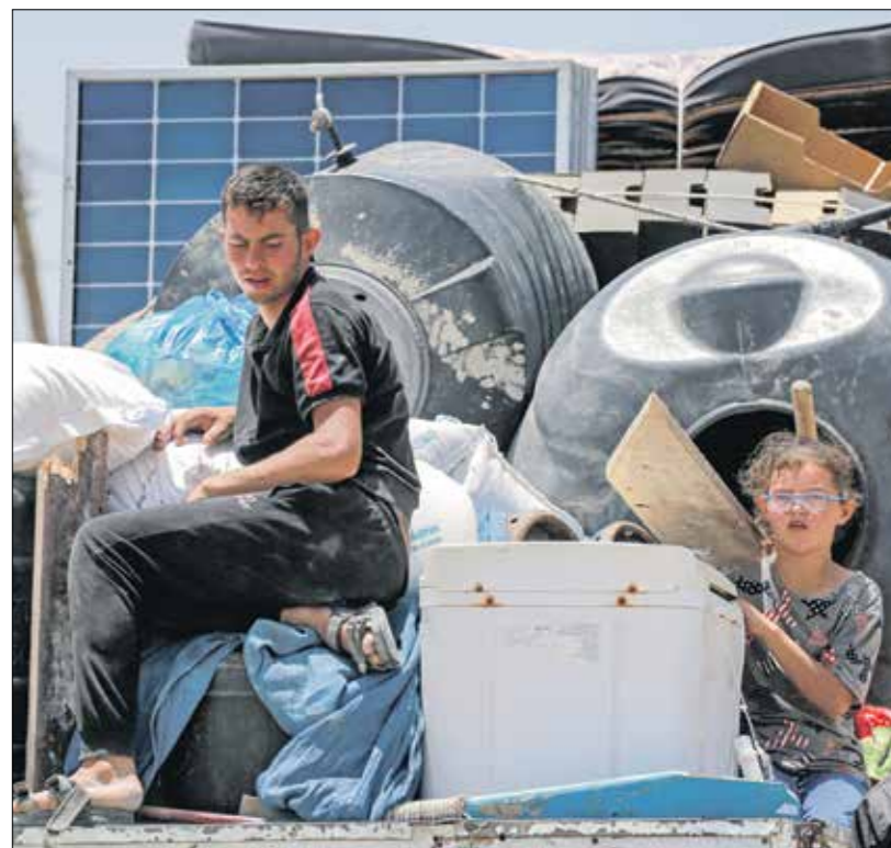
عيد وسط التهجير المستمر