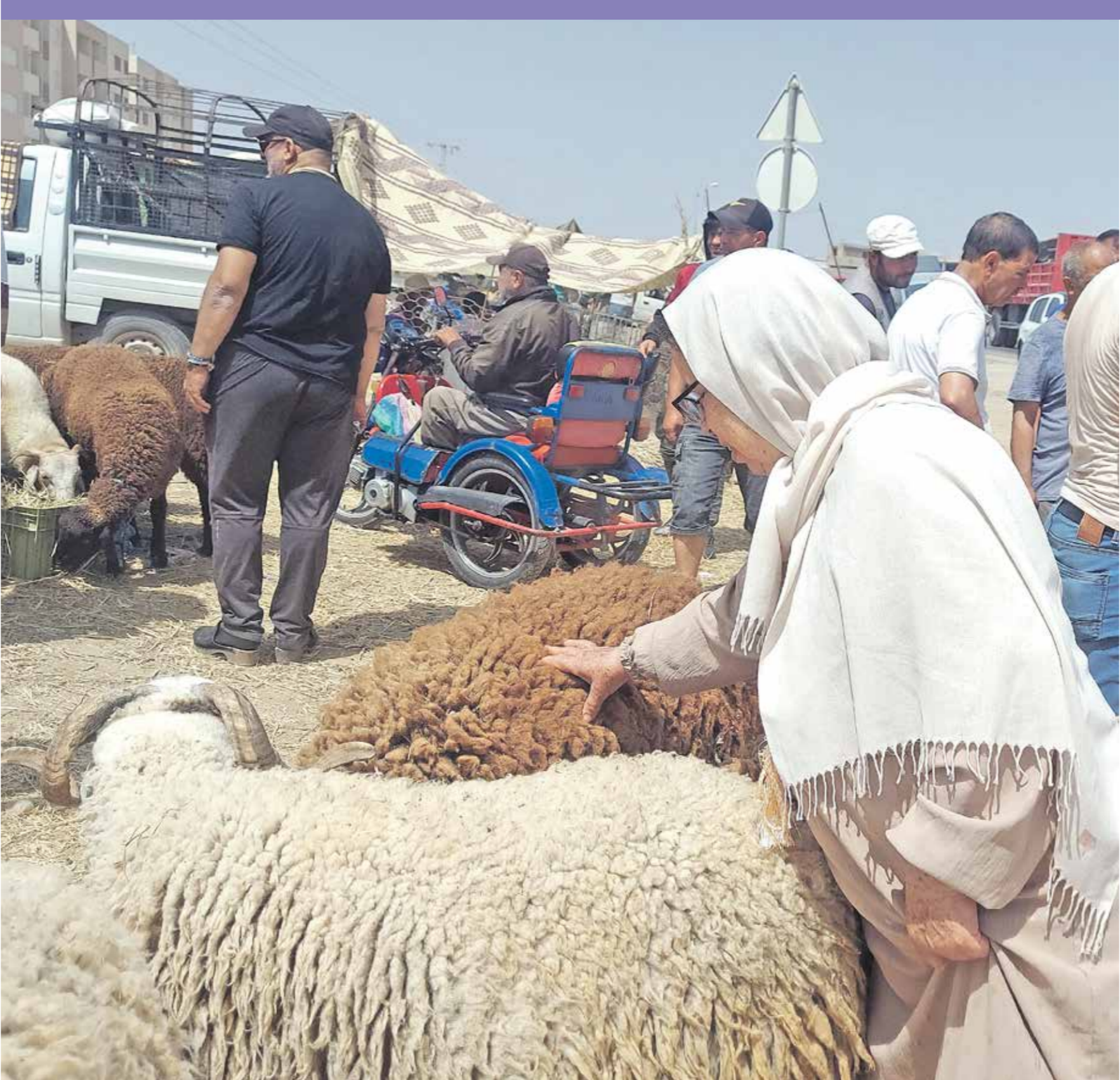
اختيار الأضاحي في أحد أسواق الطابية تونس، 15 يونيو 2024

سعر كيلو اللحم على 43 ديناراً نحو 14 دولاراً، وهو ما دفع العديد من التونسيين لاقتناء كميات من اللحوم لضغط على الكتلاليين، لأن ذلك أقل من شراء خروف، مؤكداً أن «سعر الكيلو يبقى عالياً ولا بد