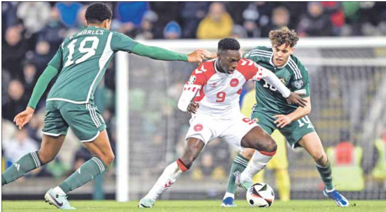
يملك منتخب المواجه عددا من النجوم الشباب