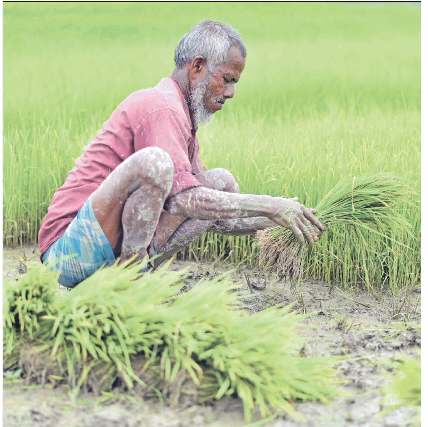
مزارع يجرس شتلات الارز في حقل بولاية آسام شمال شرق الهند، 2 يوليو 2023