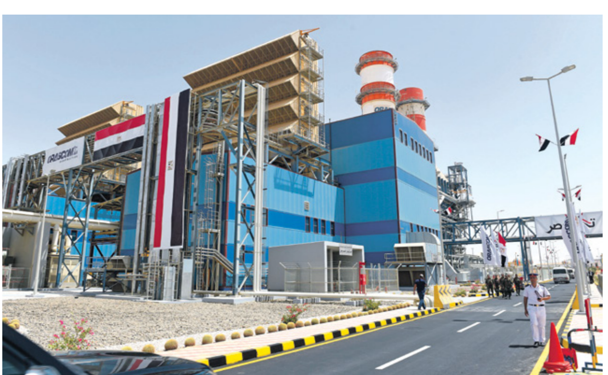
محطة كهرباء على مشارف القاهرة، 24 يوليو/حزيران 2018 (تجاه جنوبية/مرايس سنا)

تشهد شركات توزيع الكهرباء في مصر حالة من الارتباك، بعد تطبيق الزيادة الجديدة في أسعار بيع التيار الكهربائي للمستهلكين، إذ أوقفت الشركات شحن الكروت (البطاقات) مسبقة الدفع، عن طريق شركات الدفع الفوري، لتجبر المواطنين على التوجه إلى الإزارات التجارية في كل مكان، لجمع الأحياء والمدن واستبدال البطاقات التي بحوزتهم فوجي التحصيل، بإلغاء تكديسها أمام إدارات التحصيل، بإلغاء العمل ببطاقات الشحن الموردة بحوزتهم، لدفعهم إلى شراء بطاقة شحن جديدة،