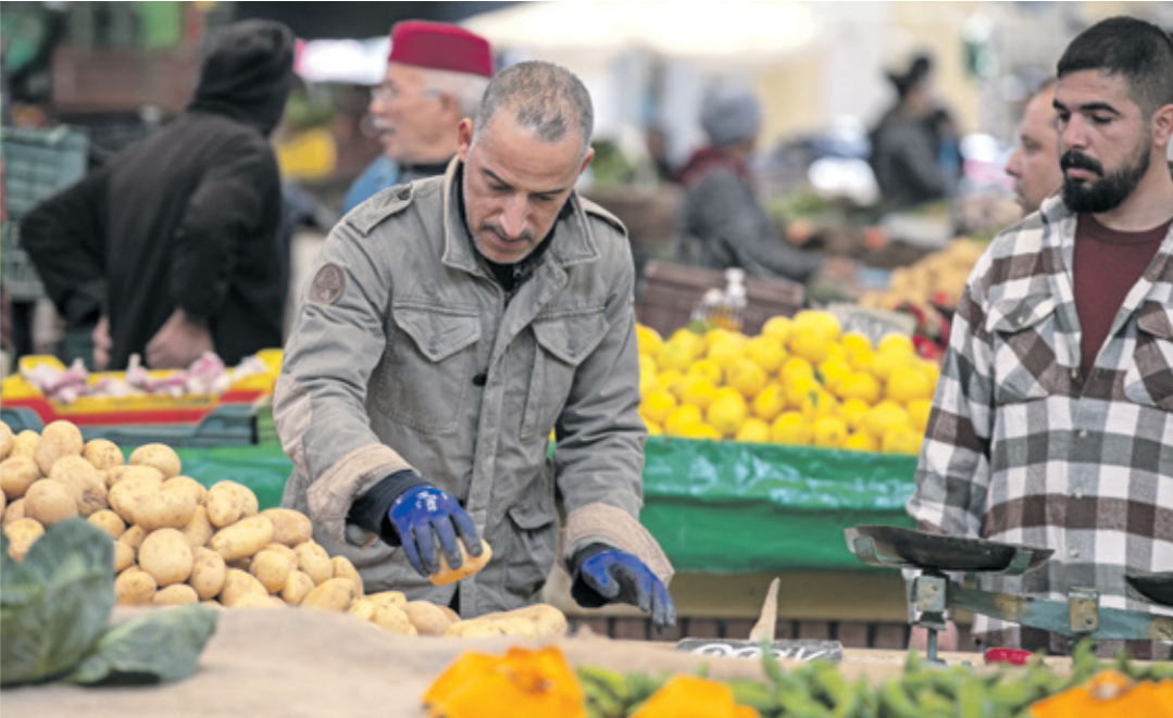
السوف المركزية في تونس العاصمة، 11 مارس/آذار 2024

تزيد الاندبايات وتوجيهها بحسب الأولويات القطاعية وعدم تعويض الشغورات والسعي إلى تغطية الاحتياجات المتكادمة بإعادة توظيف الموارد البشرية المتوفرة أو عن طريق الحراك الوظيفي. وتمثل كتلة رواتب القطاع الحكومي وفق بيانات رسمية 49,1% من مداخيل ميزانية الدولة، بعد أن تطور حجمها من 6,7 مليارات دينار (2,2 مليار دولار) إلى 2010 عام 23,7 مليار دينار (حوالي 7,8 مليارات دولار). عام 2024 ما يشكل 13,5% من الناتج المحلي الإجمالي. وتنتج تونس منذ نحو 6 سنوات سياسة تجميد التوظيف في القطاع الحكومي بهدف النزول بكتلة الأجور إلى 12% من الناتج المحلي الإجمالي. ويطلب صندوق النقد الدولي من سلطات تونس خفض كتلة الأجور إلى أقل من 12% من إجمالي الناتج المحلي الذي من المتوقع أن يبلغ 175 مليار دينار هذا العام، للحد من تأثرها على مصارف ميزانية الدولة، بعد أن صعد الإنفاق على الأجور إلى حدود 16% من إجمالي الناتج المحلي، لكن الخبير الاقتصادي وزير