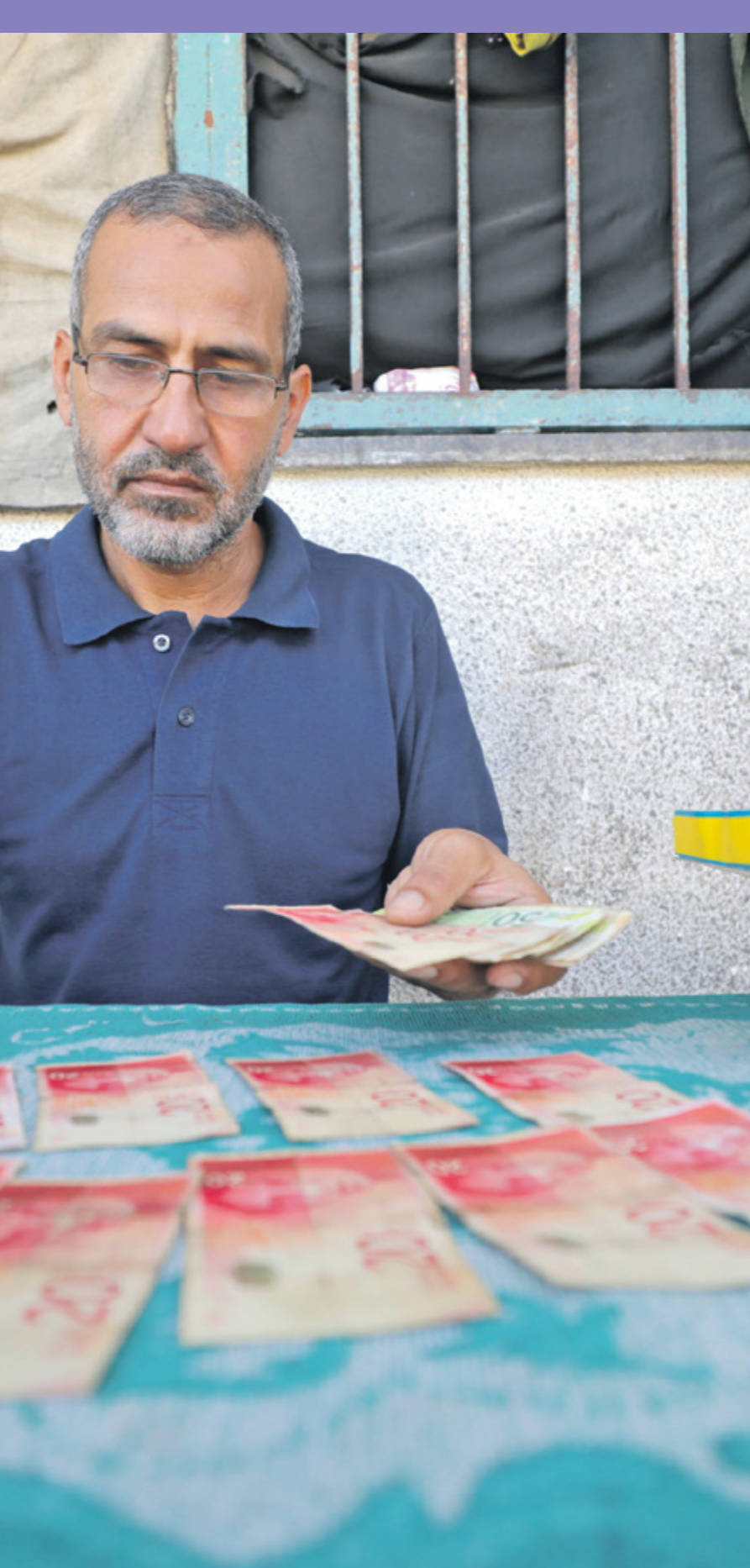
لمار يصلح أوراها نقديّة مكررة على تحصيل للساحد، دير البلح، 11 أغسطس 2024