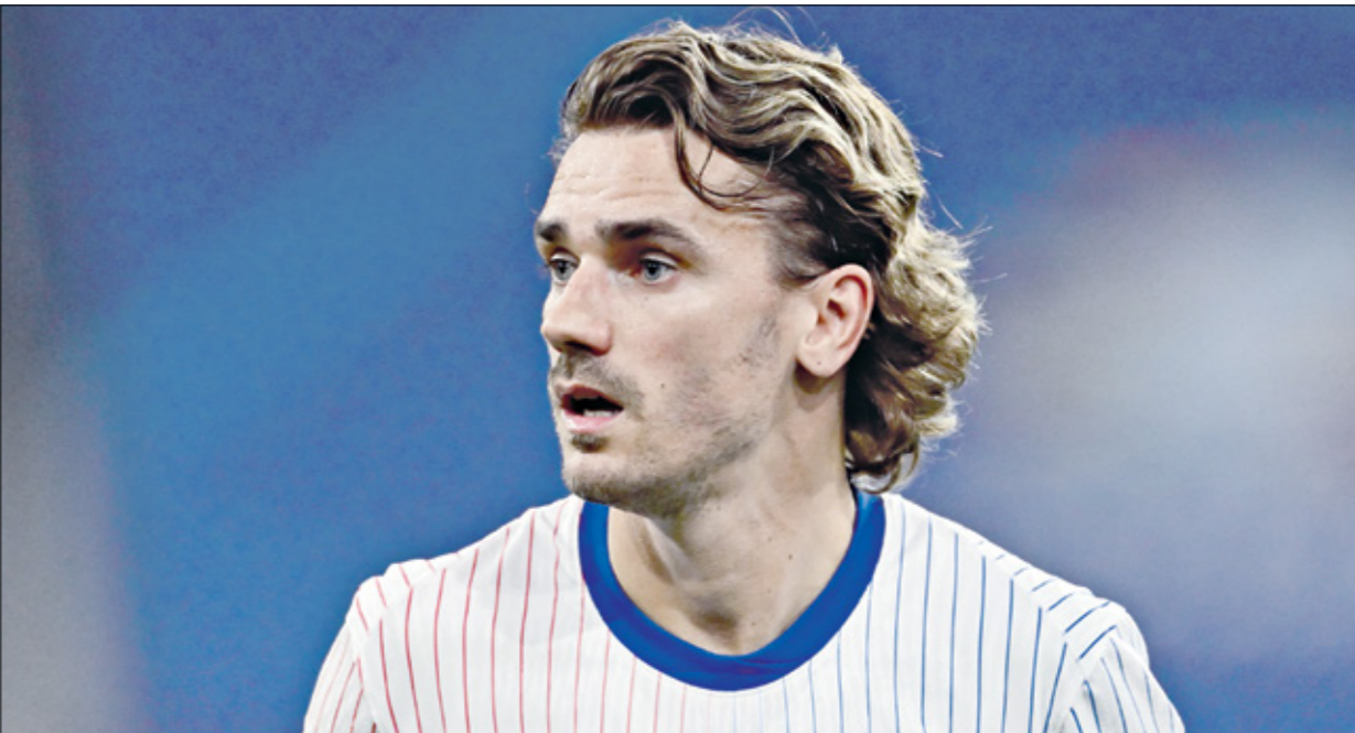
غريزمان في نصف نهائي يورو 2024 امام اسبانيا

تحسن النتائج بوصوله لنصف النهائي في نسخة 2024، إلا أن ذلك لم يكن كافياً، تزايدت انتقادات في فرنسا، التي حفلت الجماهير بمسؤولية الفشل إلى المدرب في المقام الأول، خاصة بعد أن رفع سقف التطلعات قبل التوجه إلى ألمانيا لخوض البطولة.