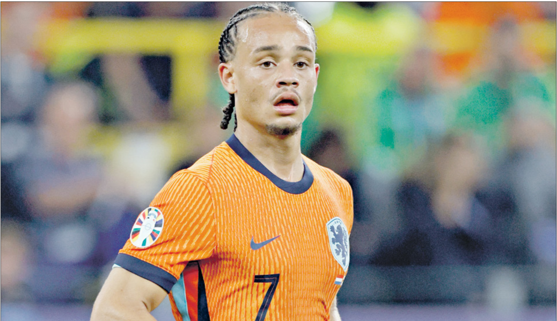
سوموزر احد أبرز مواهب منتخب هولندا

التحضيرات. ولم يكن ديشان في موقف ضعف مثل الذي يواجهه في الأيام الأخيرة، ذلك أن منتخب فرنسا قدم عرضاً دون المامول وبعيداً عن قدرات نجومه مع أنه يمتلك الكثير من الحلول في مختلف المراكز، غير أنه أصبح منتخفاً تسيطر عليه الخطط الدفاعية الصريحة، فحُسن أرقامه الدفاعية في بداية البطولة، بعد أن اهتزت شباكه في مناسفة واحدة أول خمس مباريات، غير أنه من الناحية الهجومية كان ضعيفاً للغاية ولم يقدم مستوى جيداً وسجل خلال ست مباريات أربعة أهداف فقط، منها هدف عكسي وهدف من ركلة جزاء، وهو ما حرمه