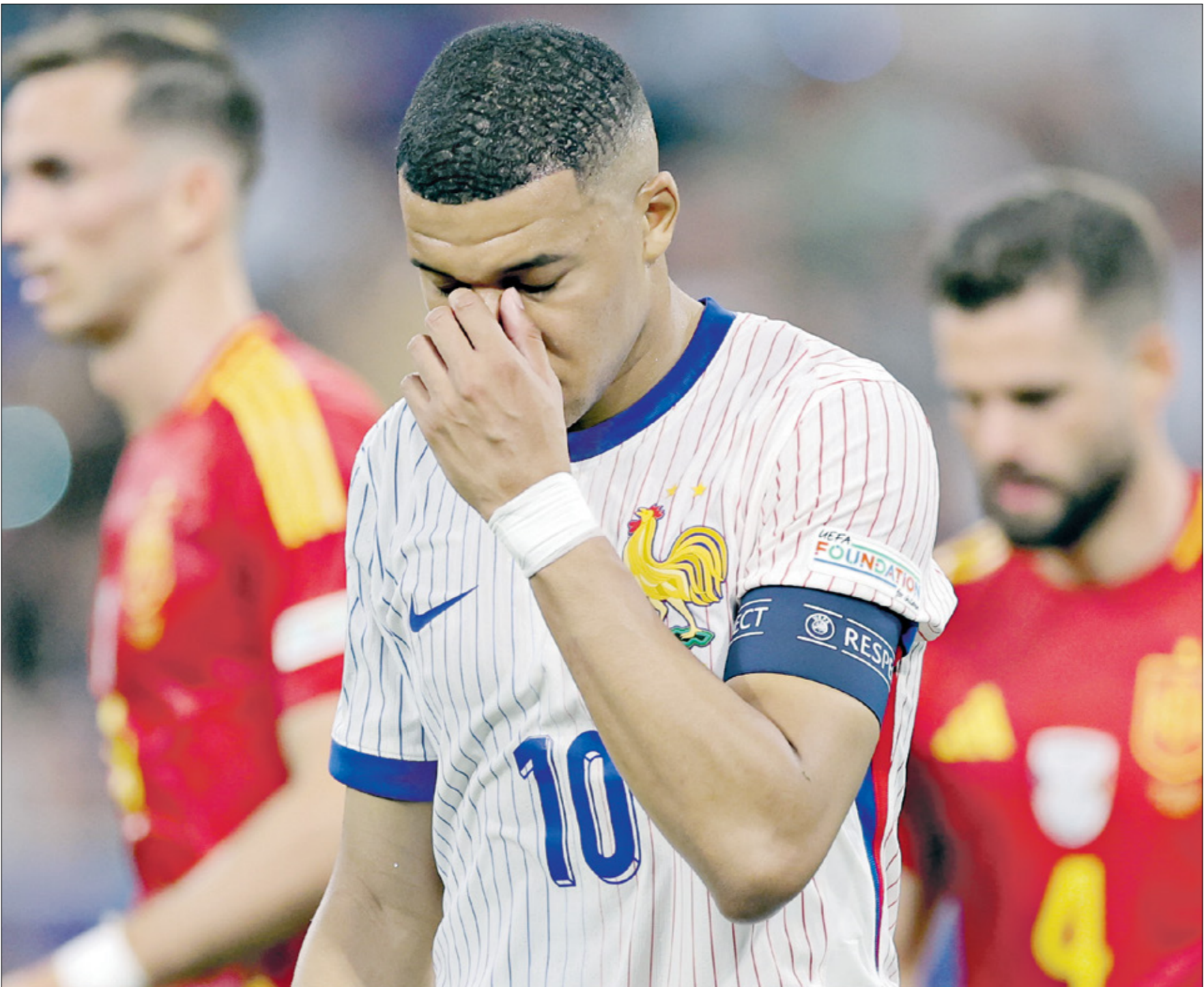
مبابي لم يكن موفئاً في بطولة اليورو

ويبدو من شبه المستحيل أن تحصل تطورات جديدة في مستقبل ديشان رغم ضعف الجماهير ووسائل الإعلام القوي، ومع ذلك فإن خيبة «يورو 2024» ستلاقي لاعب يوفنتوس سابقاً في الفترة القادمة، بسبب فشله في الاستفادة من مهارات نجوم فرنسا خلال البطولة، وعدم قدرته على أن يحسن مستواهم كما أن تعامله