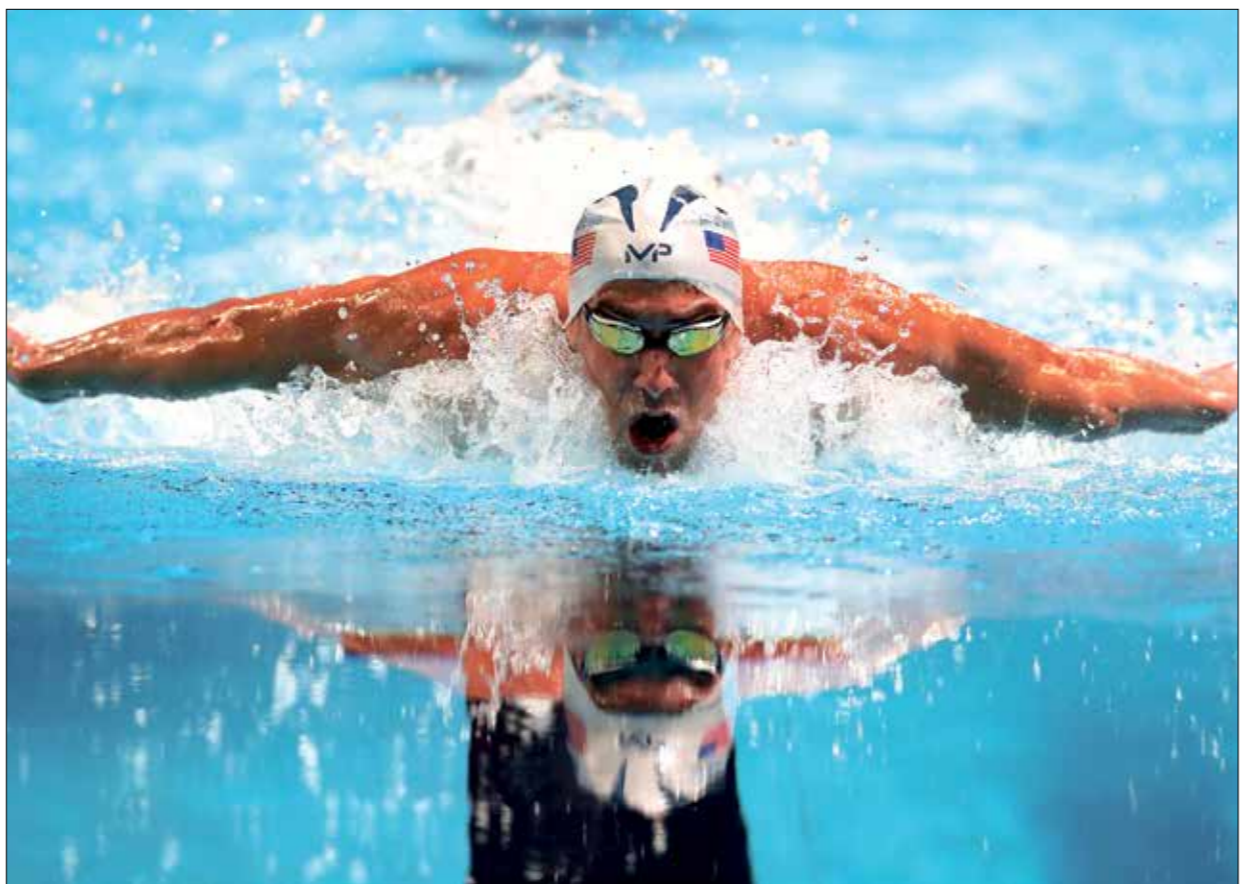
فيلبس أكثر اولمبيي لتحصي للصداليات

لكن، مع قرب انطلاق الدورة، وضعت قوانين صارمة، إذ لا يمكن للرياضيين أن يتعاقفوا أو يتصافحوا خلال الاحتفالات بتحقيق النصر، ويتعين عليهم الالتزام بالكاميرات طوال الوقت باستثناء فترة تناول الطعام، والنوم، والتخافس، ويسمح لهم فقط بالتنقل بين القرية الأولمبية وباقى المنشآت الرياضية، فيما تتراوح العقوبات بين التحذير اللفظي والغرامات والإقصاء من الالعاب