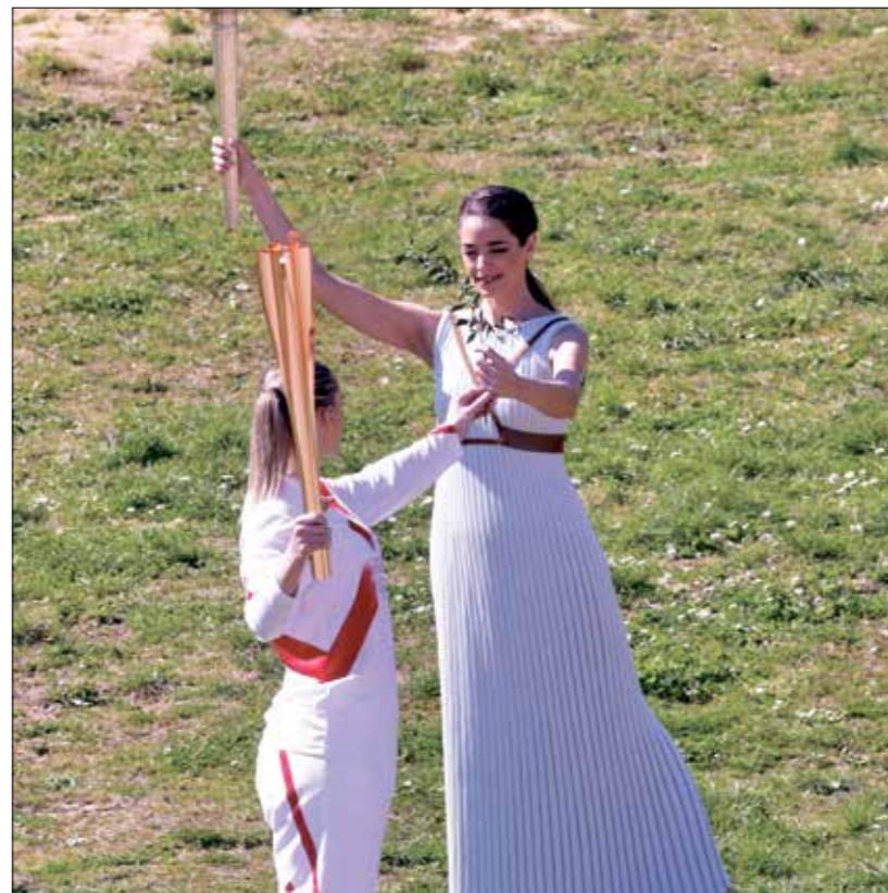
الشعلة الاولمبية وصلت منذ دون جواهر (مناوس) باليابان

كان وصول الشعلة الأولمبية حزيناً، مع إبقاء الجماهير بعيدة عن الحفل المتواضع الذي اقيم في ملعب خال، ولا شك بأن غياب المتفرجين عن المدرجات، سيجعل هذا الأولمبياد نسخة باهتة عن المناسبات السابقة، بعدما ظلّ الجميع أنها ستكون احتفالية كبيرة، عندما أعلن في الثامن من سبتمبر/ أيلول 2013، منح طوكيو شرف استضافة الدورة الصيفية عام 2020، حينها، انهار مقدمو البرامج التلفزيونية اليابانية بكاءً، وابتهجت البلاد، التي كانت تخشى من أن يؤدي الحادث النووي في محطة فوكوشيما بعد زلزال وتسونامي عام 2011، إلى تدمير امال اليابانيين، ليلتحق على الالعاب الأولمبية اليابانية حينها اسم «العاب إعادة الأعمار». وواجهت الأولمبياد انتكاسات كثيرة منذ عام 2015، عندما ألغى مشروع المهندس العراقي - البريطاني زها حديد، وسلم إلى المهندس الياباني كينغو كوما، بسبب الكلفة المرتفعة، وعاد كل شيء إلى نقطة البداية مرة أخرى، فيما شهدت اليابان فشلاً آخر يواخر سبتمبر/ أيلول 2015، عندما تخلت اللجنة التنظيمية لأولمبياد عن شعار كنجيرو ساتو الأول للالعاب، لأنه كان شبيهاً بشعار مسرح لياج البلجيكي، فيما لجأ مصممه إلى القضاء