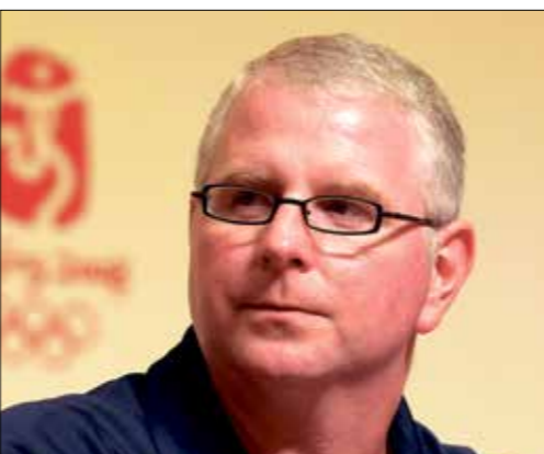
المدرب يومان ساهم في نجاح فيلبس (جوانالك فريب) (Getty)

فيلبس لا يزال يحتفظ بـ 1 رقماً قياسياً بالفئات العمرية، تمره يومان كان سبياً في نجاحه من دون شك، وعن أسلوبه المنضبط والقاسي والصارم، قال فيلبس: «التدرب مع بوب كان أذكى شيء قمت به على الإطلاق». هناك شائعة مفادها أنّ فيلبس كان يتناول 12 ألف سرعة حرارية كل يوم، لكن فيلبس ذكر أنّ الأمر مبالغ فيه وأنه لم يأكل كثيراً حتى في أيام نموه، يُذكر أنّ فيلبس خاض 5 دورات في الأولمبياد، وهو السباح الأميركي الوحيد الذي حقق هذا الإنجاز، رغم أنه كان قبل أولمبياد ريو دي جانيرو قد اعتزل،