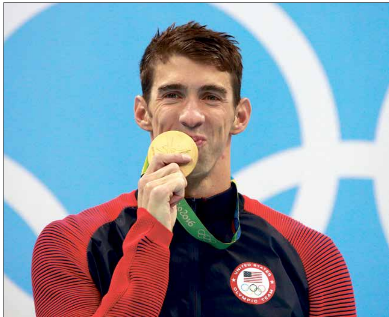
فيلبس حصد على 23 ميدالية ذهبية في مسيرته (ادم رينج) (Getty)

مايكل فريد فيلبس اسم سيطر على عالم السباحة في الالعاب الأولمبية لسنوات طويلة، هو الرياضي الأكثر نجاحاً على الإطلاق بمختلف الرياضات، بفضل نتيجاته الذهبية طوال الدورات الماضية ولد فيلبس عام 1985، وحصد خلال مسيرته في الالعاب الأولمبية 23 ميدالية ذهبية و3 فضيات وبيرونيتين، ما وضعه على قمة الهرم متفوقاً على أريسا لاتينا، لاعبة رياضة الجمباز التي منلت الاتحاد السوفيتي بالأولمبياد، بين 1956 و1964 وفازت بـ 18 ميدالية منها 9 ذهبيات عام 2008، في أولمبياد بكين، حطم فيلبس الرقم القياسي الذي سجله السباح الأميركي مارك سبيتز عام 1971 (7 ميداليات ذهبية في دورة واحدة)، حينها استطاع الدولفين الأميركي فيلبس التتويج 8 مرات بالذهبي.