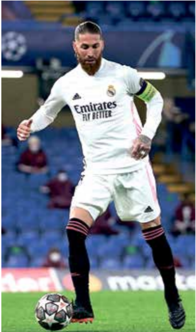
سيرخيو راموس سعيد بضمه إلى النادي «الترانسي»

من خلال المشاركة في بعض تجارب سيارة مكلارين، وأثبت خلالها أنّه قادر على أن يكون سائق المستقبل، وشهد هذه 20١8، نقطة تحول في مسيرته، بما أنّه أصبح سائقاً احترافياً لفريق مكلارين، كما نافس في فئة فورمولا 2، وحلّ ثانياً خلف جورج راسل، الذي يشارك حالياً في سباقات فورمولا ١. واتضح من خلال منافسات فورمولا 3 وفورمولا 2، أنّ نوريس قادر على المشاركة في بطولة العالم للفورمولا ١، باعتباره هذه التجارب أعته ليقتحم الرحلة الأصعب. وأعلن فريق مكلارين في 20١9، أنّ نوريس سيكون أحد سائقي الفريق إلى جانب الإسباني كارلوس ساينز جونيور، لتتطلب مغامرة السائق البريطاني مع عالم سباقات السرعة من استراليا، لكنّه حلّ في المركز الـ12 في أول سباق له، وخلال السباق الثاني في البحرين حصل على أولى النقاط في رصيده، وخلال موسم 202١، تميز نوريس بكونه السائق الوحيد الذي نجح في الحصول على نقاط في كل المراحل، كما صعد إلى منصة التتويج مرتين، ليحتل المركز الرابع في الترتيب العام متقدماً على سائق مرسيدس، فالتريري بوتاس، وهي نتائج تشير إلى أنّه من أبرز السائقين حالياً، ويمكنه أن ينافس على المركز الثالث في نهاية الموسم.