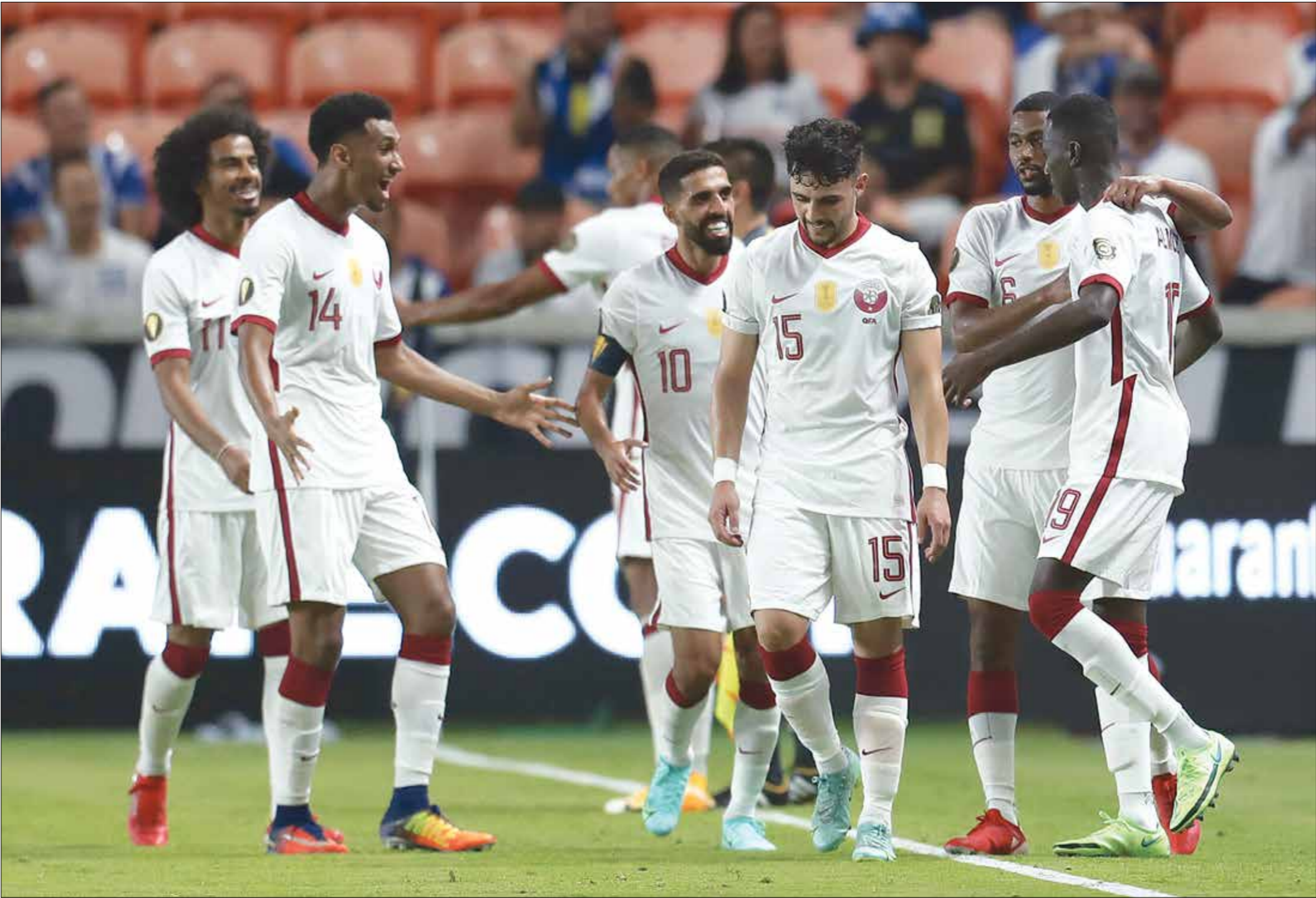
منتخب قطر لكرة القدم، في مباراة مع منتخب بنما

تأخير انطلاقة مباراة منتخب قطر، ضد منافسة منتخب بنما، ضمن منافسات الكأس الذهبية، وكان من المفترض أن