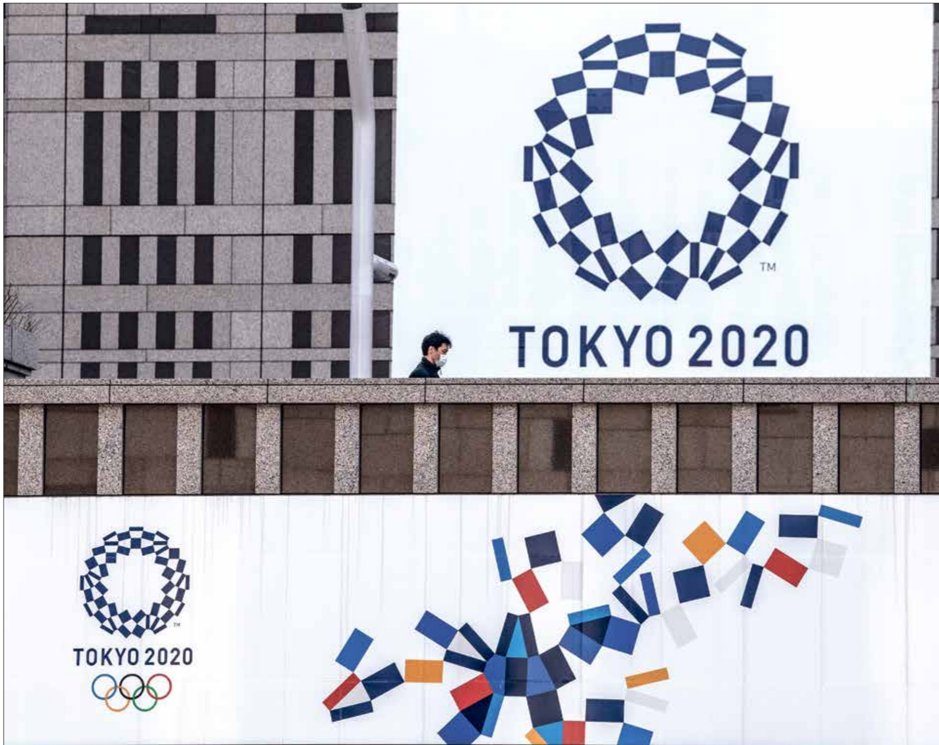
الاولمبياد كان مصرها للتاجيد مجددا (كاراك كورت)