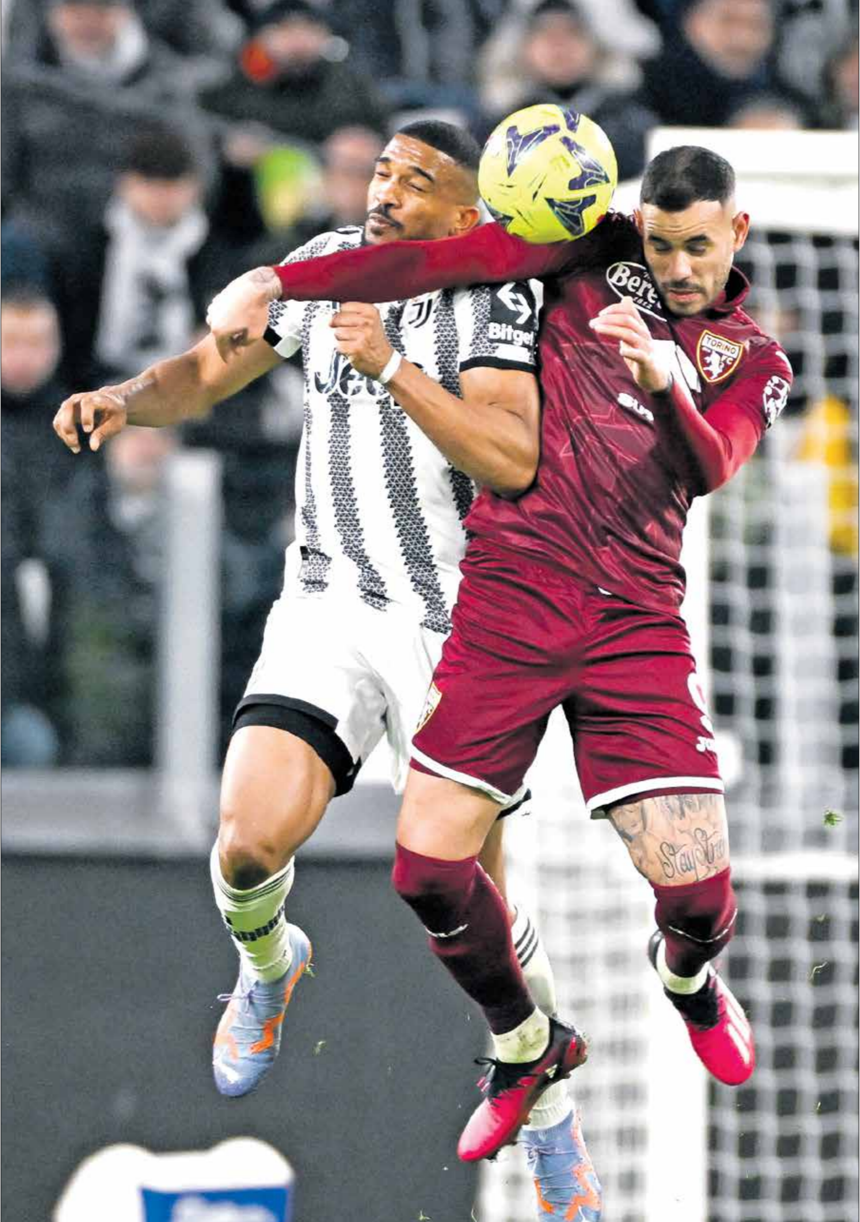
يوفنتوس يحل المركز الثالث في الكالتشيو (الليغا)

وفي «الليغا»، يسعى ريال مدريد للاقترب خطوة أخرى من التتويج بلقب الدوري الإسباني، حينما يحل ضيفا ثقيلًا على ريال مايوركا، السبت، في إطار الجولة 31 من المسابقة ومع تحفي 8 مباريات فقط على نهاية «الليغا»، تنصذر الريال جدول الترتيب برصيد 75 نقطة، بفارق 8 نقاط عن أقرب ملاحقيه، برشلونة، و10 نقاط عن جيرونا صاحب المركز الثالث، ويتسلح ريال مدريد بسجل قوي، حيث لم يتلق سوى خسارة واحدة فقط هذا الموسم، في الليغا، كما حقق 3 انتصارات و3 تعادلات في آخر 6 مواجهات بالمسابقة، ويامل المدرب الإيطالي كارلو أنشيلوتي بأن يحقق فريقه الفوز بهذه المباراة، من أجل مصالحة الجماهير واستعادة الثقة، بعد التعادل مع ضيفه مانشستر سيتي (3-3)، في ذهاب دور الثمانية بدوري أبطال أوروبا. وسيدخل ريال مدريد مباراة مايوركا بصقوف متمثلة، باستثناء الحارس تيبو