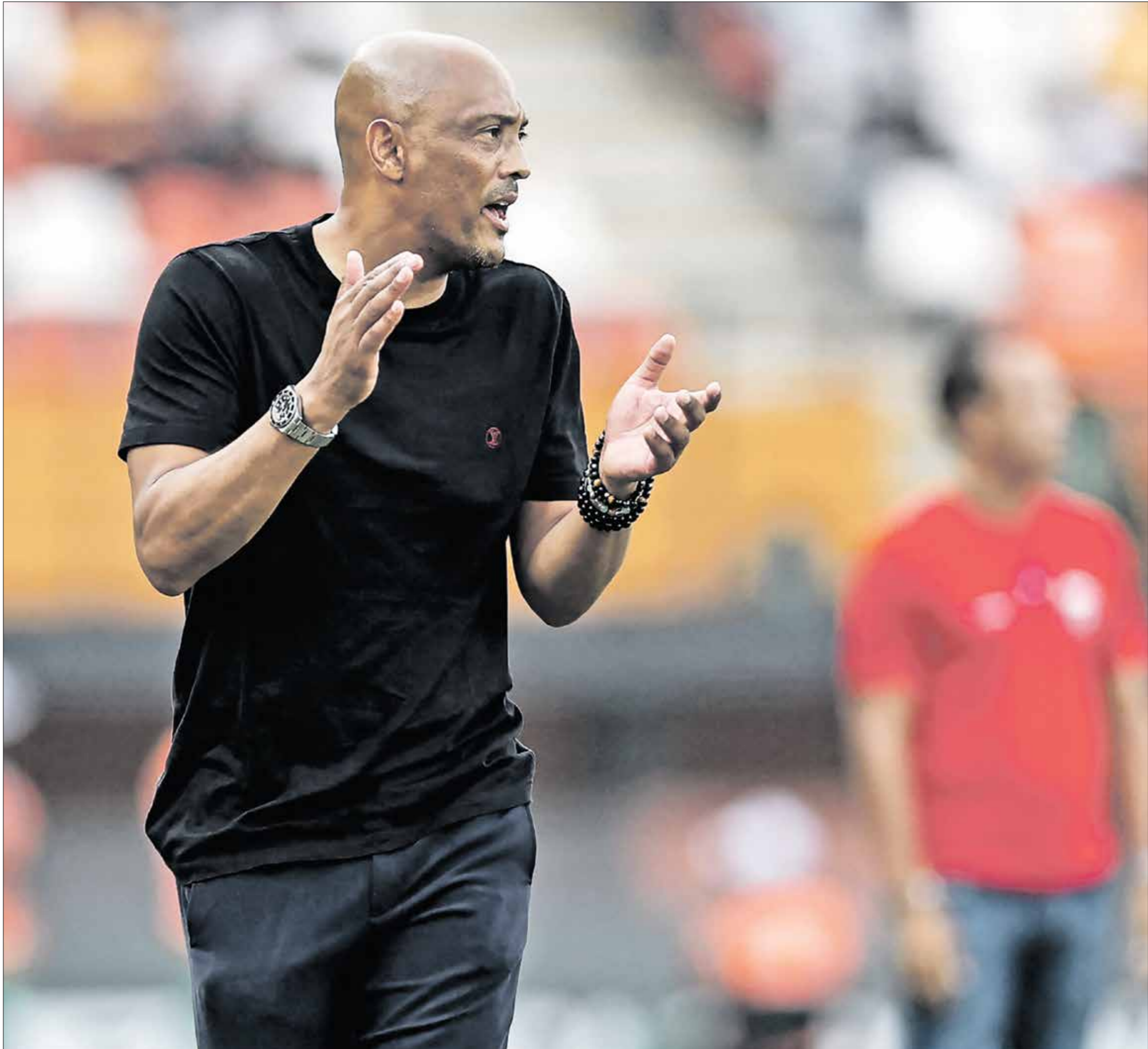
حاد عبدو موريتانيا للظهور بوجه مثير في كأس أفريقيا

كبيرة في موريتانيا، إذ إنه فاز بلقب الدوري الموريتاني في ثلاث نسخ متتالية، وسجل رقماً مذهلاً عند قيادته المنتخب، إذ لم يخسر طيلة 15 مباراة بين شهر مارس/آذار 2022 ويانير/كانون الثاني من العام الماضي 2023. وتعيّن الجماهير الموريتانية، خلال الفترة الماضية، على الفرصة الأولى لتدريب العالم، التي ستقام بالولايات المتحدة الأميركية وكندا والمكسيك في 2026، إذ كان لهذا الحلم أصراً بعيد المآل في السنوات الماضية، لكن في الفترة الحالية من حق