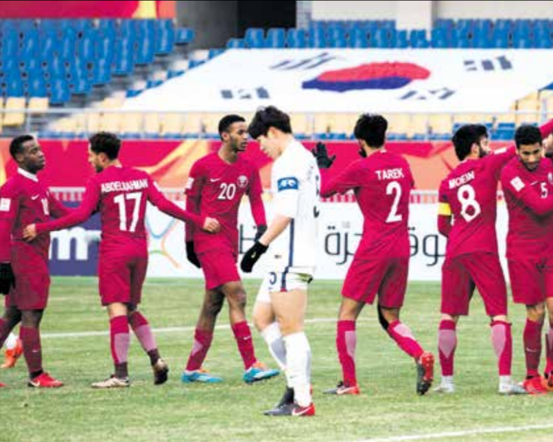
مت مشاركة منتخب قطر في كأس اسيا تحت 23 سنة عام 2018