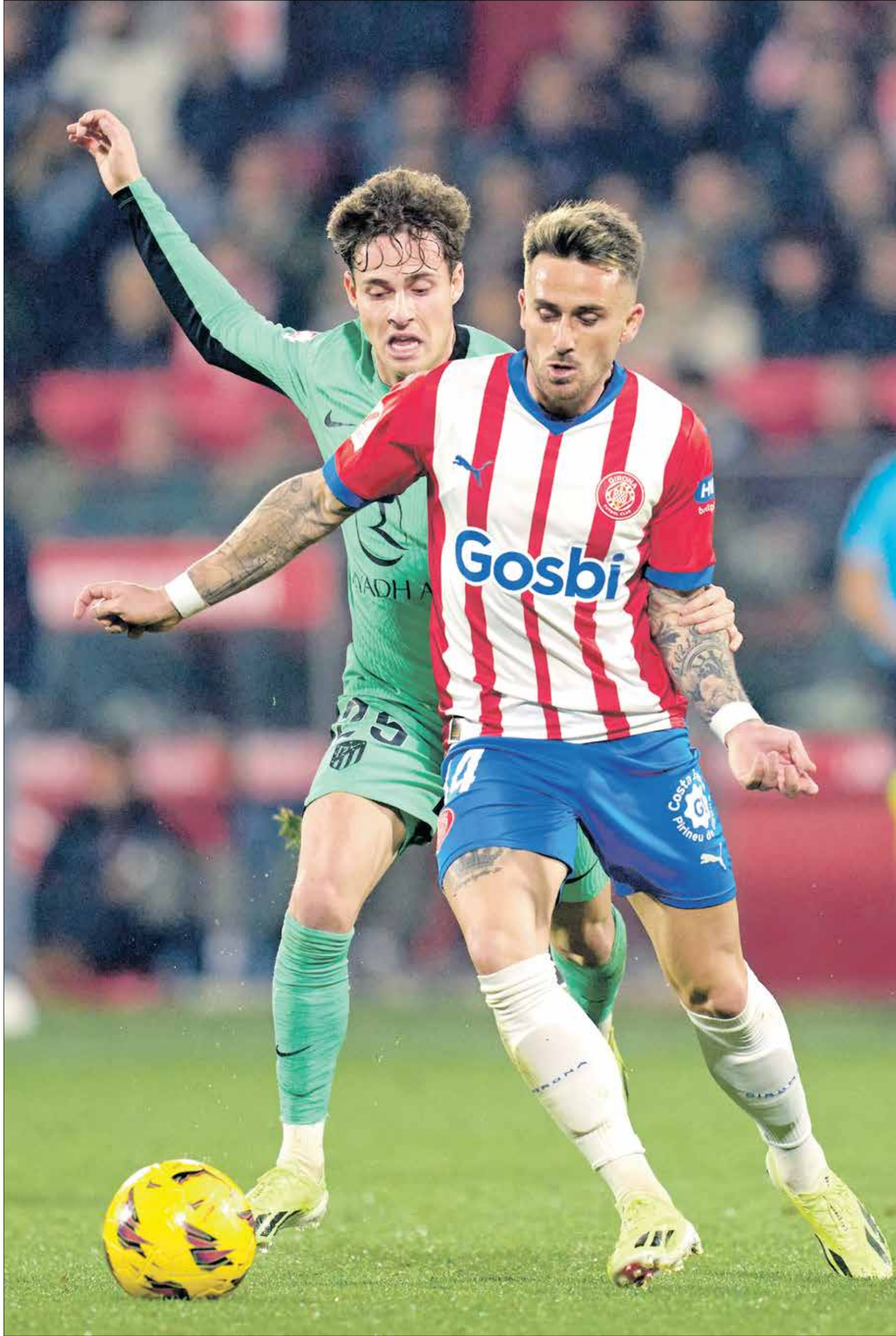
90 دقيقة لثيرة منتظرة بين الثالث والرابع في بطولة «الليغا»

تشهد الجولة الـ 31 من منافسات بطولة الدوري الإسباني لكرة القدم لموسم 2024-2023 قمة مرتقبة بين جيرونا الثالث صاحب الـ 65 نقطة وأتلتيكو مدريد الرابع صاحب الـ 58 نقطة. ويسعى كل فريق لتحقيق الفوز من أجل المحافظة على حظوظ التاهل إلى دوري أبطال أوروبا في الموسم المقبل، مع الإشارة إلى أن فوز جيرونا سيقربه كثيراً من التاهل لأول مرة إلى البطولة الأوروبية الكبيرة.