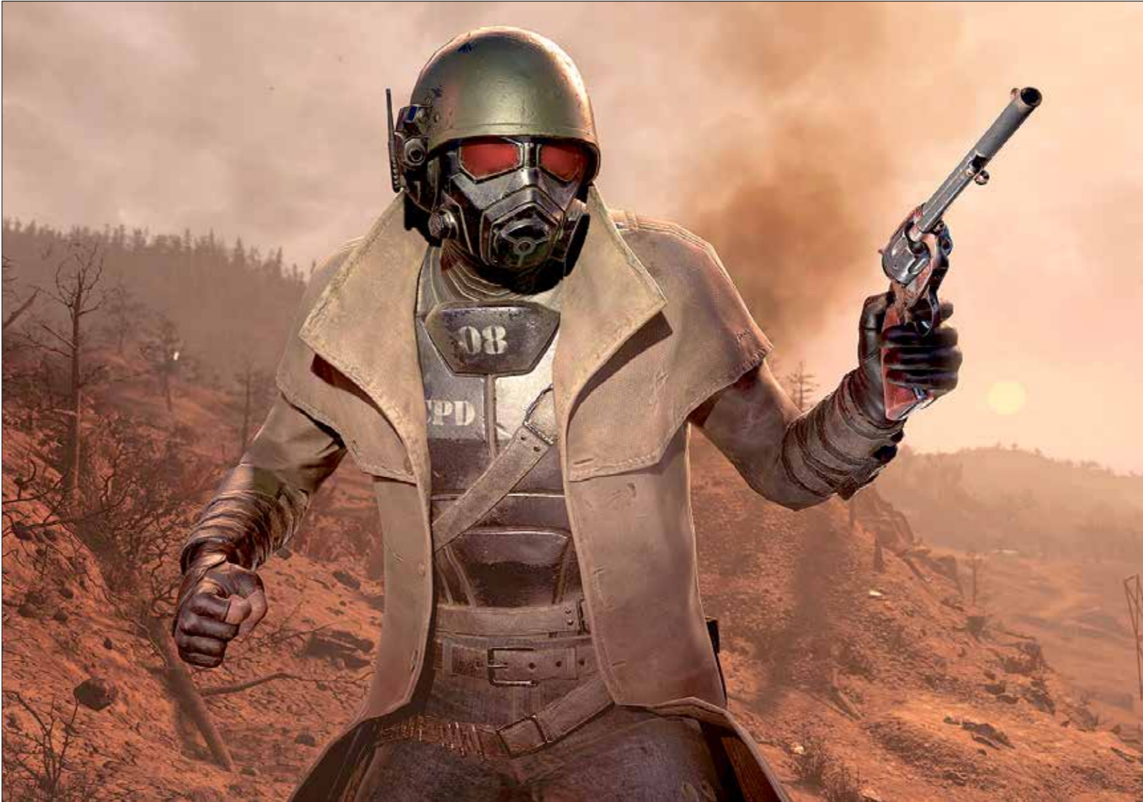
يحتك ميكرو اللعبة بمرور عشر سنوات على إصدار أول نسخة لها

موسيقى الجاز والسوينغ والخوف من المد التسوعي، إضافة إلى كم هائل من الإشارات الخفية إلى ألعاب وأفلام وكنت حقيقية. وتغيب الاكتشافات اللاحقة كالاعتماد على الطاقة المتجددة والبديلة، وقد يكون غياب الترانزستور واحداً من أهم المسببات لتاريخ زمني معاصر كهذا. لا داعي للقول إن هذا التصور للتاريخ بشد الاهتمام، ويدفع الكثير من محبي اللعبة