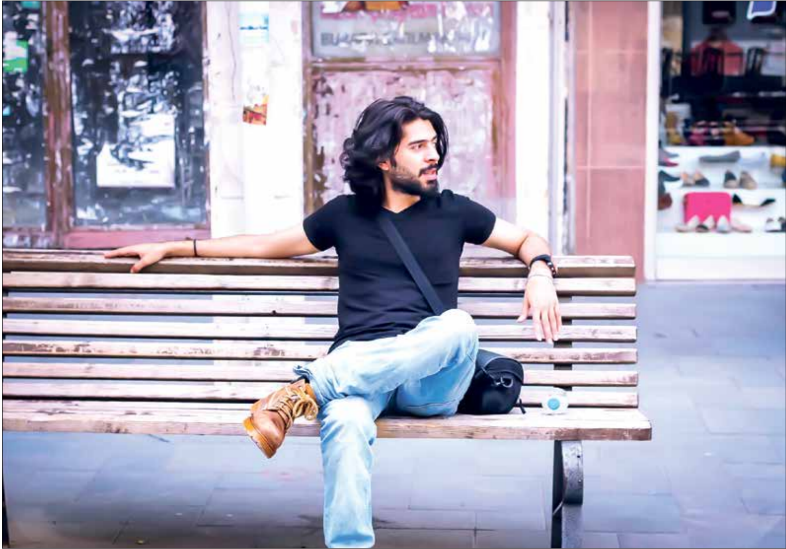
تعهد اكتشاف الدراما والقصص المبتدئة في مكتب العربي (الجديد)

قبل سنوات، استطاع محمد مشيش أن يغزو القاهرة ببعض الإنتاجات التي سيرعرض على حربية من ولفهم «أصلقة» والمسلسلات، ومنها «فران أوائل» و«عربي والمالي أوجيني»، وغيرها من الأعمال التي خرجت عن السياق التجاري، ونالت قبال الجمهور والتقاد في آن. لكن يبدو أن التغييرات السياسية، تدفع مشيش وغيره من المنتجين إلى العمل عن