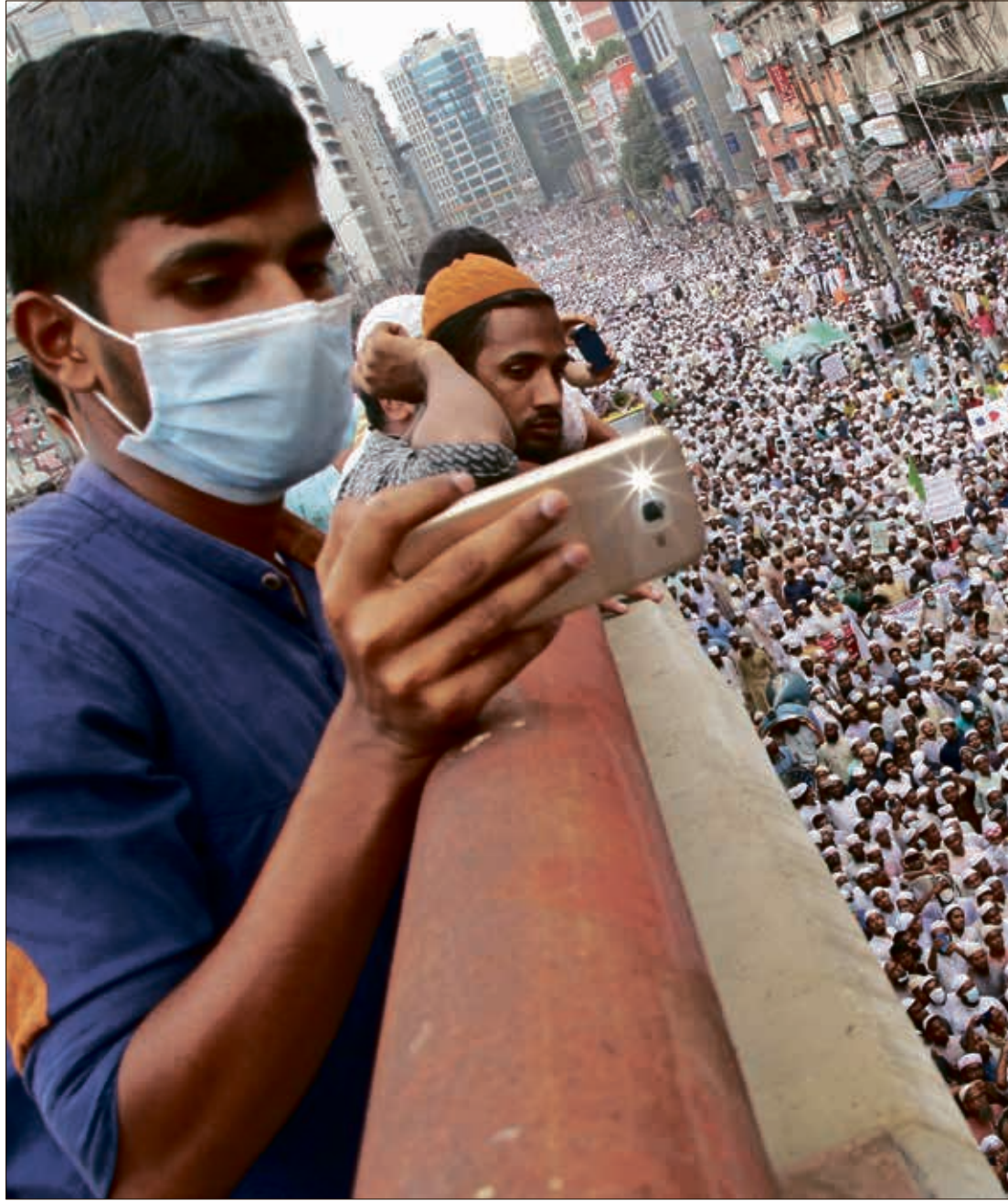
من تظاهرة ضد فرنسا في دكا اوالك نوفمبر

كذلك تناقل مستخدمون على فيسبوك وتويتير وإنستغرام صوراً قيل إنها تُظهر المستشار الألمانية أنجيلا ميركل مع المانيات مسلمات محجّبات، للإشارة إلى أن ميركل أكثر احتراماً للإسلام في بلدها من ماكرون في فرنسا. لكن الادعاء خطأ، فالصورة تظهرها بين سيدات أعمال سعوديات. أكثر من مليون و400 ألف