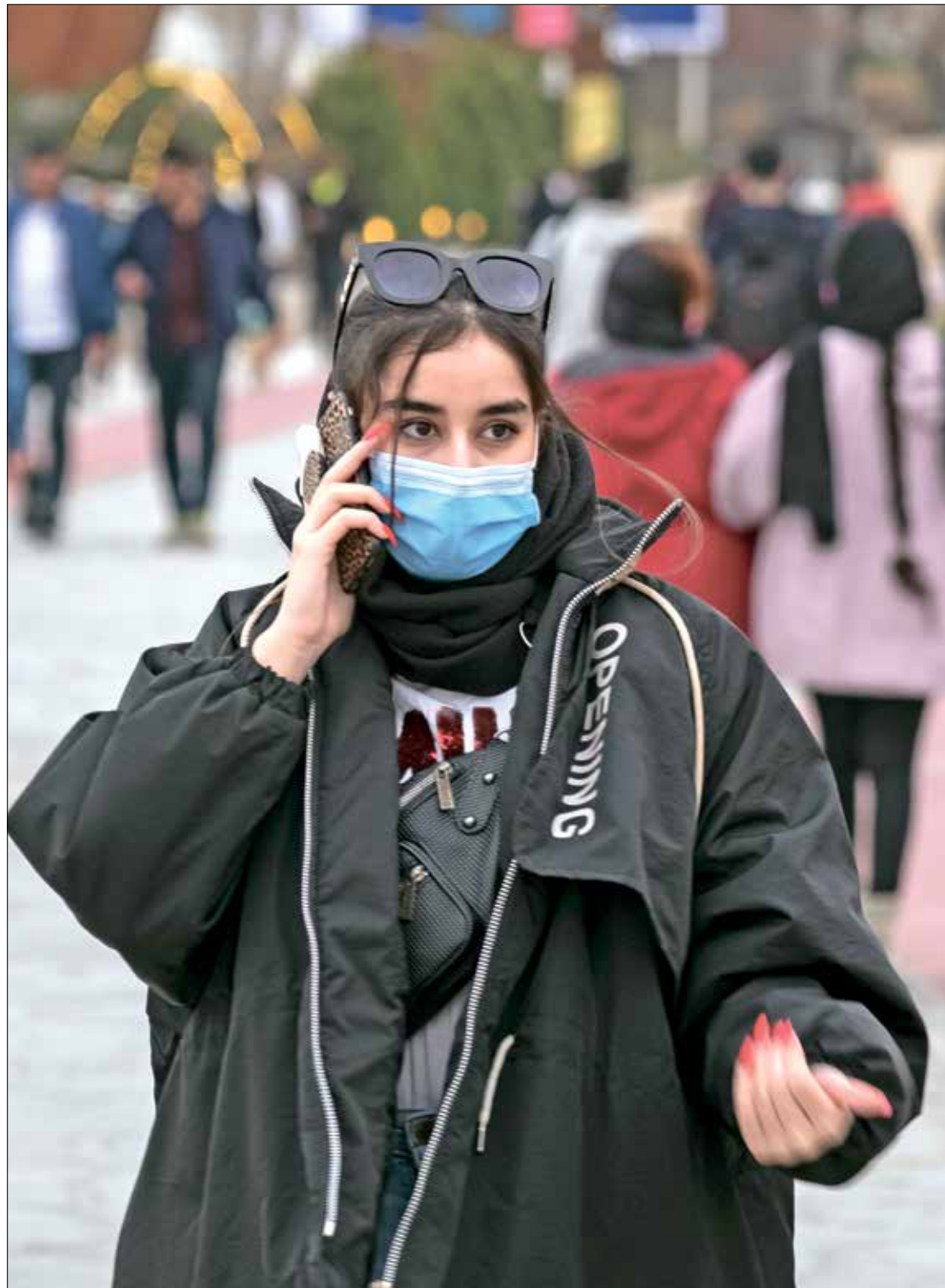
طريقة التواصل في كلوب هاوس أسهل

بحسب بيانات «نفين هاب» لرصد شبكات التواصل الاجتماعي في إيران، فإن تطبيق «واتساب» غير المحظور و«تيلغرام» المحظور في إيران منذ 2018 هما الأكثر شعبية بين الإيرانيين، حيث يصل عدد المستخدمين الإيرانيين للتطبيقين إلى أكثر من 47 مليون شخص لكل منهما وذلك من أصل 85 مليوناً عدد الإيرانيين. ومنصة «إنستغرام» هي الثالثة في الشعبية في البلاد بـ 44 مليون مستخدم إيراني، والتي تتصاعد الدعوات لحظرها. كما أن «فيسبوك» و«تويتر» المحظورتين تليان قائمة الشبكات الاجتماعية الأكثر انتشاراً في إيران بعد المنصات الثلاث المذكورة. شكلت السلطات الإيرانية مجموعة «تحديد المضامين الجرمية» التي تشرف على العالم الافتراضي والمضامين التي تنشر من خلاله عام 2009، على أعقاب إقرار مجلس الشورى الإسلامي (البرلمان) في إيران قانون «الجرائم الإلكترونية»، وفق المادة 22 من القانون. ويشرف على المجموعة المدعي العام الإيراني.