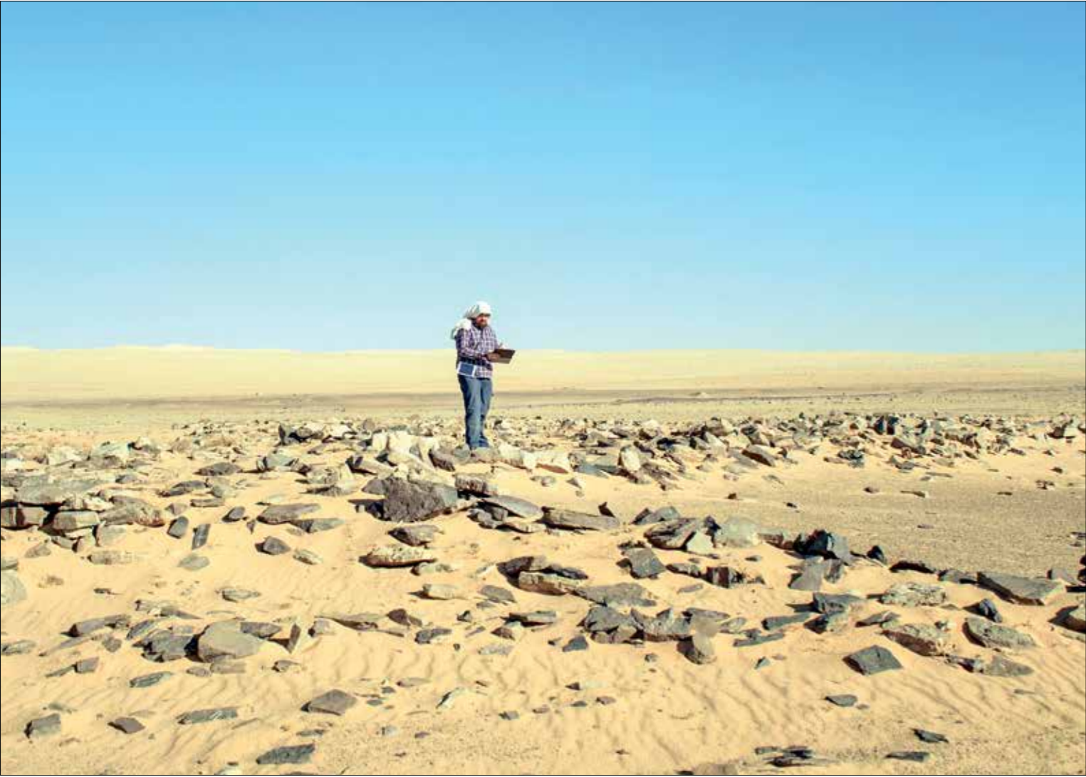
تشير الدراسة إلى وجود المستطيلات والبيئة فيسوانك