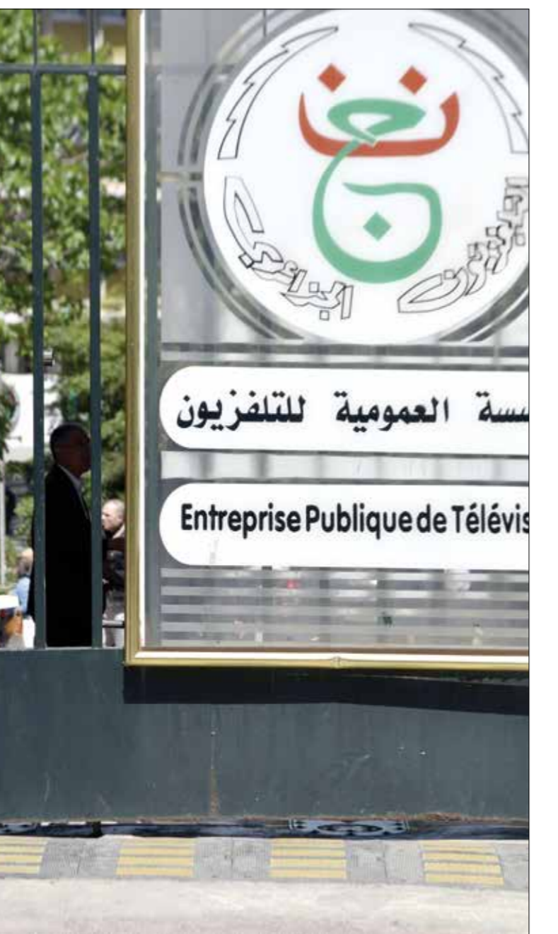
استقبل التلفزيون الجزائري صحافيين ضرفوا من قنوات أوقفت بثها

عندما بدأنا العمل في قناة «يوميديا نيوز» في 2016، كنا نأمل أن نتمكن من العمل بحرية، لكننا وجدنا أنفسنا في موقف صعب. السلطات الجزائرية تحافظ على مستوى من التحوّج على الصعيد القانوني، فلا تزال النصوص القانونية المنظمة لعمل القنوات التلفزيونية غير واضحة، ولم تصدر إلى الآن المراسيم التنفيذية ودفتر الشروط المختم لكيفية إنشاء قنوات تلفزيونية، رغم مرور 9 سنوات على صدور قانون الإعلام الجديد و6 سنوات على صدور قانون السمعى البصري، وتحتج السلطات كل مرة بتذرائع سياسية، آخرها إرجاء صدور هذه المراسيم إلى ما بعد صدور الدستور الجديد في نوفمبر/ تشرين الثاني الماضي.