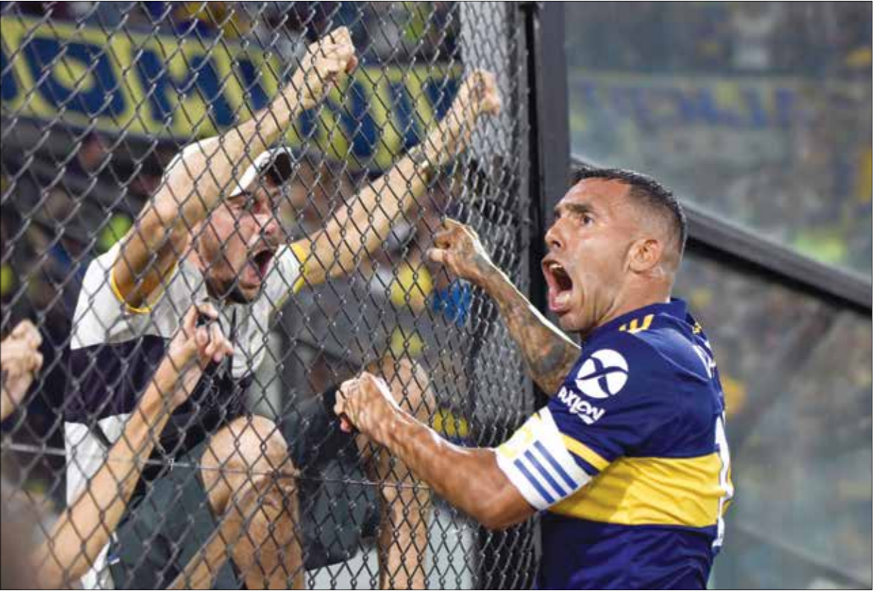
ليمرر حصد لقب كوبا ليبرادورس في عام 2003 بقميص بوكا

يُقال أيضاً إن الضربات القوية تهشم الزجاج، لكنها تصلح الحديد، كان هذا كارلوس تيفيز أيضاً، ابن بونينس ايرس الذي ولد في عام 1984 واحتفل قبل أيام بعده السابع والعشرين، في غيرسيو ديل سيوداديليا، تحديداً حي غيرسيو ديل لوس أندس، المعروف باسم «فورتي اباتشي»، تلك المنطقة كانت بين عامي 1807