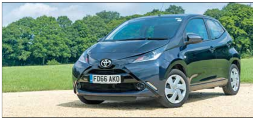
سيارات صغيرة من «تويوتا» و«هوندا»

رئيس الاتحاد الياباني للمركبات الصغيرة هيونداي هوري، نقلت عنه شبكة «يولومبيرغ» الأميركية قوله إن «المبادرة والقدرة على تحفّل التكاتف هما بمعاية شريان الحياة بالنسبة للسيارات المدججة التي هي وسيلة نقل مهمة تعمل كبنية تحتية بديلة لحل محل وسائل النقل العام». وسيارات «كي» شائعة في الأرياف، حيث أنظمة النقل العام محدودة، بينما تُعد مناسبة تماماً للطرق الضيقة في اليابان، والتي يخفي عرض 85% منها فقط مرور سيارات «كي» وفقاً لتصريحات أدلى بها رئيس «اتحاد مصنعي السيارات اليابانية» والرئيس التنفيذي لشركة «تويوتا موتور