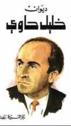
ديوان خليل حاوي

في الجنوب: جواني سبأ الارض/ في ارضي/ وصوابي واطحابي لاشيعي/ تتلح حفتي العار/ هي غيبوبة الحقن/ لن يكونني قلبني ولدت بدمي/ قلبني انصم البكم الاعمى.