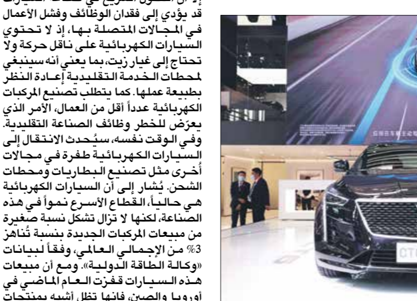
«كاديلاك سي.إم.إف» في معرض بكين الدولي 2020

أي قطاع تصنع آخر حتى الآن. كما سيكون لذلك تداعيات هائلة على قطاع النفط والغاز، الذي تربط ثرواته ارتباطاً وثيقاً بحرك الاحتراق الداخلي. إلا أن التحول السريع في صناعة السيارات قد يؤدي إلى فقدان الوظائف وفشل الأعمال في المجالات المتصلة بها، إذ لا تحتوي السيارات الكهربائية على حرك حركة، ولا تحتاج إلى غيار زيت، بما يعني أنه سينبغي لمحطات الخدمة التقليدية إعادة النظر بطبيعة عملها، كما يتطلب تصنيع المركبات الكهربائية عدداً أقل من العمال، الأمر الذي يعرض للنظر وظائف الصناعة التقليدية. وفي الوقت نفسه، سيُحدث الانتقال إلى السيارات الكهربائية طفرة في مجالات أخرى مثل تصنيع البطاريات ومحطات الشحن. يُشار إلى أن السيارات الكهربائية هي حالياً القطاع الأسرع نمواً في هذه الصناعة، لكنها لا تزال تشكل نسبة صغيرة من مبيعات المركبات الجديدة بنسبة تُناهز 3% من الإجمالي العالمي، وفقاً لبيانات «وكالة الطاقة الدولية». ومع أن مبيعات هذه السيارات قفزت مناصحاً في أوروبا، وحتى ديسمبر/ كانون الأول العام، 2020