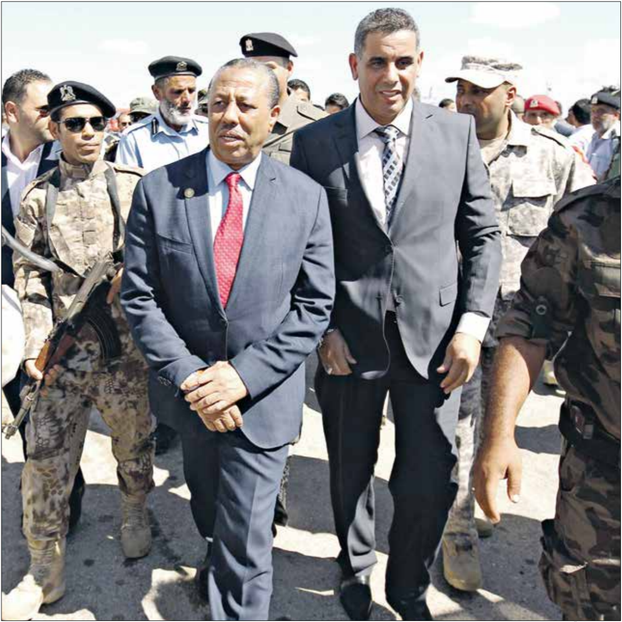
فان التلي أن حوكمته ستمرة في اءاء مهامها، بعد التوجهوا لراس برس

وأعلنت الأمانة العامة في ليبيا، الجمعة، بعد جولتي تصويت لملتقى الحوار،