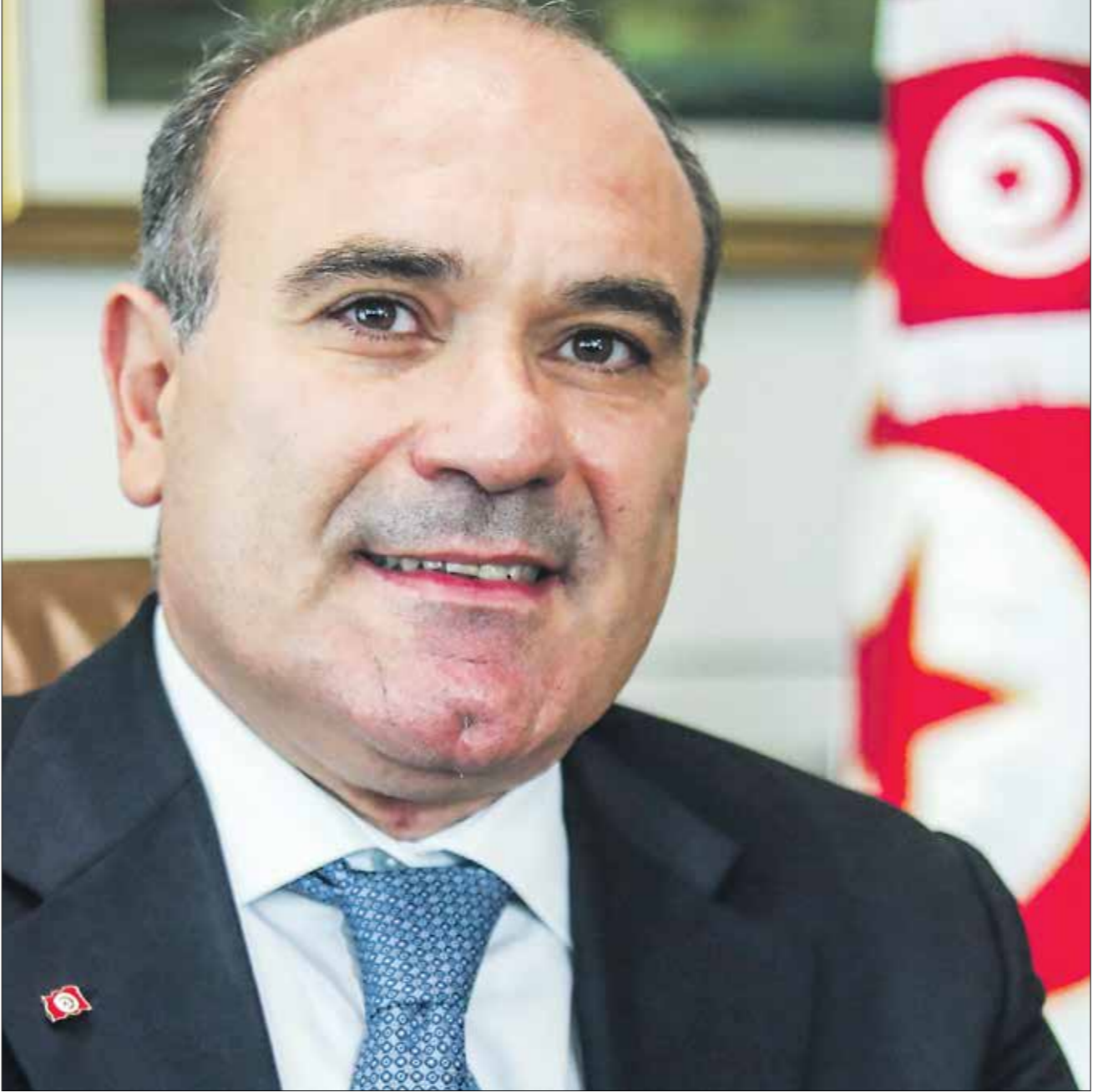
وزير السياحة التونسي الحبيب عمار (اليمين الحادي)

■ بالفعل، السياحة في العالم ستكون حتما مغامرة لما كانت عليه بسبب ما خلفته الأزمة الصحية وما فرضته من إجراءات