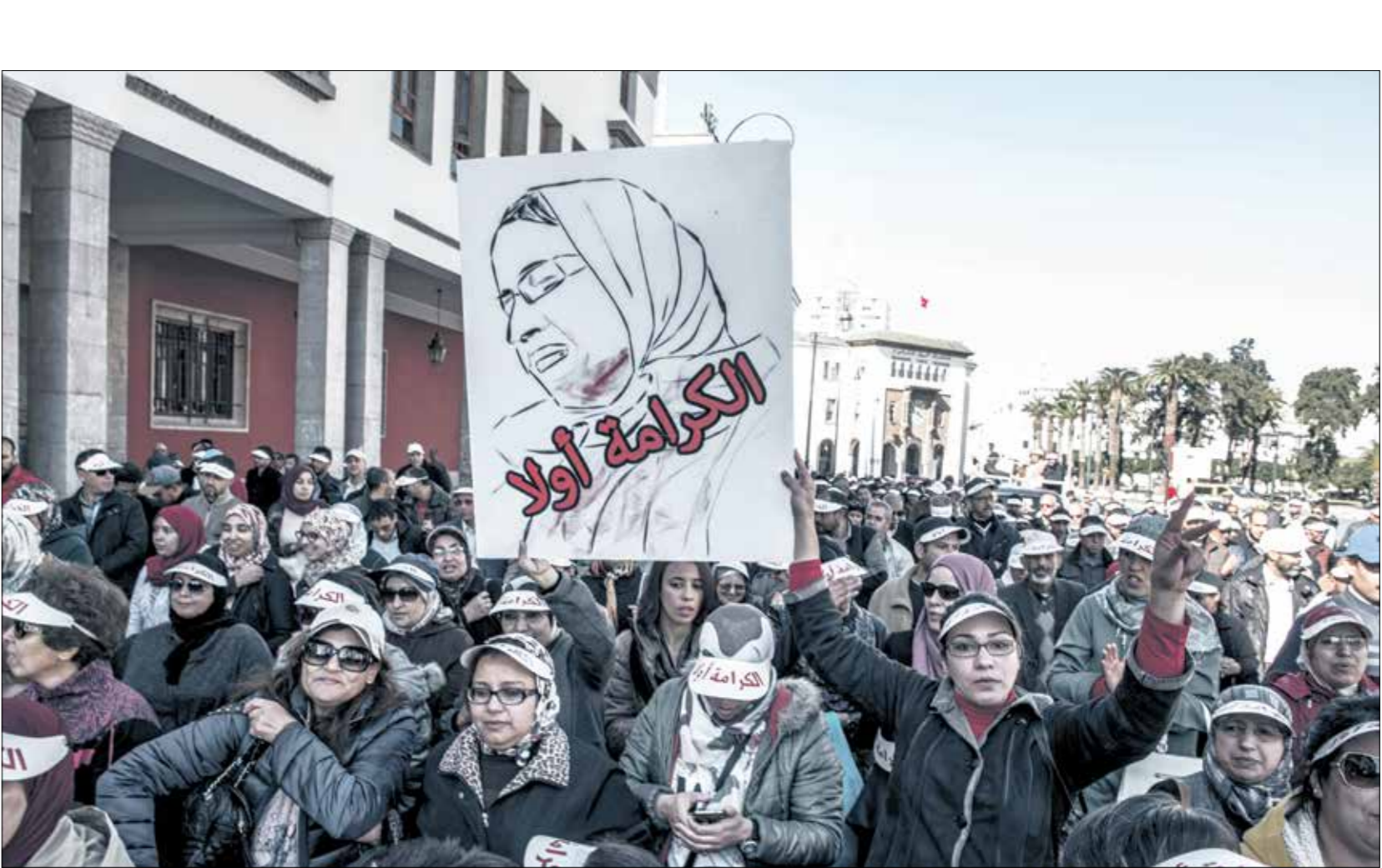
مة الاحتجاج الساتذة ضد العنف الذي يتعرضون له

لم تعد المدارس في المغرب تتمتع بالقدسية، كما لم يعد الأساتذة يحظون بالتقدير، بدليله ازدياد العنف بحقهم، الأمر الذي يفرض اتخاذ إجراءات سريعة