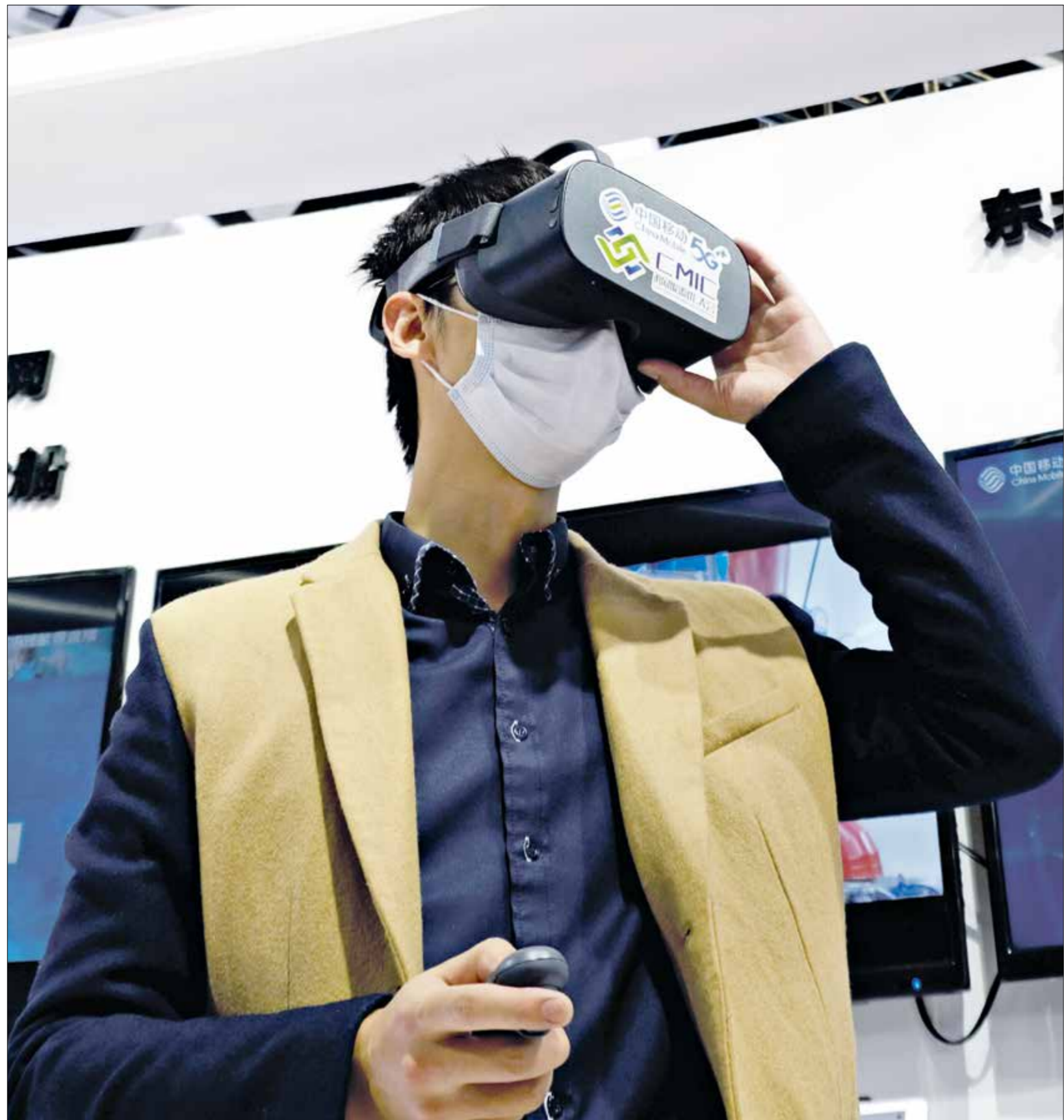
في معرض صناعات الإنترنت في شيفانغ، الصينية، اكثوبر الماضي

سجلت كبرى شركات الإنترنت الصينية نمواً في إيرادات أعمالها بنسبة 12,5% على أساس سنوي خلال العام 2020، وفق ما أظهرت بيانات رسمية، وكرت وزارة الصناعة وتكنولوجيا المعلومات، أن كبرى الشركات سجلت عائدات بلغت قيمتها 1,28 تريليون يوان (حوالي 198 مليار دولار أميركي)، ونمت الأرباح التشغيلية لقطاع الإنترنت بواقع 13,2% على أساس سنوي إلى 118,7 مليار يوان، بينما بلغ إجمالي إتفاق القطاع على البحوث والتطوير 78,8 مليار يوان، وزيادة بنسبة 6% مقارنة مع عام 2019. وتغطي إحصاءات الوزارة، وفق وكالة شينخوا، الشركات التي بلغت إيراداتها السنوية من خدمات الإنترنت أكثر من 5 ملايين يوان.