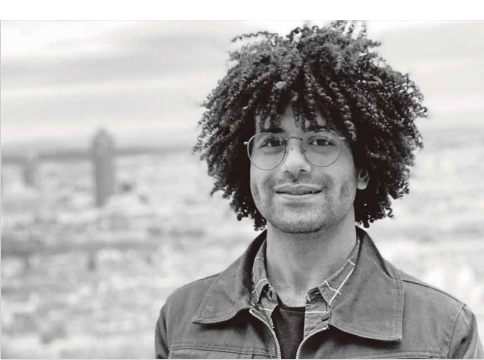
كويش: تلونت القضية من جانب إنساني ولم ارد ان اتعب دور المخرج فقط (العربي الجديد)

عربي، فحتي في دول الجوار لا يعلمون تلك الحادثة، على الرغم من فظاعة الحادثة والإرقام الكبيرة للضحايا، إلا أن الحكومة العراقية نجحت في تضليل الراي العام وتصدير روايات لتجبر مقتل جنودها، لتدعي أن هناك العديد من المدن في العراق سقطت، وتضام بذلك بأرقام الضحايا، لتجرد نفسها من أي مسؤولية تجاه ضحايا «سبايكر». التقينا بأحد الناجين الذي أكد أنه خلال الحادثة كان يوجد 4000 شخص،