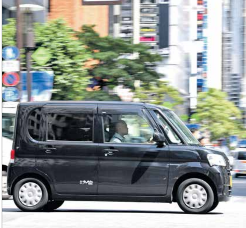
«دايماسو ناتو»، في شوارع طوكيو