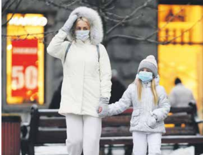
اعتادت الطنظة وضع الكمامة

هل يشعر الأهل بالقلق من جراء تأثير الكمامات على نمو أطفالهم اجتماعياً وعاطفياً؟ نقول استناداً على نفس روبيج كوسلويتز، في مقالة نشرتها في موقع «سايكولوجي نوادي»، أن الحديث عن تأثير كورونا على الأطفال بات حديثاً عالمياً. وكثيراً ما يُسأل الأهل: «ما مدى تأثير وضع الكمامات على قدرة الأطفال على قراءة الكلمات على فترة نموها؟ وهل سبواجهن مشاكل تتعلق بالمهارات التعليمية بسبب عدم رؤيتهم لأبوة صريحة؟» بالطبع، امور كثيرة تدفع الآباء للقلق. فالتربية أثناء الجائحة ليست تزهة. حتى أن الأهل باتوا يشعرون بالقلق من انعكاس تدعيم وراثتهم أثناء الجائحة على أطفالهم. هذا ما يجعلنا نعرض لكم بعض الأبحاث التي أجراها علماء النفس في السابق، وهم يقدّمون بشأن الآثار التراكمية لذلك.