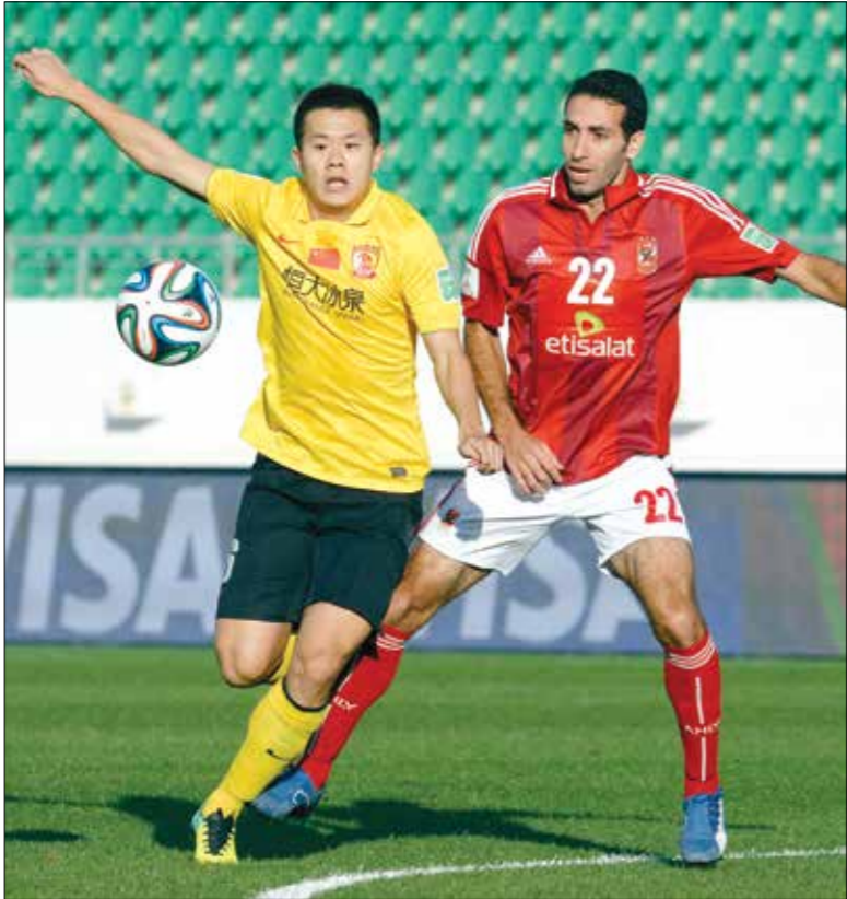
ابوتركية قدم مسجلات الملهة في مونديال الأندية

في عام 2005 إلى عام 2013، وكان أفضل لاعب داخل قارة أفريقيا 4 مرات، ولقب أفضل