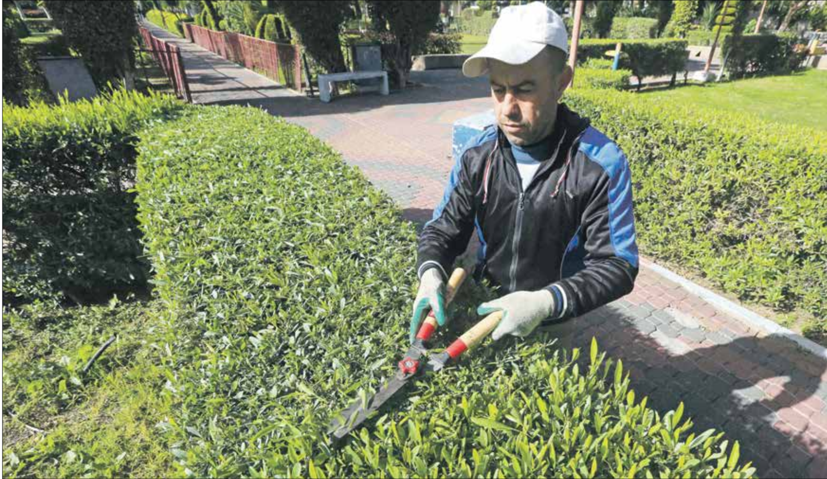
تعمل هذه المسات الفنية على الأشجار على جذب انظار المتنزهين (بعد الحكيم ابو رياش)

يعمل مقلمو الأشجار في غزة على المساحات الخضراء في المدينة، إذ يبتكرون منها أشكالاً هندسية بدقة عالية، وذلك لتعزيز المشهد الجمالي في الحدائق العامة