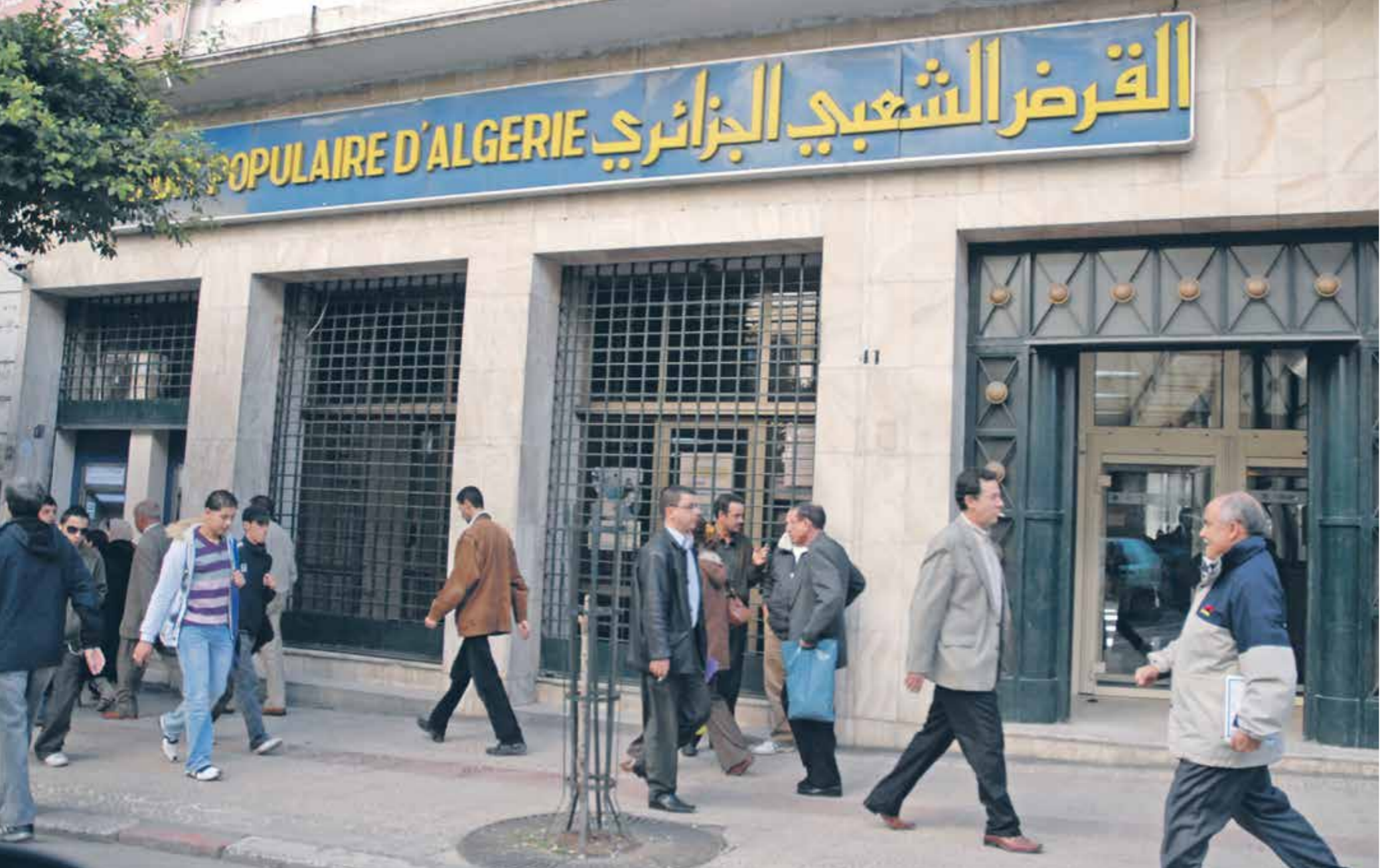
شاهد شروط منح القروض من البنوك الحكومية في الجزائر

تمتع رجال أعمال نافذون ومقربون من النظام السابق في الجزائر بقروض بنكية عالية بلا ضمانات، بينما ينتظر مستثمرون ورجال أعمال لا يحظون بدعم سياسي منذ سنوات عديدة قرد المؤسسات المالية الحكومية على طلباتهم المهمة