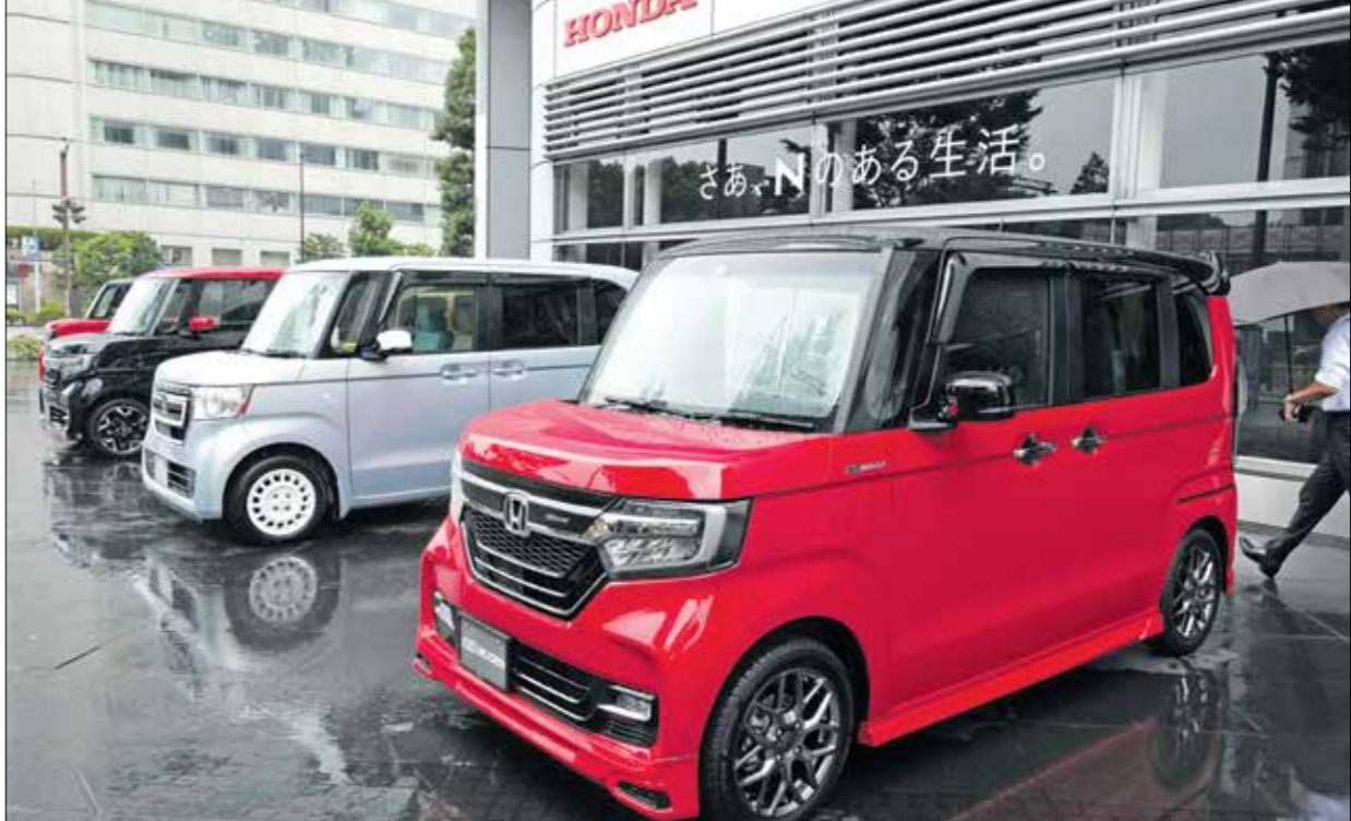
«إن بوكين»، واحدة من سيارات «كي» التي تصنعها «هوندا»