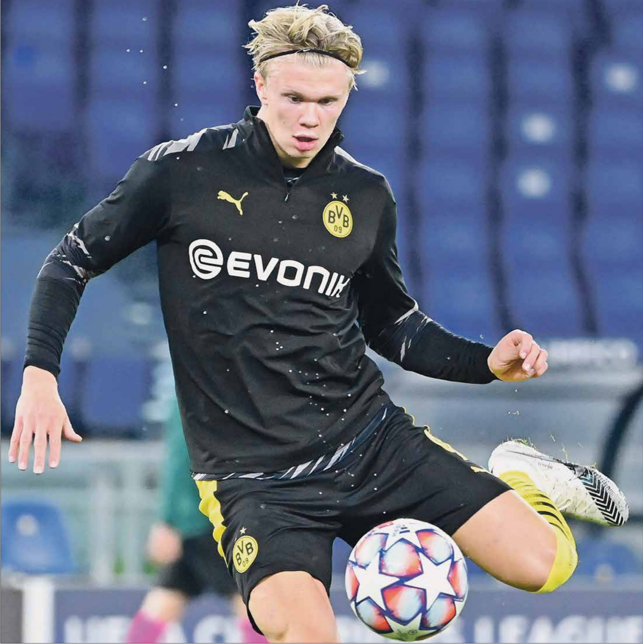
هالاند حقق رقما قياسيا وتجاوز رقم واينرون التاريخي بـ154 نقطة

اللاعب الشاب إريك هالاند، خطف الأضواء باهدافه العظيمة، وهذه المرة عندما رحل فريقه بروسيا دورتموند الألماني إلى بلجيكا لمواجهة نادي كلوب بروج. وبعد تسجيله لهدفين في هذه المباراة، أصبح إيرلينغ هالاند أول لاعب في التاريخ يسجل 14 هدفا في أول 11 مباراة له في مسابقة دوري أبطال أوروبا، وفقا لموقع «سات فوت» المتخصص في الأرقام والإحصائيات وكان هالاند قد بدأ مشواره في أعرق المسابقات الأوروبية الموسم الماضي بقميص فريقه السابق ريد بول سالزبورغ النمساوي، قبل أن ينتقل بعد نصف موسم إلى بروسيا دورتموند، الذي أقصم من الدور الـ(16) امام باريس سان جيرمان الفرنسي، رغم تألق هالاند خاصة في مواجهة الشباب للفريق وخط الدفاع وقال سكولز في تصريحات نقلتها صحيفة (ذا صن) البريطانية: «هذا الهدف (الذي سجله) لي يعيدني إلى سؤء دوريي (با) يعود سببه بالكامل إلى سوء التخطيط. إنهم مثل فريق كرة قدم تحت