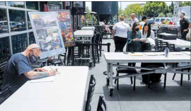
تدريب طلاب للوظائف في كاليفورنيا