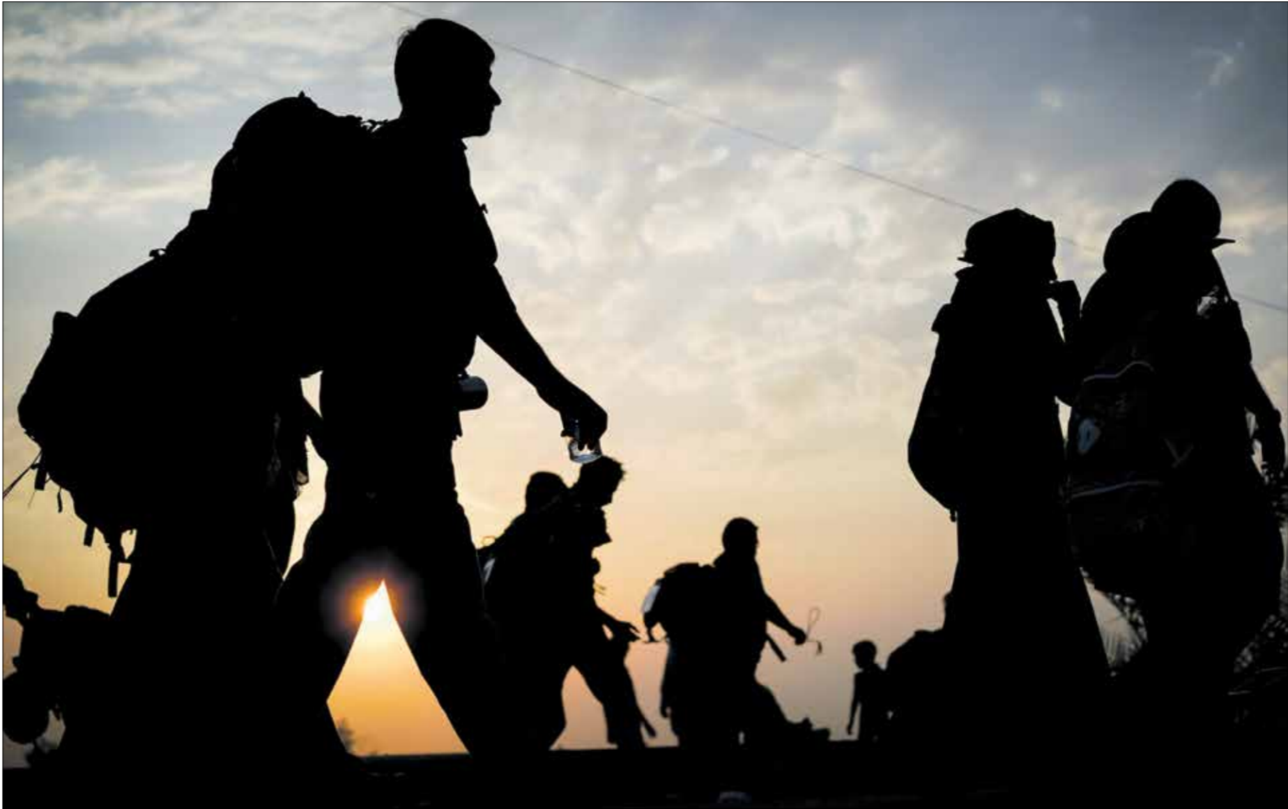
لتربية الحوزء الأخيرة