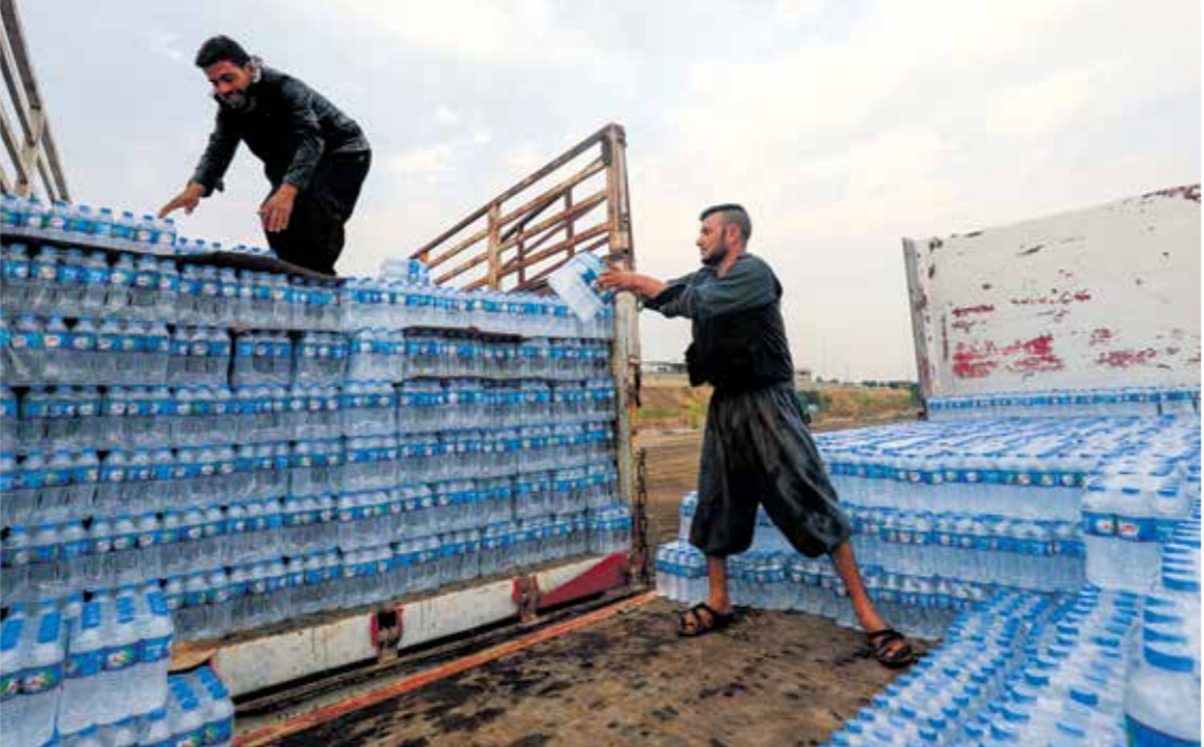
توصير الكهريا، يعط باسعار المياه فيه هناك شرق سورية (فخراس لبن)

وأكد المدير العام للكهرباء في إقليم الجزيرة شرقي سورية، أنه إذا ما تم فتح أكبر للسود التركية ووصلت المياه بشكل جيد إلى السودان السورية عبر نهر الفرات، فإن واقع الكهرباء سيتحسن بشكل كبير في المناطق الواقعة شمال