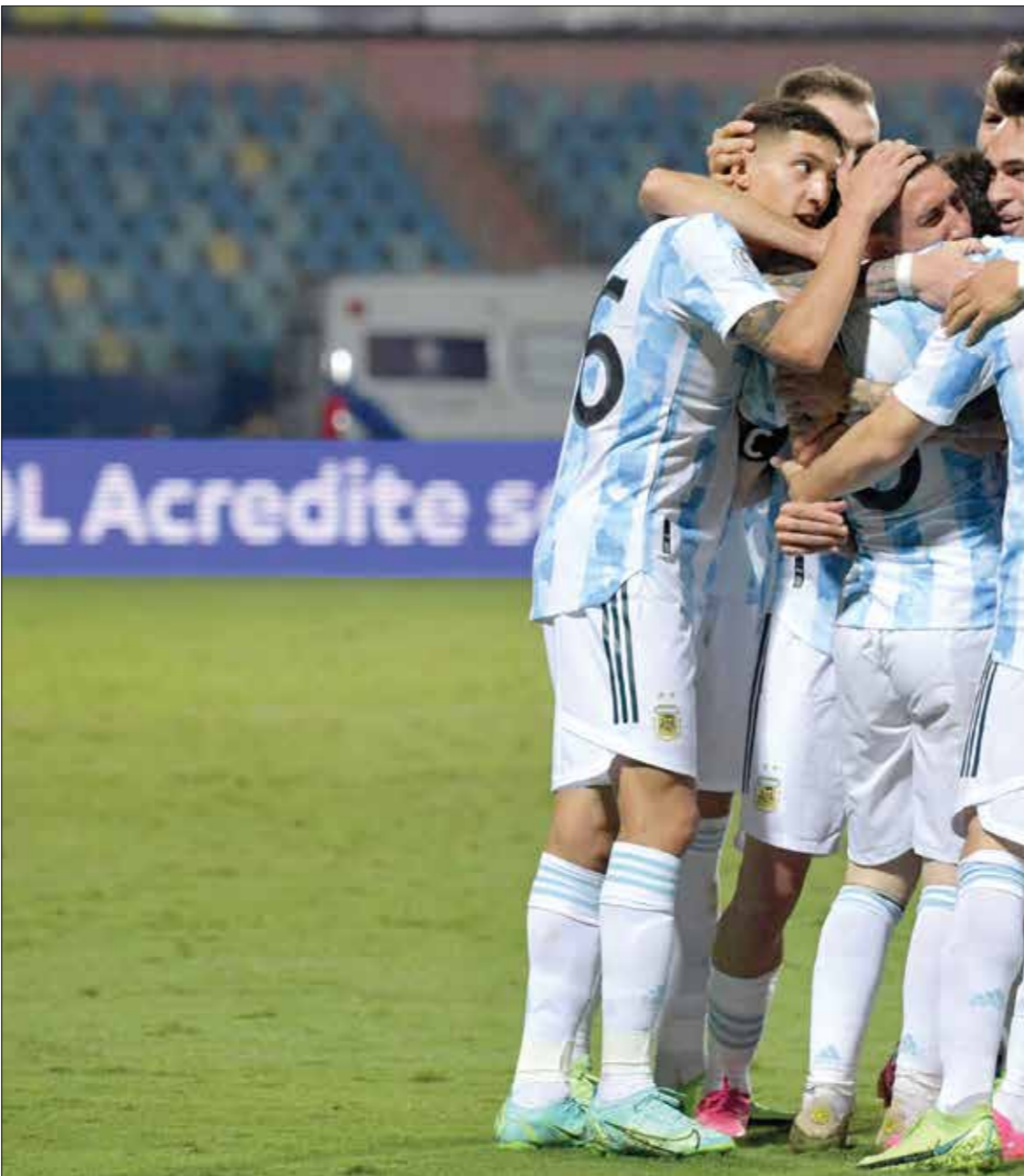
الرجنتن لواجه كولومبيا في نصف النهائي وأعلن على الملأ

وستكون المواجهة بين منتخبي الأرجنتين وكولومبيا قوية جداً في الدور نصف النهائي، وستكون مواجهة خاصة بين النجم، ليونيل ميسي، والحارس الكولومبي، ديفيد أوسبيننا. كذلك يتعين على نخبة اتلائقنا الإيطالي، دوفان ديفيد أوسبيننا، قال في المؤتمر الصحافي بعد المباراة التي قدمها الحارس بلدن، بلد تزيده أن يعمّ فيه السلام، ويكون سنوات من الغياب عن هذه المواجهة.