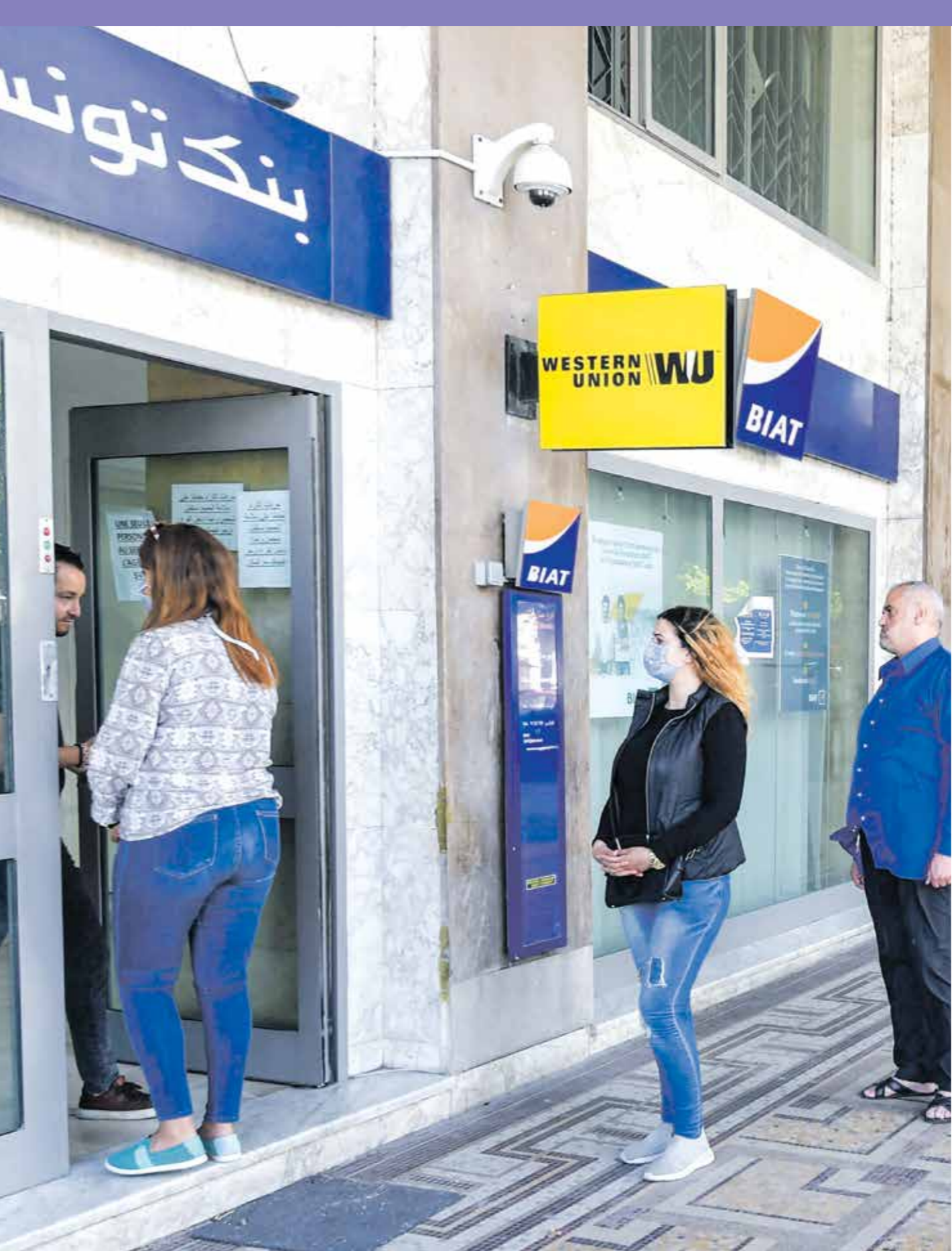
ابوك تحفك، ارتاحا رغم الظروف الاقتصادية الصعبة (تحفك)باصيد،فخراس (لبن)

وأضاف: يائني ذلك يجانب أن البنوك السودانية أيضا لم تكن مهيةة لاستقبال الأموال من الخارج، وحتى هذه اللحظة هناك إجراءات لفتح حسابات مصرفية بالعملة الحرة غير متوافرة لكثير من المصارف السودانية، ما يعنى أن الظرفة السابقة لا تزال مغلقة في السوق السوداء التي ما زالت تستقبل أموال المخرين حيث أعلنت الدولة عن 24 حافزا للمغتربين، ولكنها تناست الطرق التي يعكن بها جذب تلك المخرات أو حتى تحويلات الموظفين في الداخل التي تتم عبر طرق متعددة خارج نطاق النظام المصرفي. وعلت السوق الموازية لشهور في ترقب لسياسة تحرير سعر الصرف وضعرفة الإجراءات المخيلة من الحكومة، خاصة ن