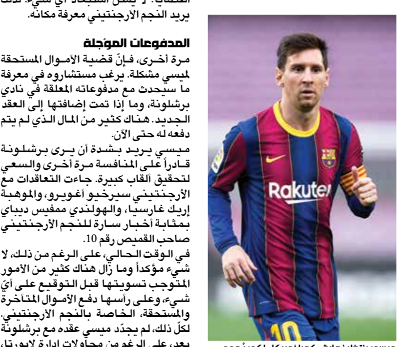
ميسي ينظر نهاية «كوبا اميركا، لكي يجدد عقده

يريد ميسي أن تكون الشؤون الضريبية واضحة ومحددة تماماً، إذ هناك بعض التغييرات المستمرة التي قد تؤثر على