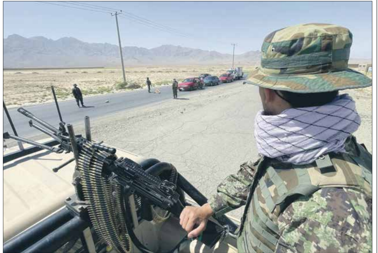
الجنرال ينعاهو نام لدعم «طالبان» (الآنكون)

وبعد السلطات حائرة في التعامل مع تقدم الحركة، فاصدرت وزارة الداخلية بياناً، مساء أول من أمس السبت، قالت فيه إن «الهرزائم مؤقتة»، لكنها لم تشرح كيفية استعادتها وكيفية إيقاف الزحف، خصوصاً إذا توجه عناصر الحركة إلى العاصمة كابول، مع إتمام انسحاب الأميركي والأجنبي بالكامل، في أغسطس/ آب المقبل، حسبما أعلنت الإدارة الأمريكية، من جهته، أكد المتحدث باسم «طالبان»، ذبيح الله مجاهد، سقوط مناطق عديدة من أفغانستان، مؤكداً شيرا إلى أن معظمه حصل بالمصدر، فإن المقاطعات هي بانجواي في قندهار، وزيروك في باكتيا، وكوفاب