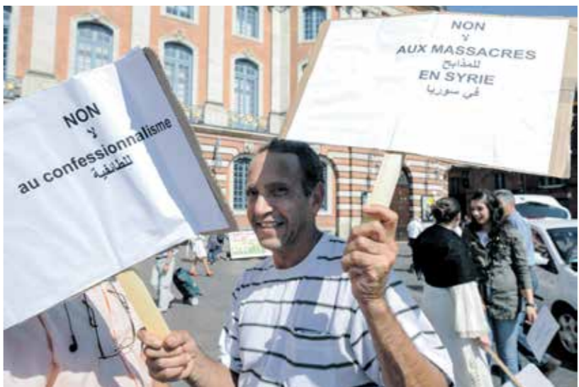
إلى الطائفية، هي سورية، شعار مظاهر داعم للثورة السورية في لتونر، جنوب فرنسا، يوليو 2011 (رسم: خالد المران/سبوتنيك)

المسيحي والشيعي والسني والأيزدي والكرد وكلم مسؤولين شركاء في الدولة العراقية المقارنات، ولم تكن مشكلة الوحدة المدنية، في العراق سوى في استبداديه العسكرية، وليس في علمانيته التي رفعت المجتمع العراقي، لتعليماته وتحموها، إلى صدارة كل الدول العربية. على الرغم من ظروف الحروب والحصار التي عاشها العراق، مغاربة بحالة التخلف والفوضى الراهنة عرافيا بفعل الطائفة السياسية الحاكمة برداء الديمقراطية المحترقة والصورية.