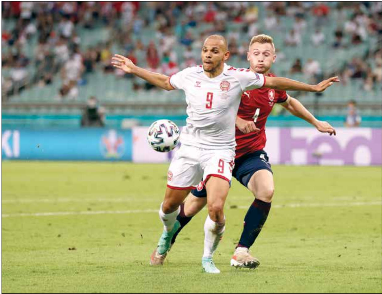
سيطر منتخب الدنمارك على المواجهة ضد التشيك