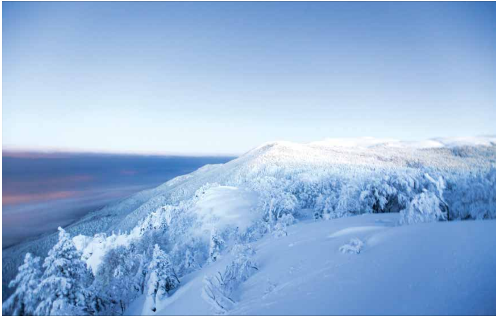
ترتفع الجبال في منطقة اولوداغ حوالي 2000 متر عن سطح البحر

في ظل ارتفاع درجات الحرارة يهرب الكثيرون إلى تركيا، حيث الخيارات كثيرة في مرتفعاتها للحصول على هواء بارد، والتمتع بالجبال الثلجية وفنادقها المخدمة