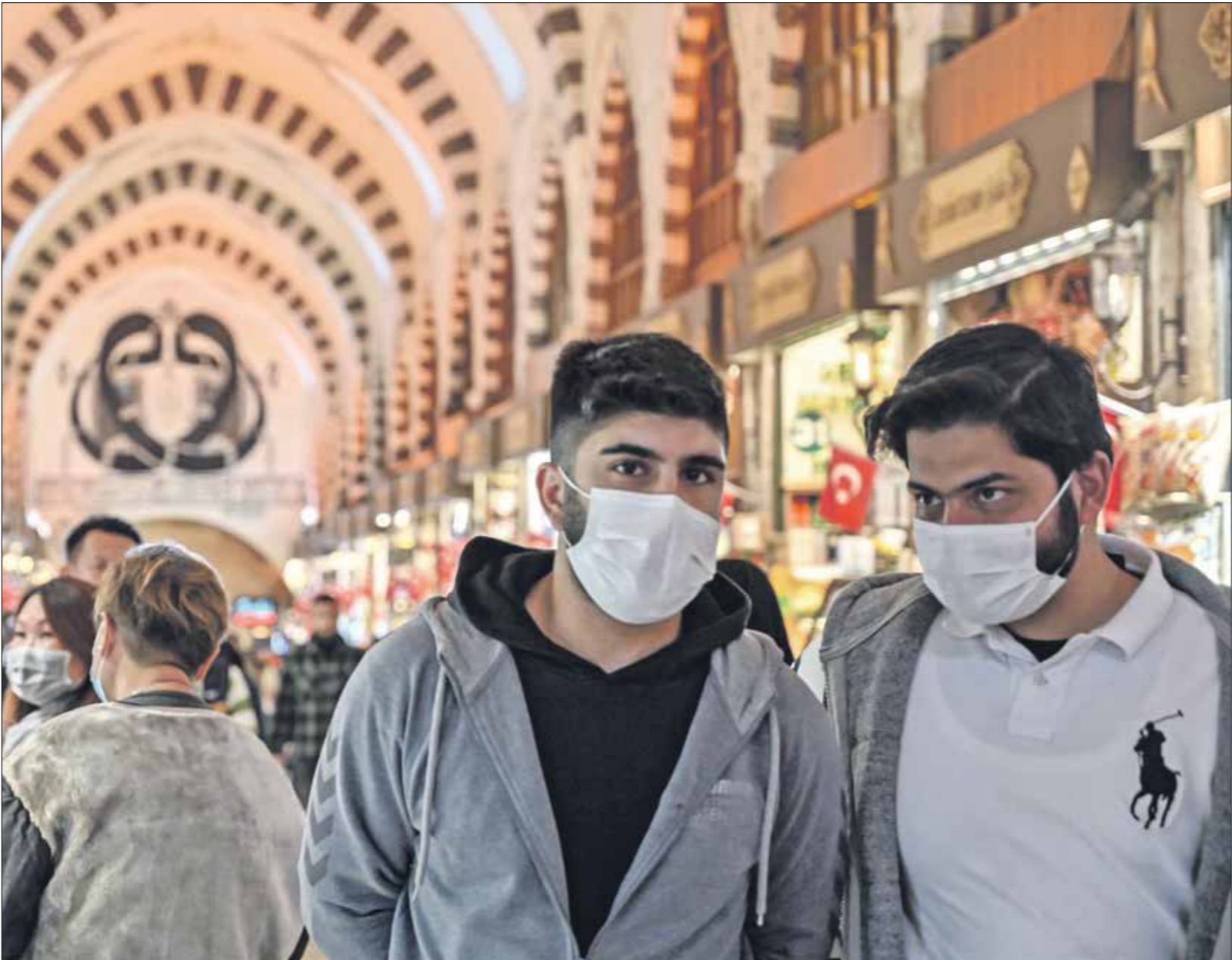
أولاد كوربي، فرانس كورس

وكانت ليبيا تدعم الفلاحين بـ 6 ملايين دينار ليبي، حسب تقارير رسمية، لكن بعد إجراءات التقشف التي أعلن عنها مصرف ليبيا المركزي عام 2015، توقف الدعم للمزارعين من الألاف والسماد واليوريا (سماد ضوئي). كما توقف شراء إنتاجهم من محصول الشعير والفحم، وترك التسويق للعرض والطلب في السوق المحلي.