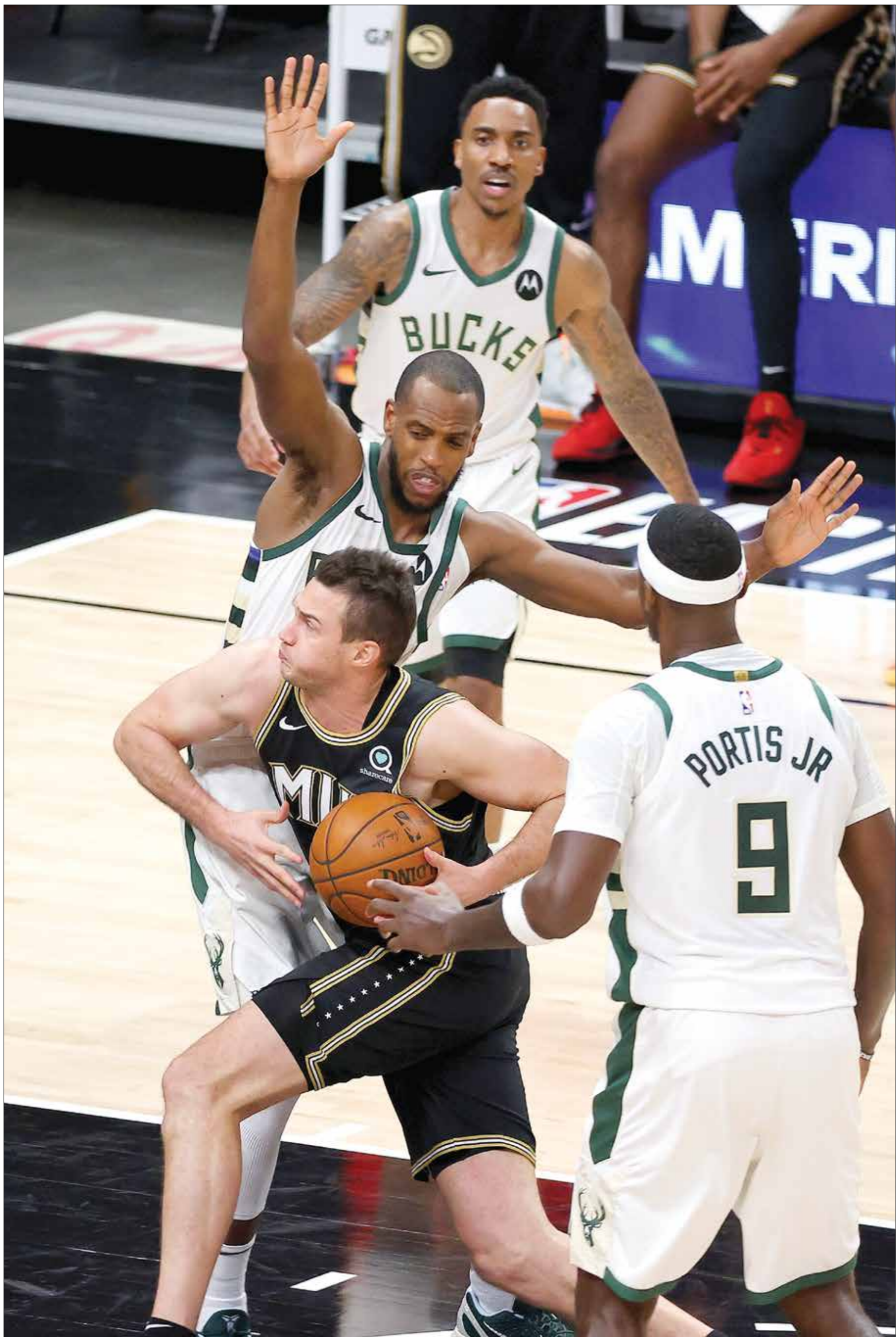
ميلووكي باكس يزيّد المنافسة على اللقب هذا الموسم