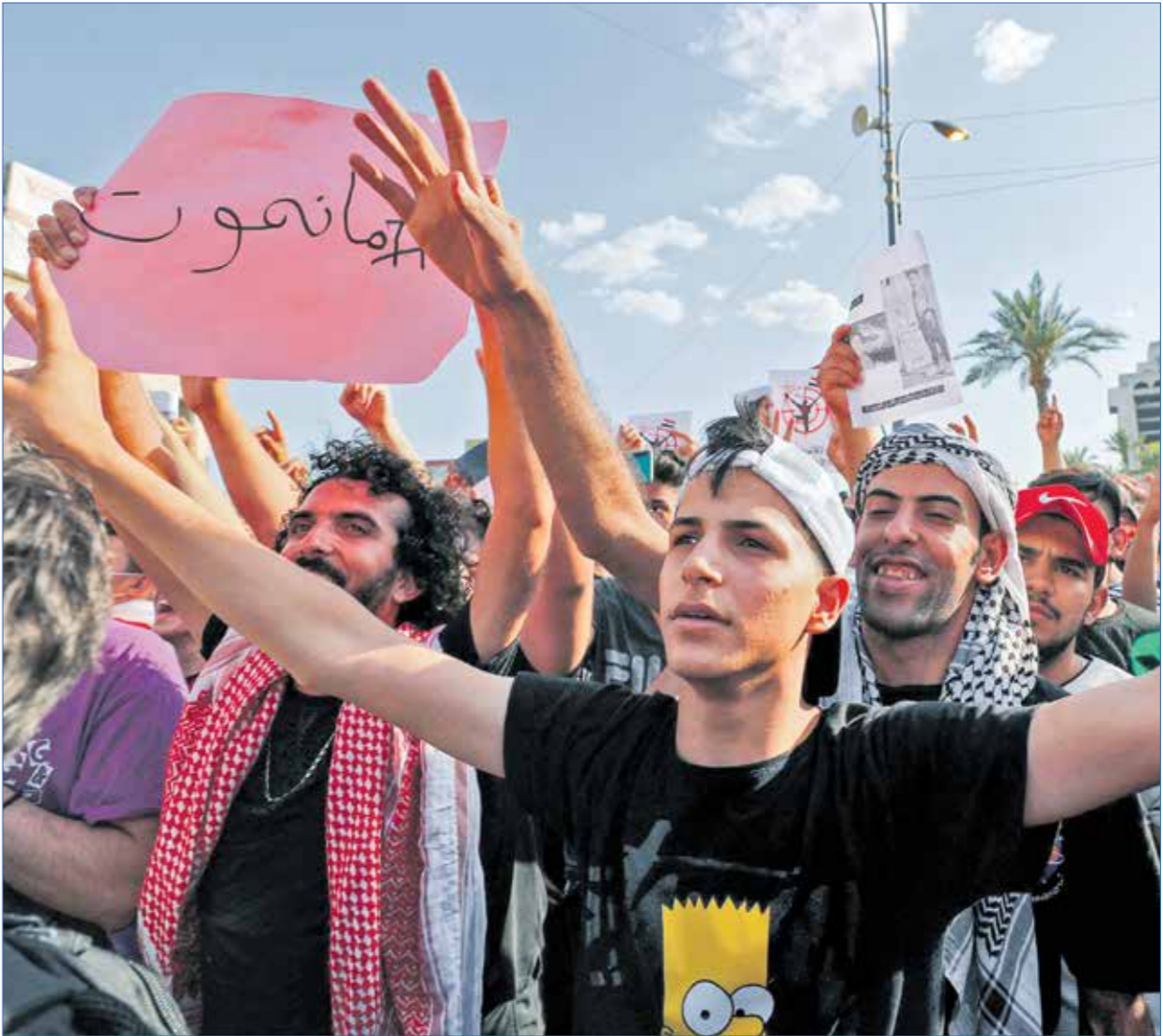
من تظاهرات بعد سلسلة اعتيالات طاولت ناشطة (بحد اليمين)عزراش برس)

بالتزامن مع تهديدات فصائلية، عادت قوى سياسية عراقية لإثارة ملف وجود القوات الأميركية في العراق، متعهدة بالضغط من أجل إخراجها