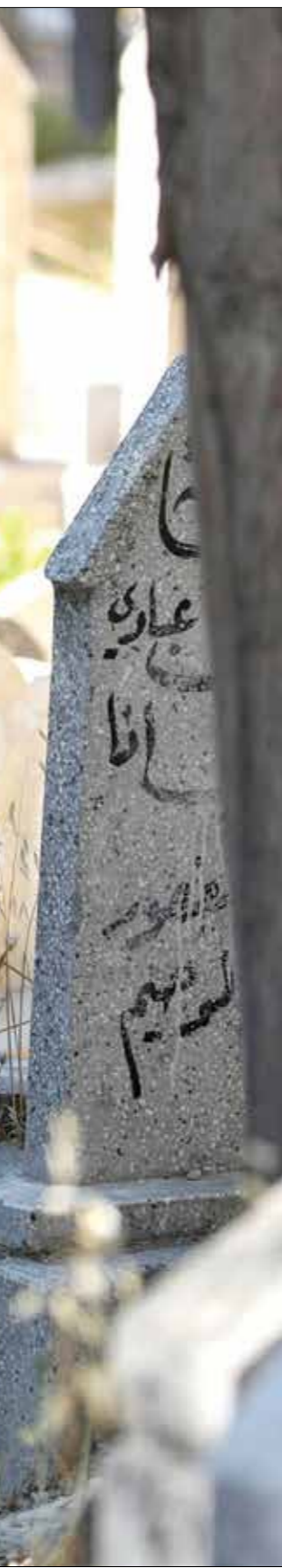
نعتاً من أجداد مدفن لفرضهما النازح في ادلب

يقول زكريا الذي فضّل عدم الكشف عن هويته لـ«العربي الجديد»: «في قريةنا قرب سراقب، كانت لدينا مقبرة يُدفن فيها جميع أفراد عائلتنا عندما يتوفون. لذلك كانت وصية والدي أن يُدفن في تلك المقبرة، لكننا لم نتمكن من تنفيذ وصيته»، ويخيل موعد الدفن، كما شقيق زكريا يرتكب حافة من خلال ثقل جثة والده إلى سراقب وتسليم نفسه للنظام السوري. هو لم يكن يعي خطورة الموقف، وكلّ ما أراد هو تنفيذ وصية والده. لكنّ ثمة أقارب