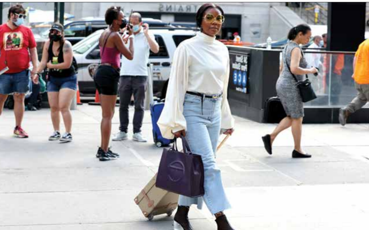
قصة الجينز الضيّقة من العالم والتي تتسع تدريجياً إلى الأسفل هي من الصيحات الراجة

عصّر ترجمته المخرج على خشبة الرحك، فقصداً في اللغة، فإنتاجاً باب الدخول إلى أوجاع البشرية، رغم حضور الكوميديا، التي كانت في تجلياتها السوداء، خاصة مع تنوب خلاف بين قبيلتين في الجاهلية، لأن منتخماً إلى إحداها وضع «علامة جام» لإحدى فتيات القبيلة الأخرى. كل هذا اختزله الشعافي بتكثيف الإبحاءات والرموز، كأنها مغامرة إخراجية لشذرات متنوعة في هذا الطراز، أن الإرسال يؤكّد الشعافي، في هذا الإطران، أن «مسرح النبطية المُستنسخ بعضه من بعض لا يُغري إلا المُفكدين، فأقدي الحرة الفنية. أمّا خلط الأنواع، فيستدعي تنكّناً من أدواتها، ووعياً جمالياتها، فلا يُؤكّف مجانياً واعتباطياً.