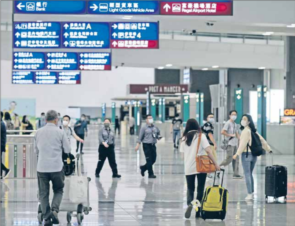
قدمت استراليا وكندا جوائز للأولمبيات بالهجرة