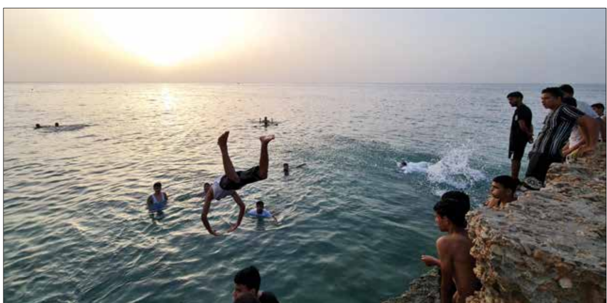
تلوث البحر لا يملهم من الشياحة فيه