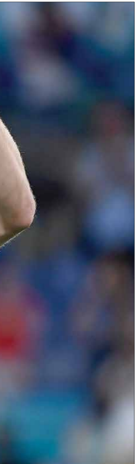
استطاع هاري كين الرد على الانتقادات بأهدافه

انهي منتخب الدنمارك أحلام منافسه منتخب جمهورية التشيك في بطولة امم أوروبا لكرة القدم 2020، بعدما تغلب عليه بهدفين مقابل هدف وحيد، في المواجهة القوية التي جمعت بينهما على ملعب «ياكو الأولي» في العاصمة أترريججان، ضمن منافسات ربع نهائي المسابقة القارية. واستطاع منتخب الدنمارك الوصول إلى نصف نهائي المسابقة القارية للمرة الأولى، منذ عام 1992، حين توج بلقب اليورو. ما سيجعله يواجه منتخب إنكلترا في المربع الذهبي، بعدما قضى «الأسود الثلاثة» منافسهم منتخب أوكرانيا، وقلب منتخب الدنمارك جميع التوقعات، لأن الأرقام كانت تشير إلى تفوق منتخب التشيك، الذي استطاع الفوز في مواجهتين، الأولى كانت في دور المجموعات بهدفين مقابل لا شيء في «يورو 2000»، والثانية في ربع نهائي «يورو 2004»، بنتيجة ثلاثة أهداف نظيفة وأفتتحت الدنمارك التسجيل من أول فرصة سنحت لها، فبعد ركنية تغذها مدافع أودينيزي الإيطالي، بنيس ستروغر لارسن، ارتقى لها توماس ديابلتي وحولها راسية في الشباك عبر الحارس توماس فاشليك عن صدها (5). وهو الهدف السادس في مسيرة لاعب يوروسيا دورتموند الألماني قميص منتخب بلاده، وضاعف المنتخب الدنماركي النتيجة بعد هجمة سريعة على الجهة اليسرى وتمريرة عرضية بالجهة الخارجية لقدم مدافع أتلانتا