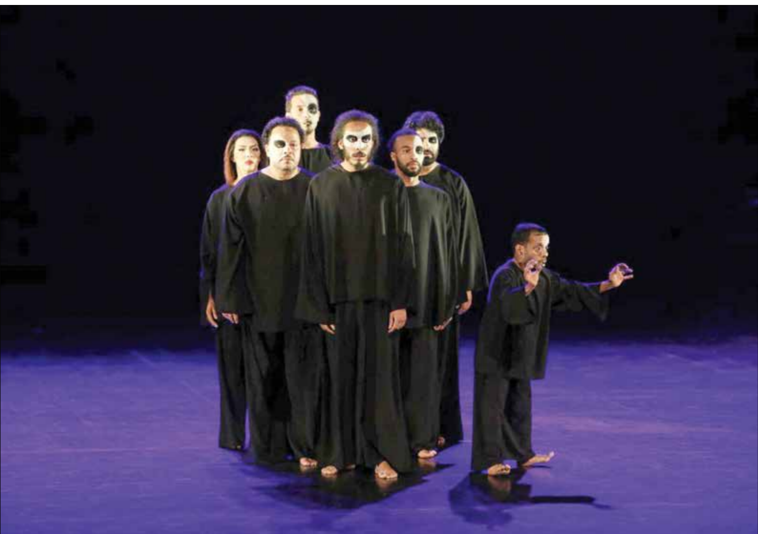
من المسرحية «كابوس أينشتاين»

في كل موسم، يبقى الجينز موجوداً ولا يغيب أبداً ما بين صيحات الموضة الأساسية، في الوقت نفسه، ما يحصل من تغيير أساسي في بنظون الجينز هو تحديداً في القصة التي قد تتغير من موسم إلى آخر. القصة الأكثر رواجاً هي في قصة ال «سليم كات» في هذا الموسم، في هذه الحالة، يحس عون، تكون قصة الجينز ضيقة من الأعلى ثم تتسع من الأسفل.