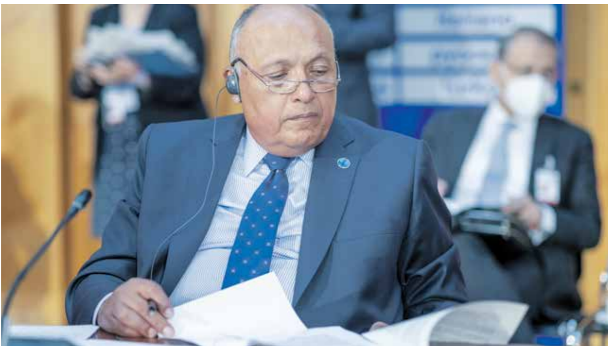
ساهم كبريان النيويوركرى لوكالةي تطورات الاتصالات في اربعة ايام المم المتحدة (فرانس برس)عزراش برس)

ونذرت المصدر أن التحرك المصري والسوداني الذي تؤيده دول عدة في مجلس