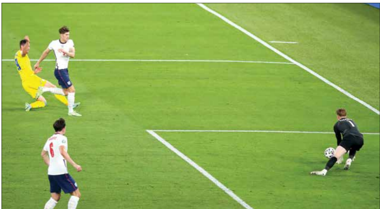
شباك جورداان بيكرودر ما زالت نظيفة