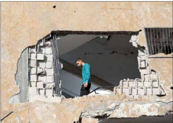
من اثر العدوان الإسرائيلي الأخير على القطاع (محمد الحجاز)