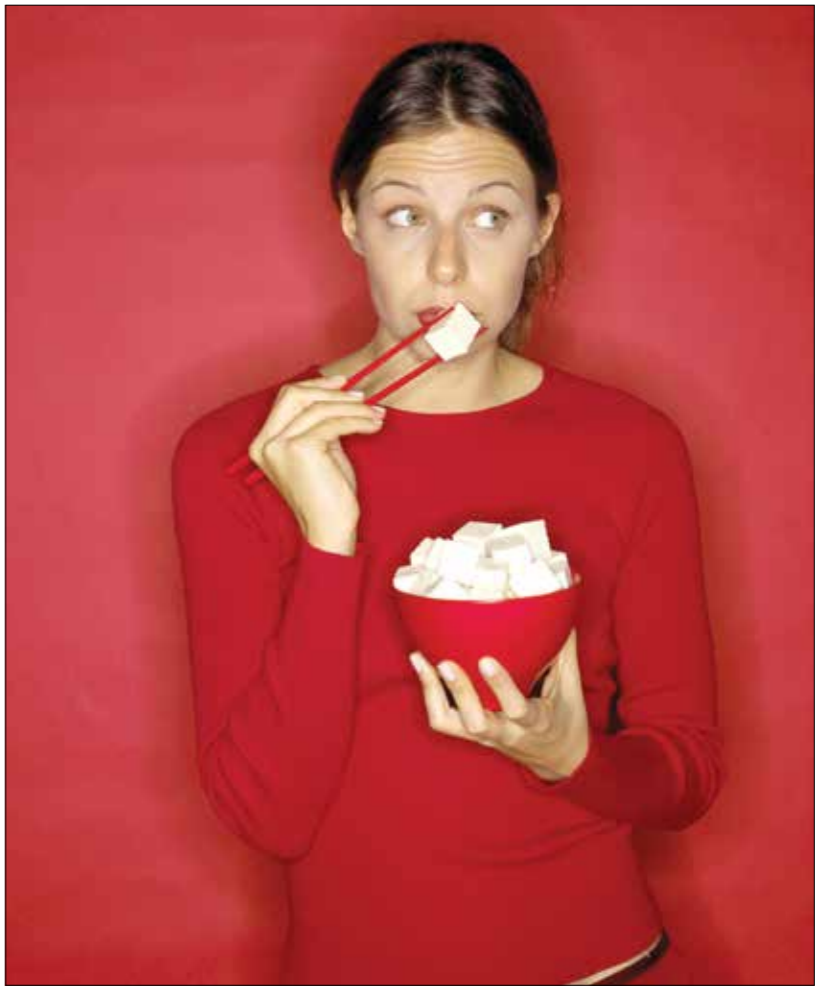
جينة الترموم غيرة البروتين رائد أكس بيكتلتر

الجسم، إضافة إلى غناها بالدهون الأحادية ومجموعة متنوعة من الفيتامينات والمعادن. الكينوا: تتميز الكينوا بغناها بالبروتين، إذ يحتوي كل كوب على 8 غرامات من البروتين، وهو مصدر كبير للبتواسيوم، وهي أحد من الأطعمة النباتية القليلة التي تحتوي على جميع الأحماض الأمينية الأساسية التسعة، كذلك فإنها خالية من الغلوتين، وبالتالي ينصح باستهلاكها كغذاء أساسي بديل من منتجات القمح لمن يعانون من حساسية الغلوتين.