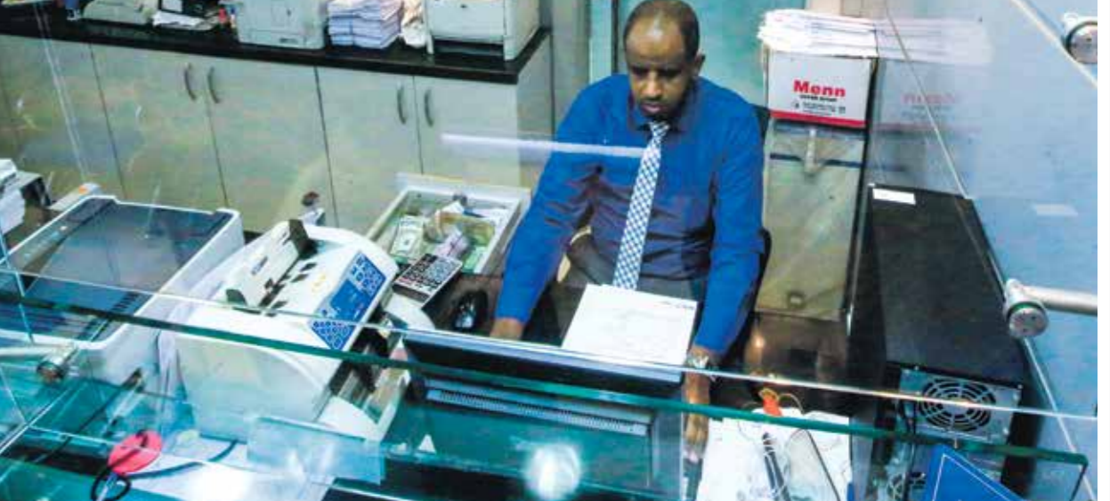
البنوك السودانية تعاني من نقص العملة الشلالي،فخراس (لبن)

وقال إن عقد مزاوات النقد الأجنبي من جانب بنك السودان المركزي خطوة أولى للتدخل،