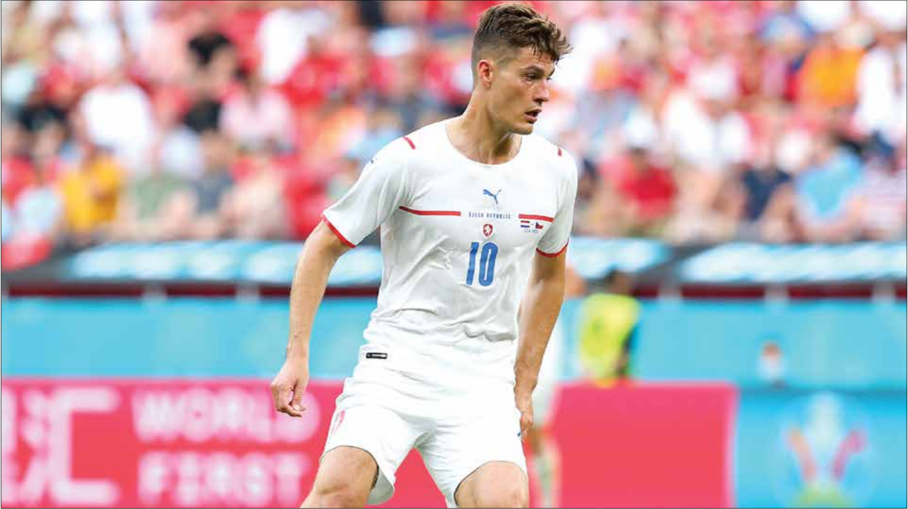
صعد بارنك شيك مهاجم التشيك لتصدرة الهادفين مع رينالدو

لمنتخب إنكلترا في بطولة كبرى (كاس العالم واليورو)، بعدما وصل إلى تسعة أهداف، ليتساوى مع النجم السابق، واين روني صاحب المركز الثاني، خلف غاري لينيكز (10 أهداف)، ليصبح قائد «الأسود الثلاثة» قريباً من تحطيم الرقم القياسي، وأثبت هاري كين، قائد منتخب إنكلترا، أنه قادر على تسجيل الأهداف، كما بدأ مصعماً على إسكات الانتقادات التي وجهت إليه في بداية البطولة، لكن من خلال الملعب وأسام في المسابقة القارية مع «الأسود الثلاثة»، منذ تحدي تشيرينغهام، ضد هولندا في «يورو 1996»، وبات هاري كين ثالث هدف