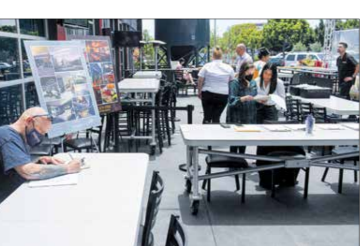
تدريب طلاب للوظائف في كاليفورنيا

لم يشهد كبار الاقتصاديين في البيت الأبيض الذين يتخصصون ببيانات الوظائف خلال الأشهر العديدة الماضية أي تقدم ملموس في هذا المقياس الرئيس للصحة الاقتصادية. مرتفعا معظم هذا العام، لكنه سينخفض حتى بعد تمرير خطة التحفيز التي قدمها الرئيس جو بايدن بقيمة 1,9 تريليون دولار، ظلت النسبة المثوية للوظائف الأميركيين الأصغر سناً، سواء الذين وظّفوا، أو الذين هم في سنهم المتقدمين الاقتصادي. وأرقام الوظائف الهزيلة، واختناقات سلسلة التوريد، ونقص السلع، وانفجار الدين العام تهدد الرفاهية الاقتصادية للبلاد، التي تشهد التدهور، هاجم النقاد، بمن فيهم زملاء سابقون للعدد من المسؤولين الديمقراطيين البارزين، حذم ونطاق خطة الإنفاق في البيت الأبيض على أنها تدير وغير فعالة.