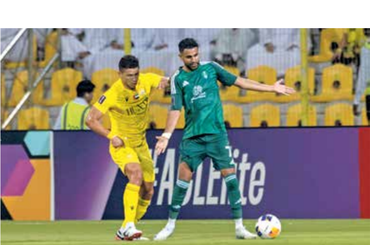
للمح محرز الانتقادات حادة منذ بداية الموسم الحالي

وستنطلق المواجهات في تمام الساعة الخامسة مساء بتوقيت القدس المحتلة، بين نادي الوصل الإماراتي، وضيفه فريق السد القطري، على استاد زعبيل في مدينة دبي، إذ يامل «الزعيم» في مواصلة نتائجه الجيدة، خلال الموسم الحالي من دوري