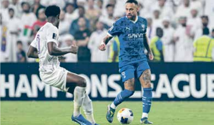
يردد الهلال المتنافسة على لقب المسابقة القارية (التاتلون)

في الوقت نفسه، تتجه انظار الجماهير الرياضية إلى ملعب الجوهرة المشعة في مدينة جدة، من أجل متابعة القعة العربية، التي ستجمع بين نادي الأهلي السعودي وضيفه، فريق الشرطة العراقي، الذي جمع حتراتي الآن لتفقتن فقط، بعد تعادله في مبارياتين، وتعرضه لخسارة وحيدة في المسابقة القارية. وعلى عكس نتائجه في الدوري السعودي، فإن فريق الأهلي، يُعد أحد أبرز الأندية المشاركة في بطولة دوري أبطال آسيا للنخبة، بعدما حصد العلامة الكاملة، تسع نقاط، عقب فوزه في ثلاث مواجهات متتالية، ويحل في المركز الثاني