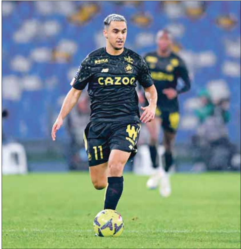
وناس اللع إلى ليل الفرنسي صيف عام 2022