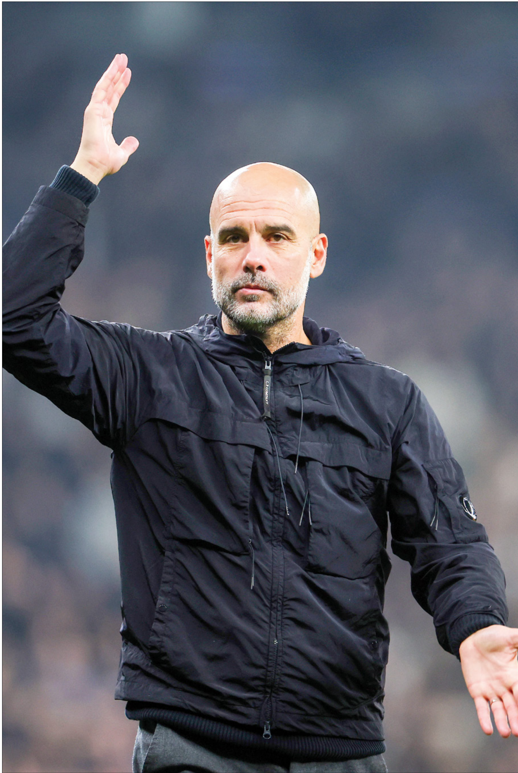
يرفض غوارديولا الحديث عن مستقبله مع مانشستر سيتي

تريد إدارة نادي مانشستر سيتي إيجاد بديل للمدرب بيب غوارديولا، الذي ينتهي عقده في صيف 2025. ووقع اختيار مانشستر سيتي على تشابي الونسو المدير الفني لفريق باير ليفركوزن الألماني، حتى يكون بديلاً لبيب غوارديولا في الموسم القادم، وفق ما ذكرته صحيفة آس الإسبانية.