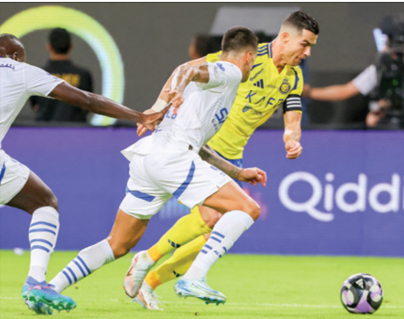
رونالدو حادو قيادة النصر إلى الفوز على الهلال، الأحد 3 نوفمبر 2024

وتعرض ميتروفيتش لاحتكاك من حارس النصر بينتو قبل نهاية اللقاء بخمس دقائق، وقال عنه جمال الشريف: «كرة عرضية داخل منطقة جزاء النصر، تحرك لها بينتو باتجاه مسار الكرة، وكذلك ميتروفيتش، الذي ارتقى وتمس الكرة بحجاب رأسه». قبل أن تصدم بحافته اليسرى، وفي تلك اللحظة، واصل اللاعبان حركتهما إلى الأمام». وتابع أيضا: «بد حارس مرمى النصر ذهبت أولاً إلى راس كتف مهاجم الهلال، ولم تذهب إلى رأسه، ولكن مع الحركة المتعاكسة للحارس والمهاجم، انزعت اليد ولمس الرأس، وبالتالي لا توجد مخالفة على الحارس، وقرار الحكم صحيح باستمرار اللعبة».