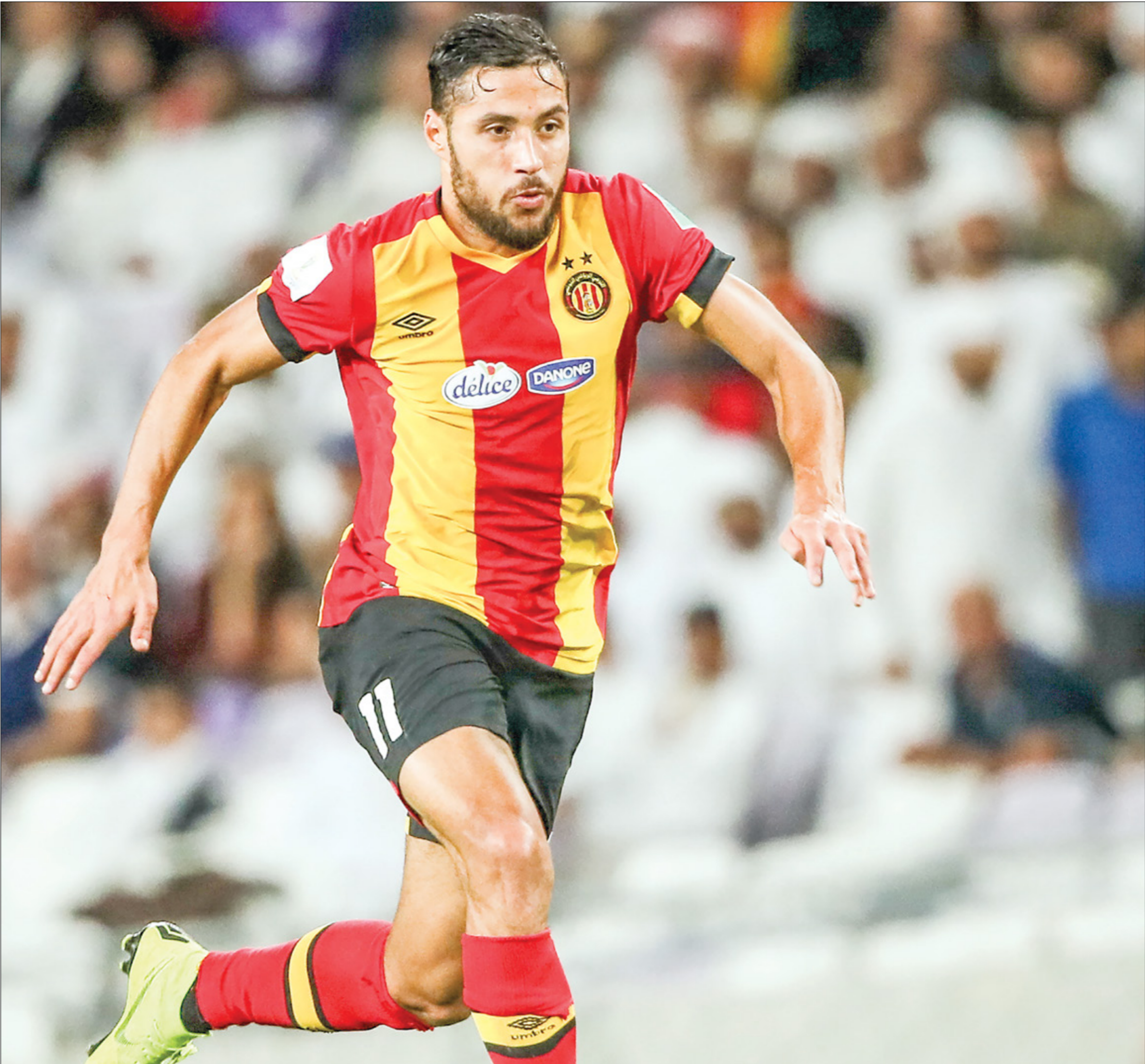
الالعب نجم الترجى الهول (تاليف) شاون/يوتي

وتعرف لغاء النجم والترجى، بالاجواء الحماسية التي ترافقه، بحكم التنافس العاداً من لاعبيه المميزين، وخصوصاً هدّافه