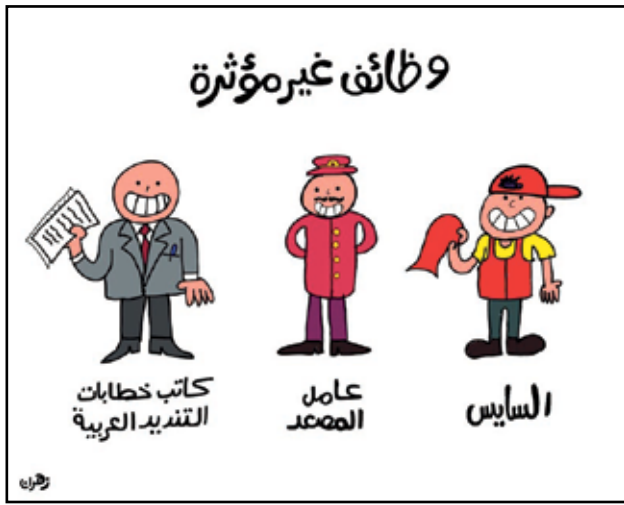
خطابات التنديد ووظيفة لم تعد مؤثرة (زهراء، المنصة)