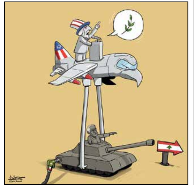
الرعاية الأميركية للغزو الإسرائيلي للبنان (كحلح شرف، اكس)