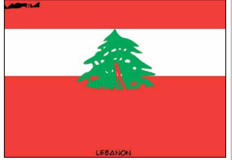
أرزة غرقت بالدماء (موريم من البرازيل، كار تون موفمنت)