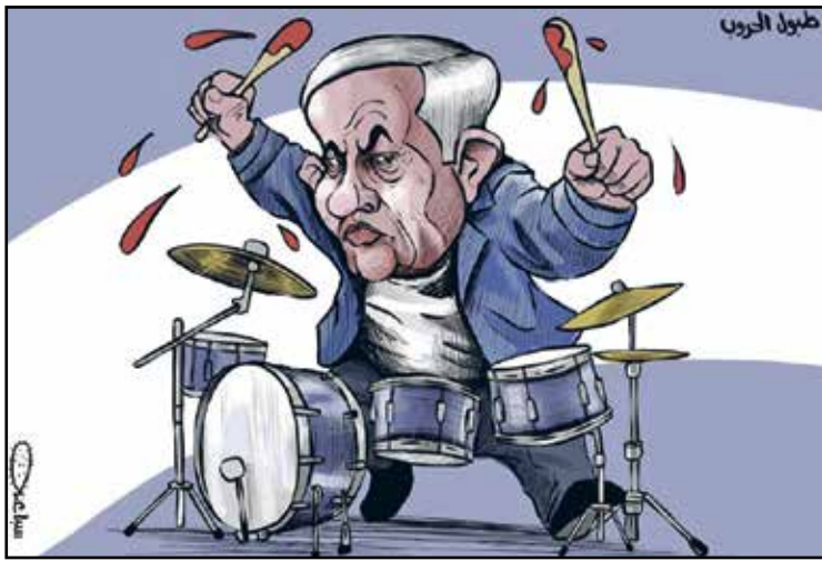
نتنياهو عازف طبول الحرب (محمد سباعنة، فيسبوك)