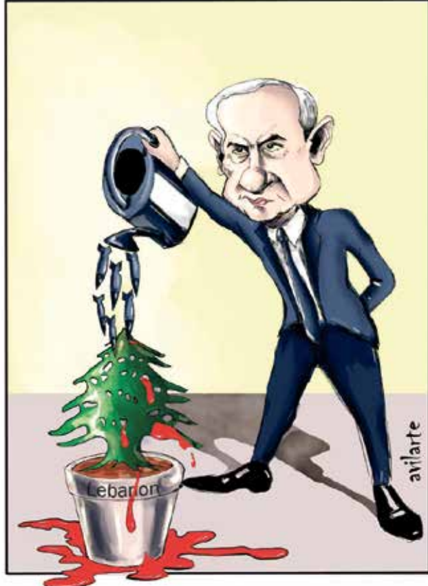
نتنياهو يسقي الأرز الفنائب والدماء (خوسيه أفيلا من كوبا، كار تون موفمنت)

تفاعل العديد من رسامي الكاريكاتير حول العالم مع الأحداث العاصفة في لبنان، وإن كان كثيرون منهم يبدون تعاطفاً واضحاً مع الرواية الإسرائيلية ويبررون الوحشية والضرب الاستباقي، فلم تخل الساحة أيضاً من عدة رسامين معروفين انحازوا للبنان وأدانوا العدوان عليه، من المهم أن نتطالع أعمالهم ونعرف أسماءهم. هنا باقة من الرسومات التي جسدت معاناة لبنان وأدانت العدوان.