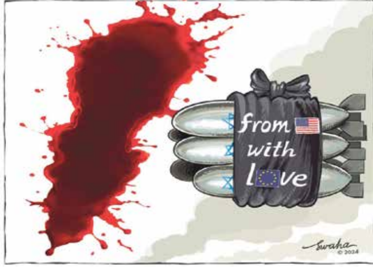
لبنان يقصف بفنائب أميركية وأوروبية (سواها من فرنسا، كار تون موفمنت)

جاءته قهقهة حليفه التي لا تخلو من نغمة تهكمية كعادته: «ولو خبيبي.. أنت حليفنا وحياتك تهمنا حتى الآن». وقد تعمد نتنياهو أن يمتط عبارة «حتى الآن» ليفهم الرئيس منها أن أي تحول عن التطبيع يعني «الانفجار». نام الرئيس في تلك الليلة باستغراق تام بعد تطمينات نتنياهو لكنه لم يستيقظ أبداً، لأن مستشاره اقتحم غرفته وهو يصبح: «الحق يا سيدي.. هناك انفجار.. شعبي».