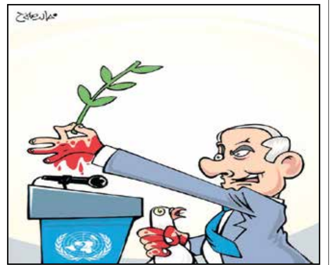
نتنياهو في هيئة الأمم المتحدة (خالد صلاح، المصري اليوم)