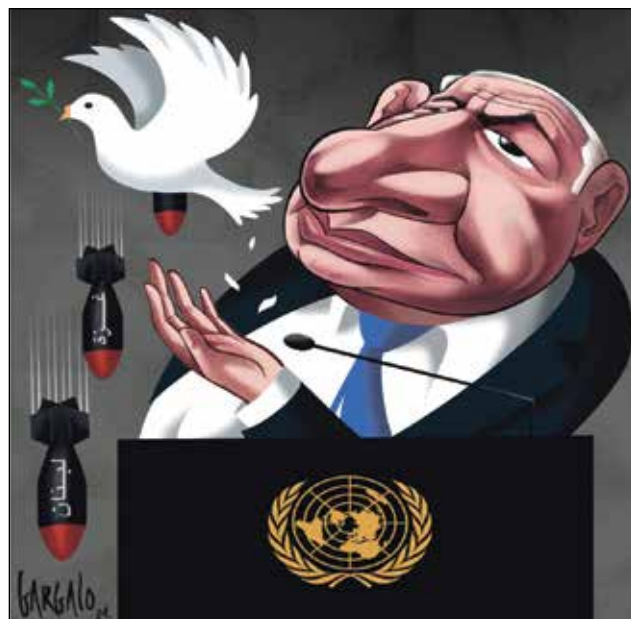
(فاسكو غارغالو، كار تون موفمنت)