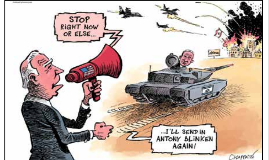
بايدن يقول توقف يا نتنياهو وإلا أرسلت إليك بليكنة! (بارتريك شايات من سويسرا)