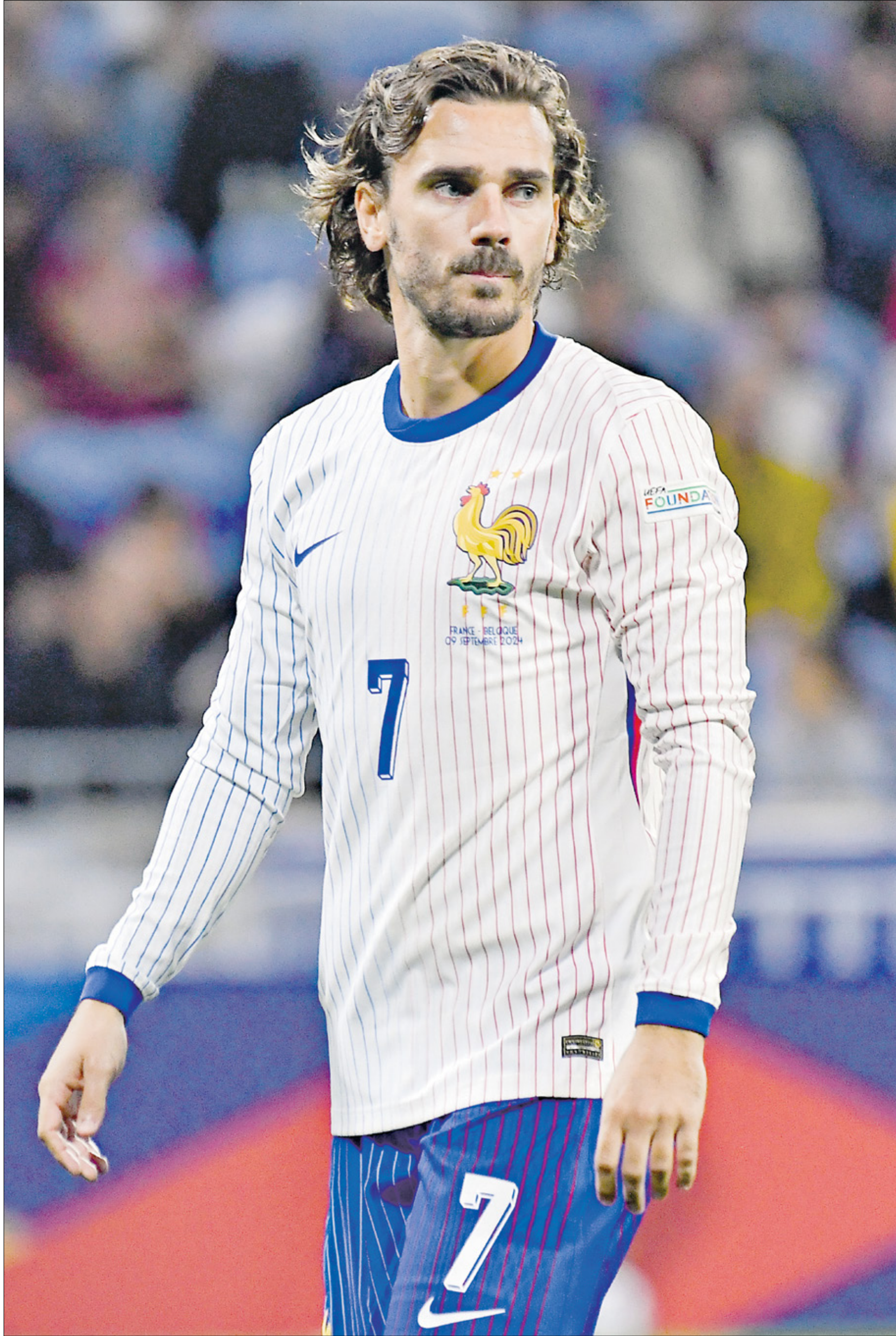
انتوان غريزمان احد ابرز نجوم منتخب فرنسا في الفترة الاخيرة

اعلن انتوان غريزمان، مهاجم اتليتيكو مدريد، بتأثر شديد، اعتزاله اللعب الدولي مع منتخب فرنسا، الذي توجّج معه بطلا للعالم في مونديال روسيا 2018، وقال غريزمان (33 سنة): «بعنوان مليء بالذكريات، اعلن اعتزالي كلاعب في منتخب فرنسا. بعد عشر سنوات مذهلة، تميزت بالتحديات والنجاحات واللحظات التي لا تنسى، حان الوقت لطبي الصفحة وإفساح المجال للجيك الجديد».