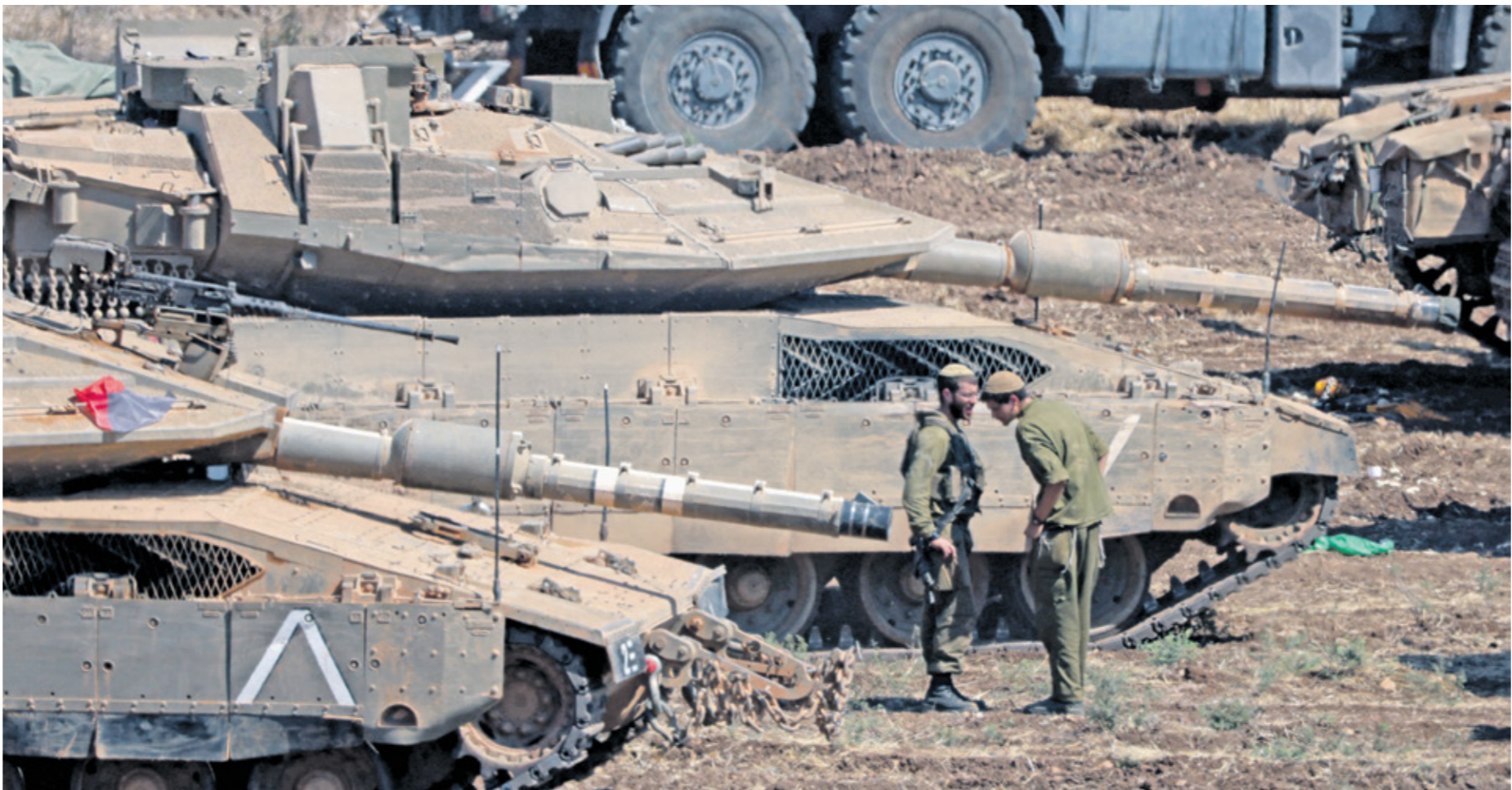
جنديان إسرائيليان يتحدثان مع جنديتين شامك إسرائيل أمس

الضيف (القائد العسكري لكتائبالقاسم»، وأسألوا نصر الله،» وهدد بأنه «لا مكان في الشرق الأوسط لا يمكن أن تحصل إسرائيل إليه». بادعاء الدفاع عن شعبنا وولتنا» وتابع أن «النظام يفرمك إلى الهاوية في أي لحظة، والنظام لا يابه بذلك، ولو كان يابه لما بذر مليارات الدولارات في أنحاء الشرق الأوسط بدون فائدة». واعتبر أن «النظام بذر أمولا هائلة على سلاح نووي وحروب»، و«الصفأة لادمك في إيران لا يتعمون بمستقلكم»، وأضاف أنه «عندما تكون إيران حرة أخيرا، وهذا سيكون أقرب بكثير مما يعتقد الناس، سيكون كل شيء مختلفا، وشعبانا القديمان اليهودي والفارسي، سيكونان أخيرا في سلام، وولفانا، إسرائيل وإيران، ستكونان في حكم. وعندما يأتي ذلك اليوم، ستفك شعبة الإرهاب التي بناها النظام في خمس قارات، وإيران التي مباشر، ملعلا لم تزد من قبل،» وواصل نتانياهو تحريضه على النظام، مطالبا إسرائيل ب«الأيسمحا لمجموعة صغيرة بأن تحطم