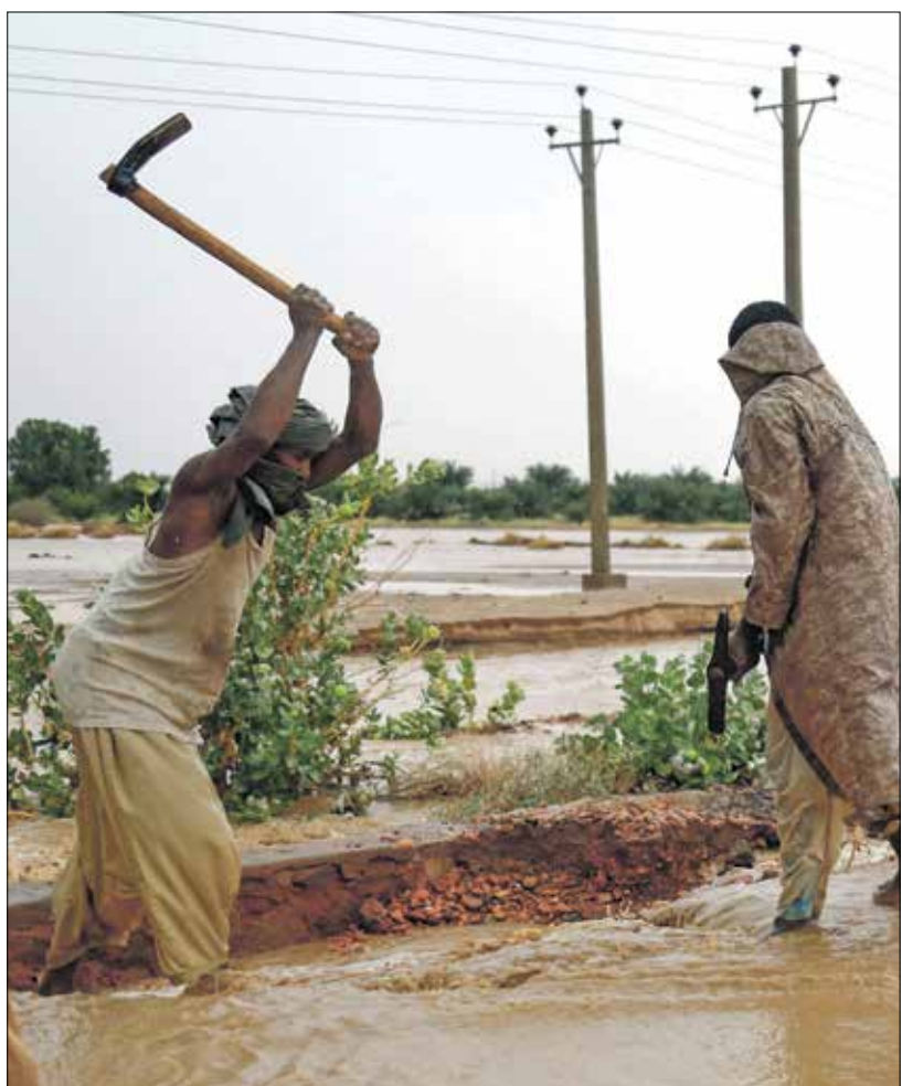
في أم حرمان

في ولاية كسلا شرق السودان غرقت أخيراً مراكز إيواء النازحين جراء الهطول الغزير للأمطار. وشكل ذلك، بحسب متطوعين إنسانيين، معاناة لا تحتمل أضيفت إلى معاناة الحرب، وأزمات فقدان الأمن الغذائي وشح المياه، وأخرى لا تحصى. وبحسب متطوعين لم تترك الأمطار التي هطلت في شرق السودان ومناطق أخرى مجالاً للراحة أو الأمل، وباتت العائلات المحاطة بالمياه تكافح من أجل البقاء وسط