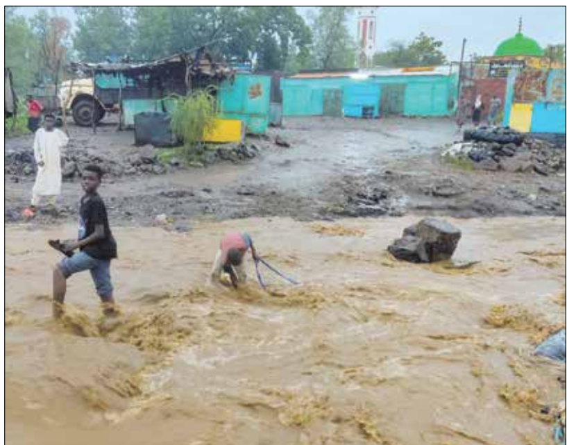
سيول جارفة قرب أماكن الإيواء (فرانس برس)

فيضانات ما بعد الأمطار الغزيرة في القضايف (فرانس برس)