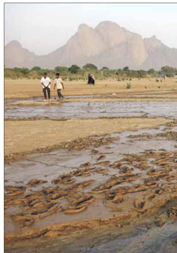
جفاف في الفيضانات