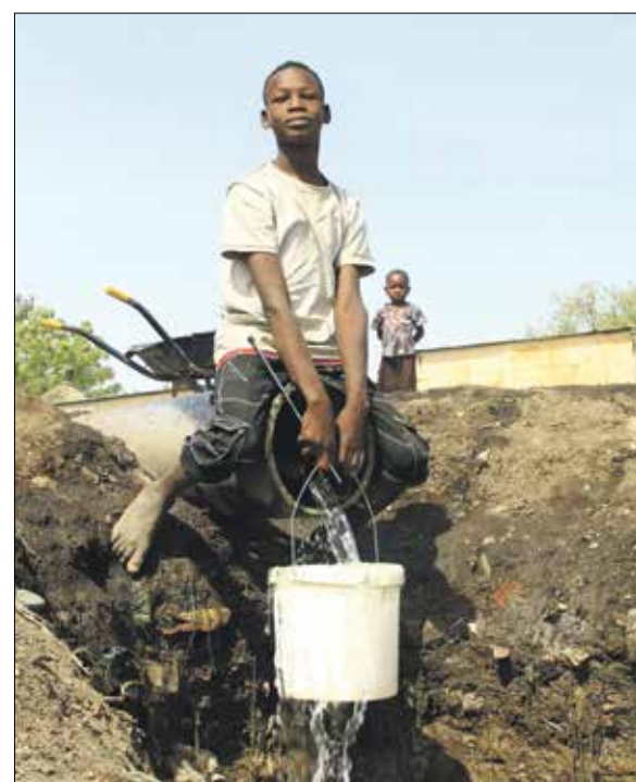
معاناة مع المياه