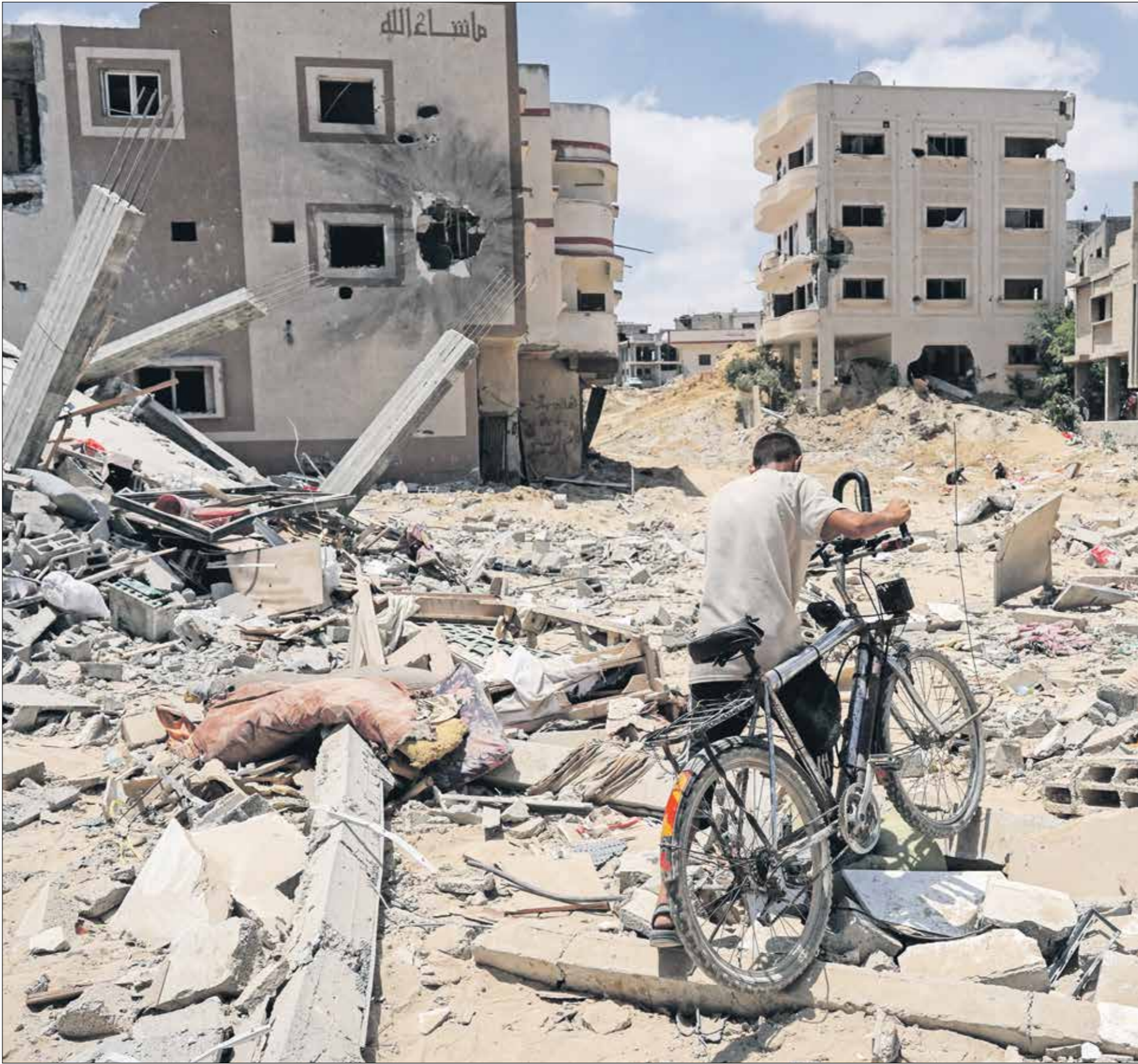
لم يجد غير الدمار (شارع طالب، قرارة، غزة)

وأصبحت المنطقة الشرقية مدينة أشباح بكل معنى الكلمة». تضم المحافظة الشرقية لمدينة خانينوس عدداً من البلدات القرية، إذ تتكون من بلدة بني سهيلا وبلدة عيسان الكبيرة، وكذلك قرية عيسان الصغيرة وبلدة خزاعة وبلدة القرارة الواقعة شرق شمال المنطقة الشرقية وبلدة الفخازي في المنطقة الجنوبية الشرقية. قبل الهجوم الإسرائيلي على مدينة خانينوس في مناطق وسط المدينة وأجزاء المناطق الشرقية بالكامل في 22 في يوليو/ تموز الماضي، كانت تقدر نسب التدمير في المنطقة الشرقية بحوالي 60%.