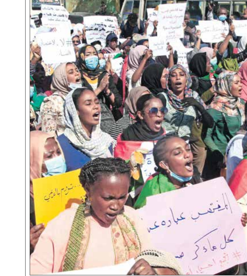
يركب طرفاً الصراع في السودان انتهاكات جسيمة

وجود عدد قليل من الخراف التي كانت تلبه عن هوم الحرب والغروف المعيشية ممن وجدوا في المنزل رغم تزوجهم المتكرر. علماً أنه باع الكثير منها.