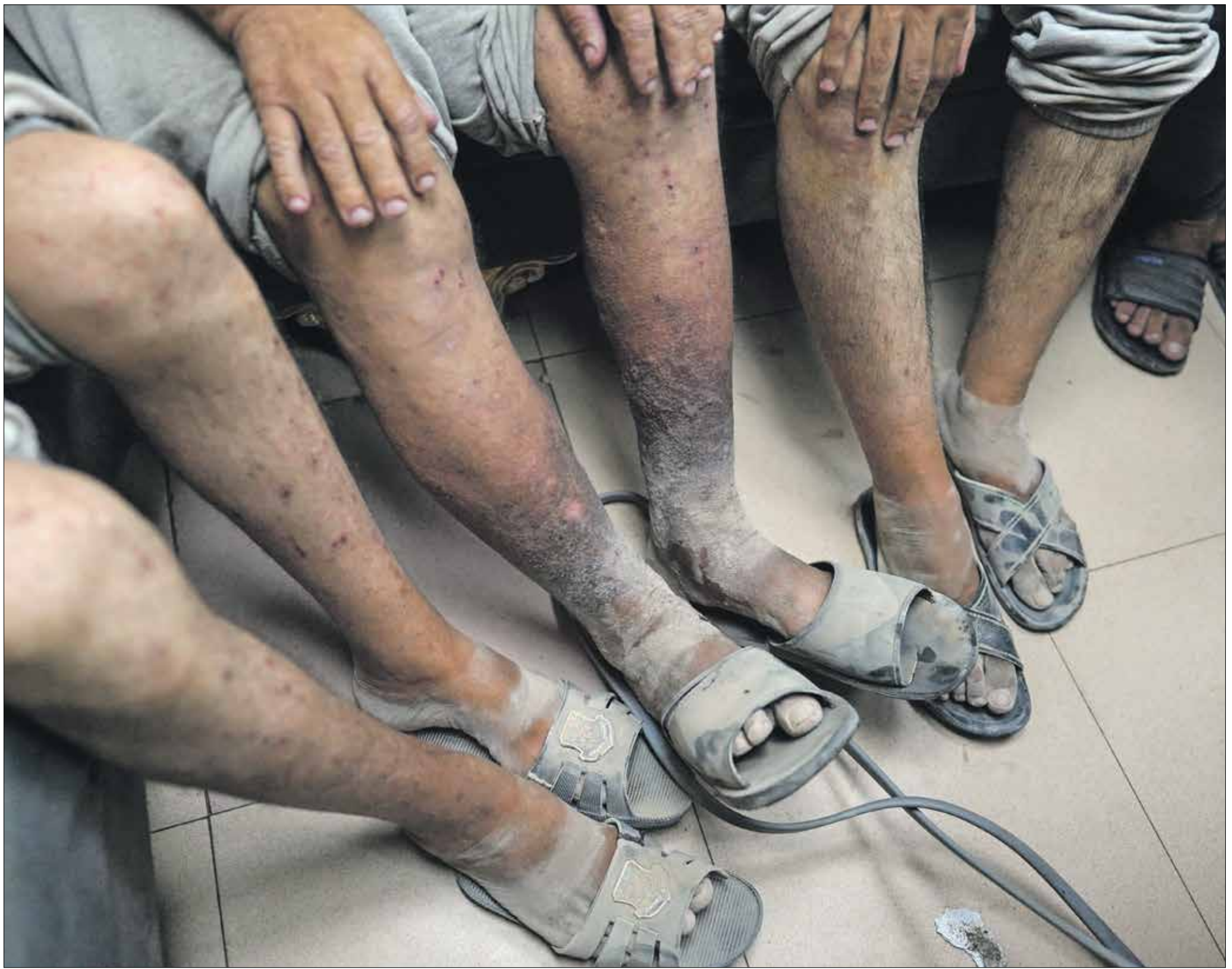
أقدام معتقلين فلسطينيين يصلون إلى مستشفى شهداء الأقصى بعد إطلاق سراحهم

أعلنت المفوضية السامية للأمم المتحدة لحقوق الإنسان أن فلسطينيين اعتقلتهم إسرائيل خلال الحرب على غزة احتجزوا في الغالب في معتقلات سرية، وفي بعض الحالات تعرضوا لمعاملة قد تصل إلى حد التعذيب، وذكرت أن آلاف الفلسطينيين أبعُدوا قسراً عن غزة، وأحياناً اعتُقلوا في ملاجئ الاحتماء من التفجيرات، واقتيدوا إلى مراكز اعتقال في إسرائيل، حيث