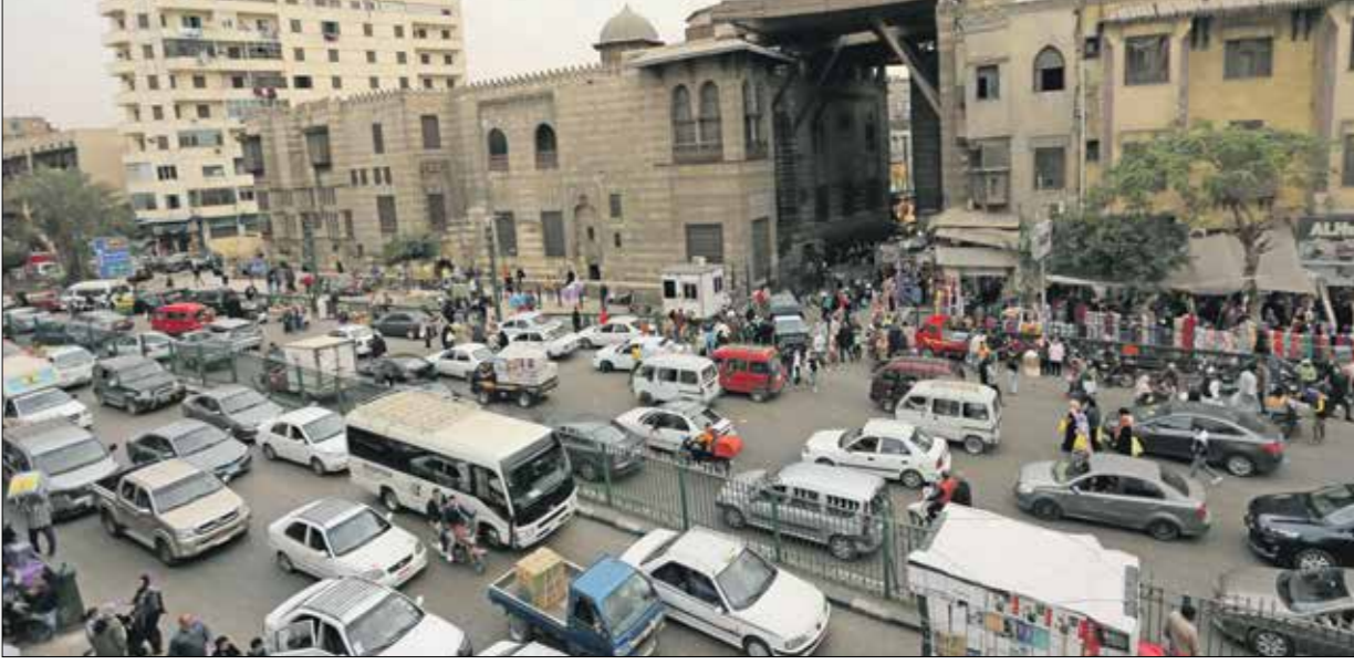
يقام الزحام الزم على شوارع مصر (مناظر جوية)

إغلاقها جميعها بالاقفلة والاكياس، حتى إنها كانت ملجأ لأسرته وأسر العشرات ممن وجدوا في المنزل رغم تزوجهم المتكرر. عاد طافش مكسور الخاطر وقد وجد زوجته وإبناه وعددًا من أقاربه النازحين ينتظرونه بالقرب من دوار بني سهيلا المدمر، فأخبرهم أن يعودوا إلى منطقة المواصي لعند وجود منزل ولا معالم، ويقول لـ «العربي الجديد»: «عدنا إلى منطقة المواصي حيث تمام النساء في خيمة كبيرة علما أنه كان قد تعرض لأضرار جسيمة ودمر دون جدواه ولا شيء. تغيرت المنطقة بالكامل، ولا أعرف أين أنا».