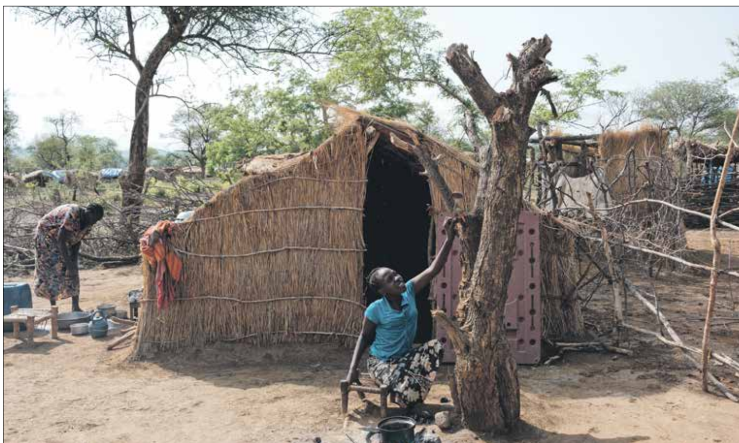
في كردفان