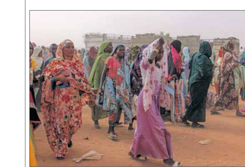
بعضاف الأزواج والنساء