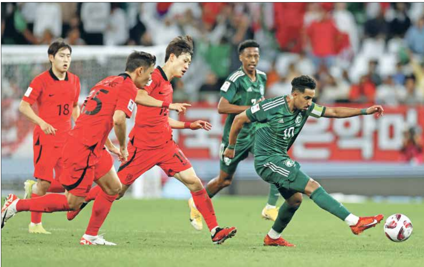
خيبة كبيرة للمنتخب السعودي بعد الخروج (زوربت كيانوف/ها/Getty)

وأعرب مانسيني عن حزنه الشديد لتوديع منتخبه بطولة كأس آسيا قطر 2023 من دور الـ16، حيث تقدم المدرب في المؤتمر الصحافي عقب المباراة بالاعتذار على مغادرته ملعب المباراة قبل انتهاء ركلات الترجيح، وقال: «كنت أعتقد أن ركلات الترجيح انتهت لذلك غادرت، وأشكر كل اللاعبين على ما قدموه أثناء المباراة، وقد تحسن دروبهم كثيرا». وعن الخسارة وتوديع البطولة، قال المدرب: «في كرة القدم هناك فوز وهزيمة».