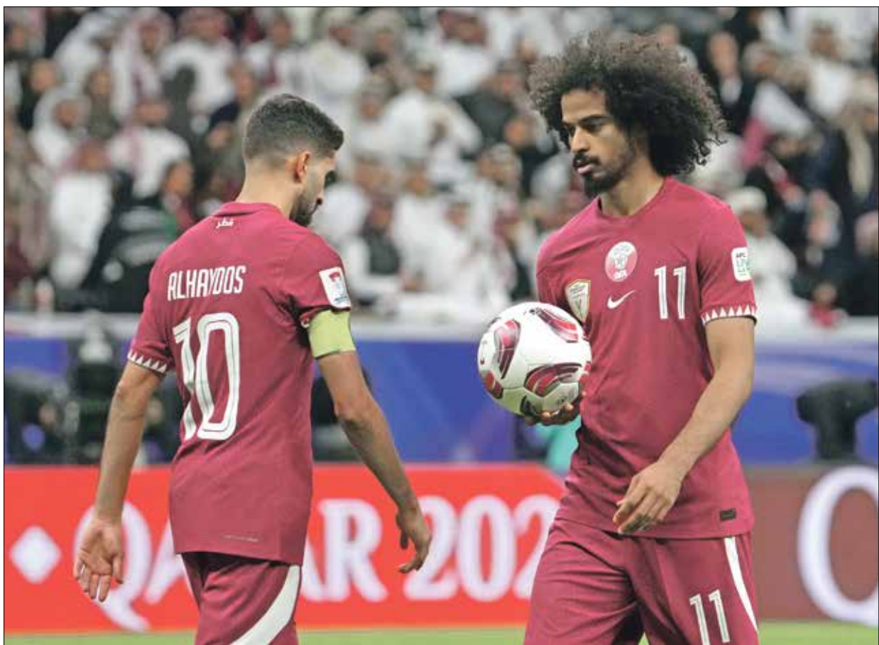
منتخب قطر يعتبر واحداً من المرشحين للقب

يعيش المنتخب القطري إياما طيبة بعد بلوغ الدور ربع النهائي لبطولة كأس آسيا 2023 لكرة القدم، وهو الذي يمتلك العديد من العناصر القادرة على صناعة الفارق، على غرار أكرم عفيف