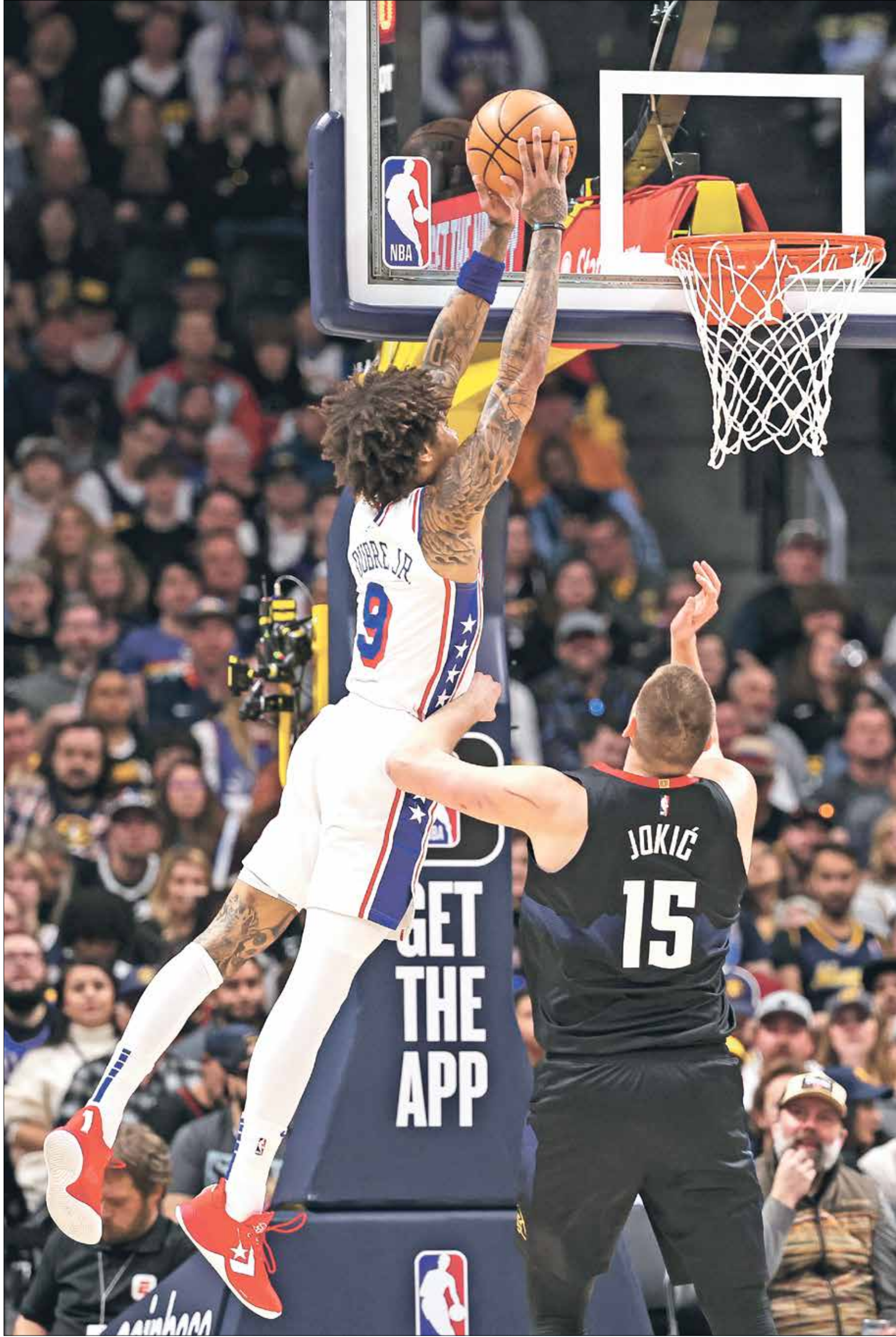
بمركز فريق فيلادلفيا في ظروف صعبة في الفترة الأخيرة

تعرض فريق فيلادلفيا سفنثي سيكسرز لضربة معنوية بإصابة نجمه جويك إمبيد في خسارته الرابعة توالياً والتي جاءت أمام منافسه غولدن ستايت ووريورز ونجمه ستيفن كوري 107 - 119، ضمن مباريات دوري كرة السلة الأميركية. وطغت إصابة إمبيد الذي سجل 14 نقطة والتقط 7 متابعات في 30 دقيقة قبل أن يخرج مصاباً، على تالف كوري صاحب الـ 37 نقطة، منها 8 رميات ثلاثية، فضلاً عن 8 متابعات و7 تمريرات حاسمة.