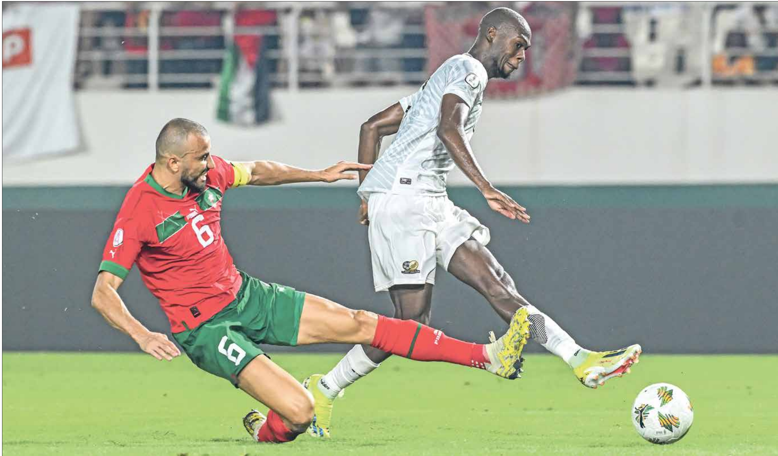
عالم منتخب جنوب أفريقيا أثناء كمنه بمراس بوسا

عند مدينة باموسوكرو. وحسم منتخب فرانك كيسيه استفادوا من هدايا المنتخبات الأخرى، ويتعلق الأمر بتعادل موزامبيق مع غانا في المجموعة الثانية، وانتصار المغرب على زامبيا بالمجموعة السادسة. كما نجح منتخب مالي في تخطي عقبة منتخب بوركينا فاسو في مباراة الدور الثاني، على ملعب «امادو جون كوليبالي» في مدينة كوروهغو، وذلك بالفوز بنتيجة هدفين مقابل هدف واحد، علماً أن منتخب «النسور» بلغ هذا الدور بعدما تصدرت المجموعة الخامسة التي ضمت منتخبات جنوب أفريقيا وناميبيا وتونس، أما آخر مباريات الدور ربع النهائي لبطولة كأس أمم أفريقيا لكرة القدم، فهي التي ستجمع بين منتخب جنوب أفريقيا والراس الأخضر، السبت المقبل، على ملعب «تشارلز كونان