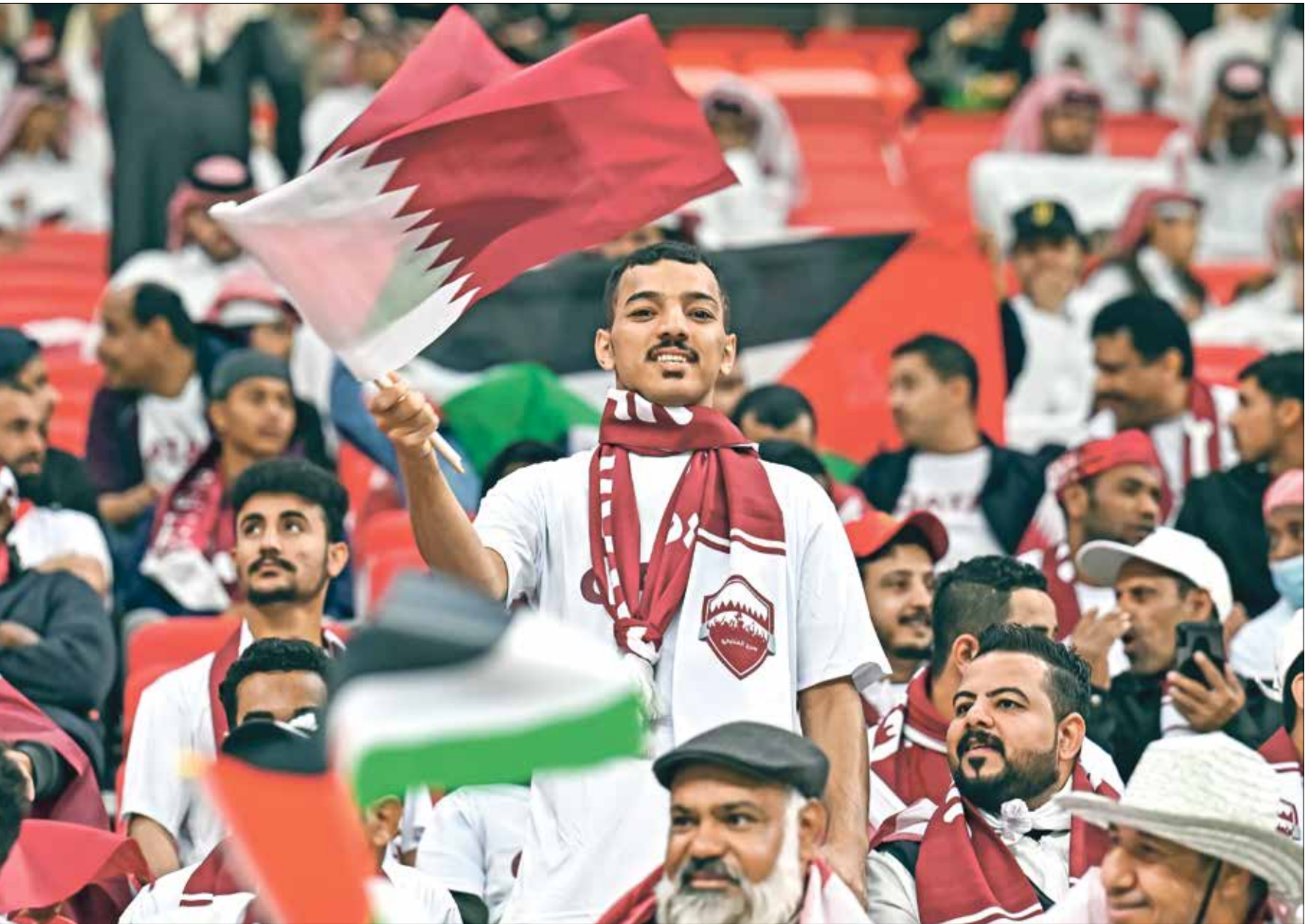
الدعم الجماهيري القطري استثنائي

ولرغبته في الوصول بعيدا في كأس آسيا قطر 2023، معربا عن رضاه عن النتائج التي حققها لاعوه حتى الآن، ومشددا على أنه سيعمل على رفع الجاهزية والاستعداد بأفضل صورة ممكنة قبل مواجهة منتخب قطر. وعن تأثير الضغط الجماهيري في المباراة المقبلة، لفت المدرب السلوفيني إلى أنه يتوقع بالفعل دعما ومساندة جماهيرية كبيرة لمنتخب قطر لأنه يخوض البطولة على أرضه، لكنه يعول على خبرة لاعبيه في التعامل مع ذلك الضغط، ويتعامل مع الأمر بالصورة اللازمة حتى يحافظ على حظوظه في الفوز والتأهل لنصف النهائي.